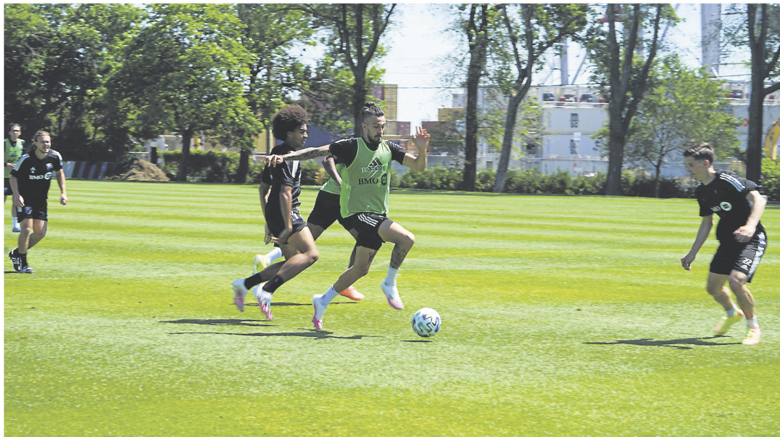
Les joueurs de l'Impact ont pu recommencer à s'entraîner en équipe jeudi, la Direction de la santé publique du Québec ayant accepté la demande de l'organisation conformément au protocole de santé et de sécurité soumis au gouvernement et à la MLS.