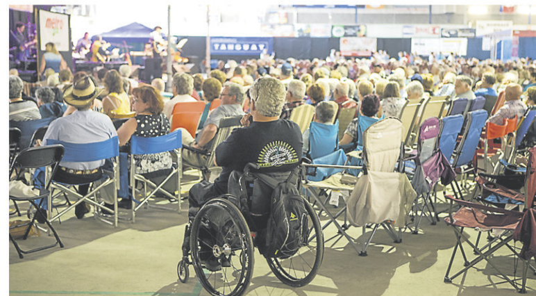
À défaut de pouvoir présenter un vrai festival cette année, le Festiroule Country de Trois-Rivières présentera une soirée virtuelle ce samedi.

Rappelons que Le Festiroule est un festival-bénéfice qui vient en aide à l'organisme Bureau d'Aide