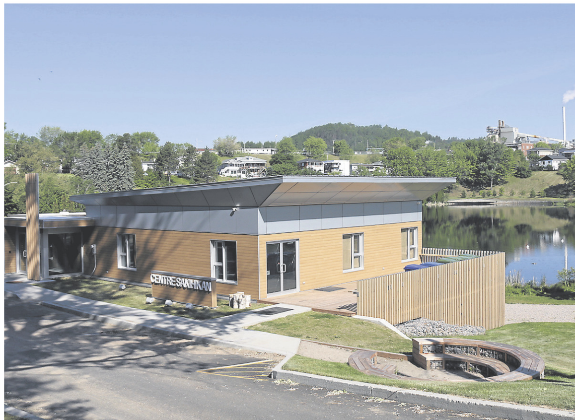
Le Centre Sakihikan va se transformer en studio d'enregistrement pour la Journée nationale des peuples autochtones.

Cette fête annuelle, forte en couleur et en émotions, est une occasion privilégiée de faire rayonner la richesse de la culture autochtone et de contribuer au rapprochement des peuples. Pour le CAALT,