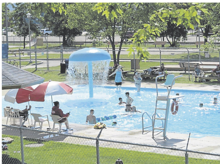
La piscine publique ouvrira samedi à La Tuque.

LA TUQUE — La piscine publique du parc Saint-Eugène à La Tuque ouvrira ce samedi 20 juin pour toute la période estivale. La piscine extérieure municipale sera ouverte au public tous les jours entre 13 h et 18 h avec de nouvelles consignes sanitaires. Afin d'être en mesure d'offrir un point de rafraîchissement sécuritaire, dans le contexte de la COVID-19, l'équipe municipale a mis en place plusieurs nouvelles mesures recommandées par l'Association des responsables aquatique du Québec et la Société de sauvetage pour respecter les consignes sanitaires de la Santé publique. Ces mesures pourront être ajustées si les consignes de la Santé publique changent.