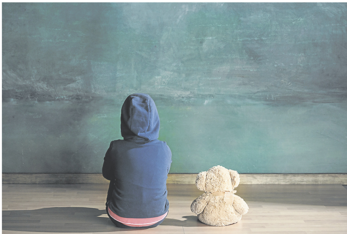
L'accès aux services de santé et de services sociaux pour les enfants issus de l'immigration présentant un retard de développement constitue une question qui mérite l'attention des chercheurs québécois.