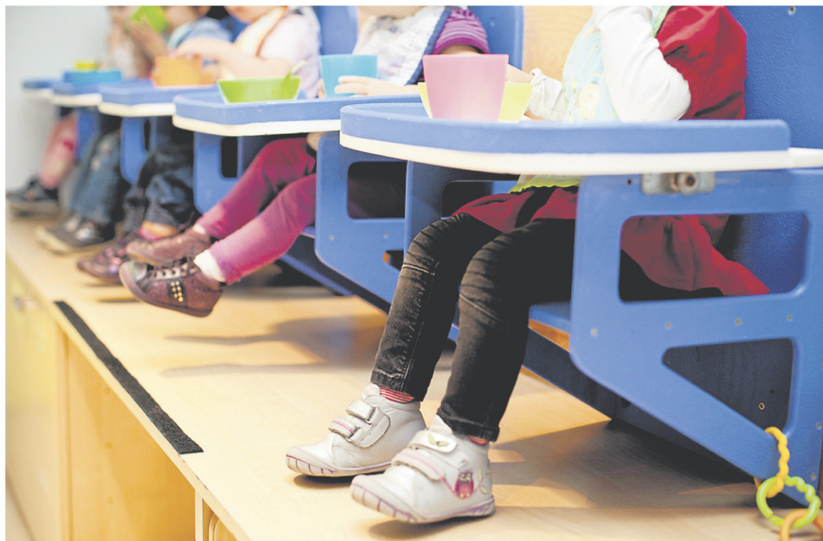
La règle de distanciation entre les enfants d'un même groupe, soit un maximum de dix enfants, et entre les enfants et leur éducatrice attirée, est abolie.

Un Québécois sur deux (46 %) se serait mieux préparé financièrement si une autre crise majeure survenait d'ici 5 ans, 48 % le seraient aussi bien et seulement 6 % moins bien, indique un sondage Question Re-traité réalisé en collaboration avec SOM.