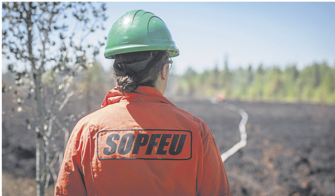
La SOPFEU combat actuellement un incendie de forêt dans le secteur de Clova.

Une équipe d'Urgence-Environnement s'est également rendue à Clova après que la direction