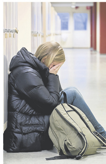
Le guide vise à aider les parents à réagir et à intervenir auprès de leurs jeunes.

Le guide vise à les aider à réagir et à intervenir auprès de leurs jeunes, à les accompagner et à les informer de leurs droits avec