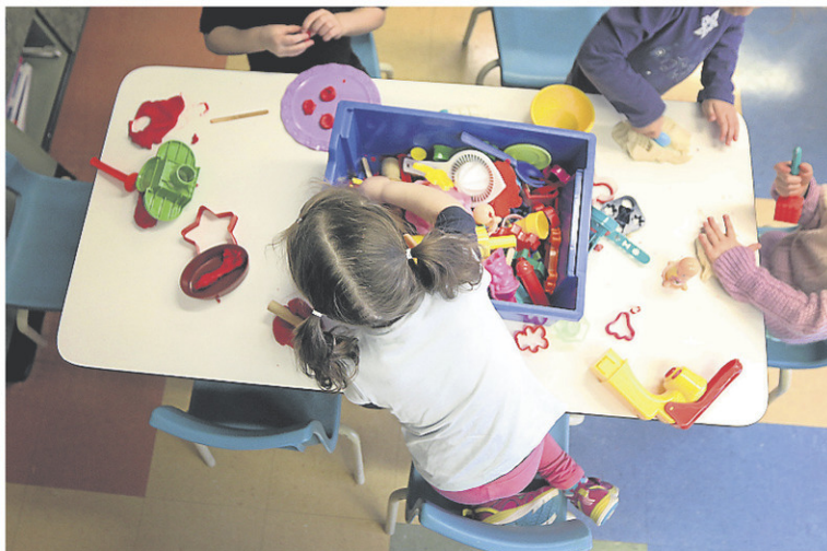
En raison de l'urgence sanitaire, les éducatrices en milieu familial se sont longuement questionnées quant au meilleur moment pour déclencher la grève.

«Les responsables de services de garde souhaitent se faire entendre