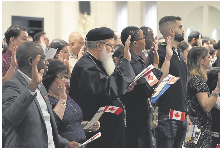
Pour l'auteur de cette lettre, il est temps que les décisions sur les politiques d'immigration soient prises par les seuls Québécois.

Ce dont le Québec a un besoin criant, ce sont des personnes qui maîtrisent les technologies de pointe et les méthodes scientifiques; par exemple, des analystes-programmeurs, des développeurs de logiciels, des concepteurs de circuits intégrés numériques, des ingénieurs mécaniques, des ingénieurs en robotique, des infirmières cliniciennes, etc. Mais aussi du personnel expérimenté, notamment en agriculture. Une telle immigration serait une source de prospérité pour le Québec. Le Québec n'aurait pas à payer pour leur formation car ils arriveraient ici à un âge où ils sont immédiatement productifs et, ce qui n'est pas négligeable, prêts à donner leur part d'impôts.