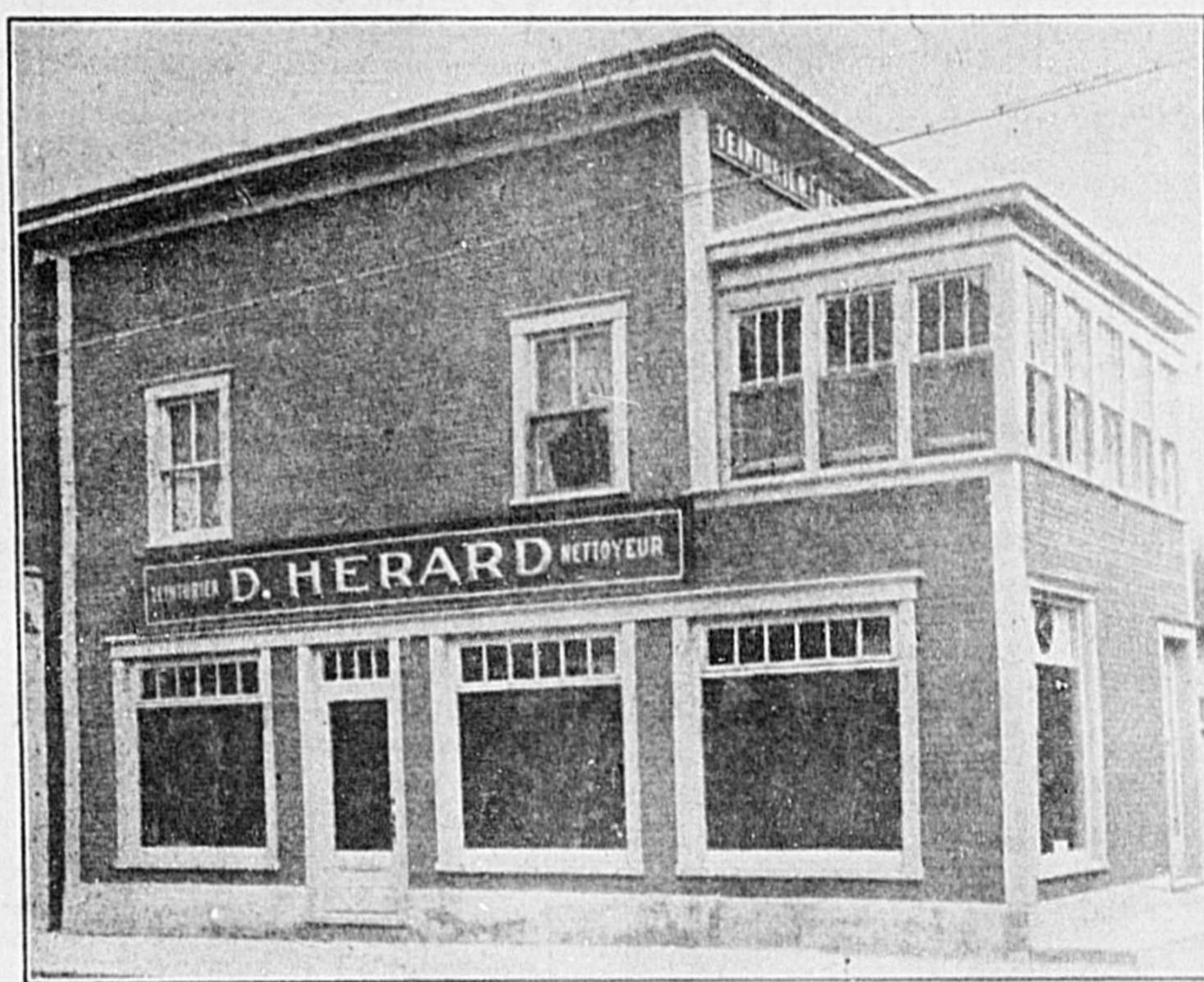
LA MAISON D. HERARD

60, rue Cascades Tél. 406 Saint-Hyacinthe