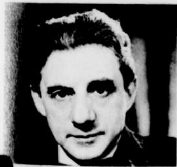
JOHN BARBIROLLI dirige un concerto de Tchaïkovsky, à «Oeuvres concertantes», vendredi à 16 h 00.