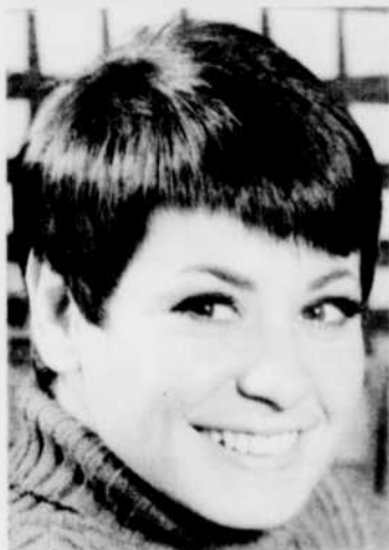
GINETTE RENO est l'invitée de «Place aux femmes», lundi à 14 h 30.