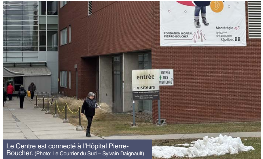
Le Centre est connecté à l'Hôpital Pierre-Boucher.

Une clinique de dysphagie et d'autres services spécialisés s'ajouteront au cours de la prochaine année. Une entente avec le CHU Sainte-Justine permettra aussi de développer de nouvelles cliniques à moyen terme.