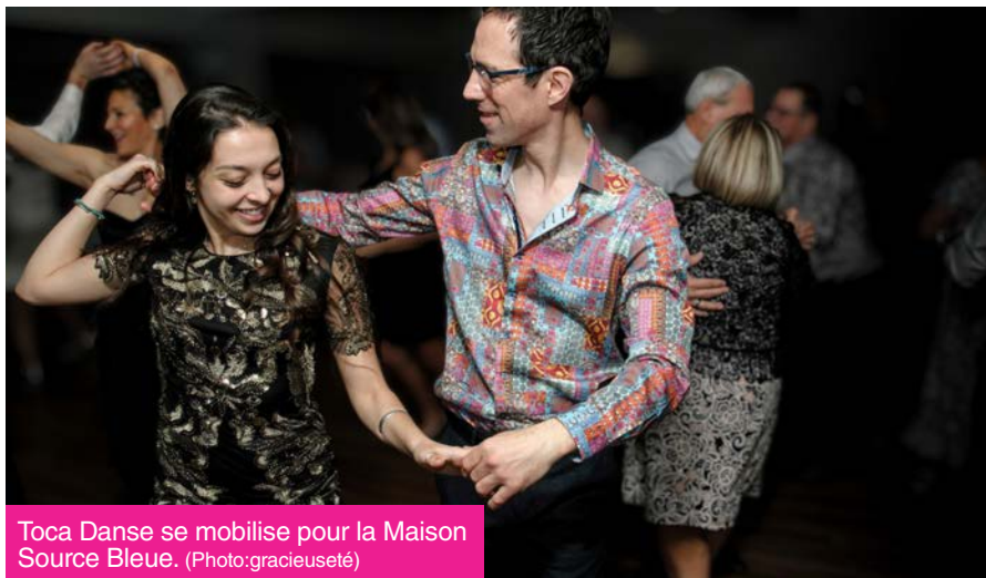
Toca Danse se mobilise pour la Maison Source Bleue.

Pour une deuxième année consécutive, l'école de danse latine Toca Danse associe son Bal d'hiver à une cause caritative. L'événement, qui se tiendra le 31 janvier à Boucherville, permettra d'amasser des fonds pour la Maison Source Bleue, un organisme reconnu pour son rôle essentiel en soins palliatifs.