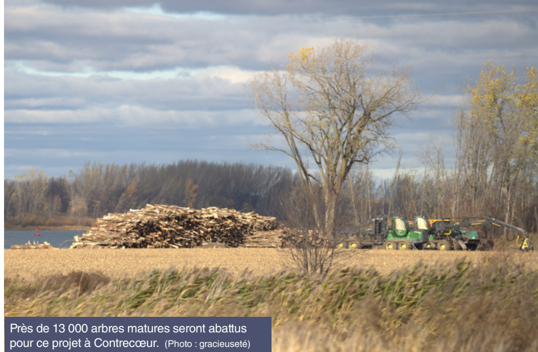
Près de 13 000 arbres matures seront abattus pour ce projet à Contrecoeur.

Pour consulter l'étude commandée par SNAP Québec : https://snapquebec.org