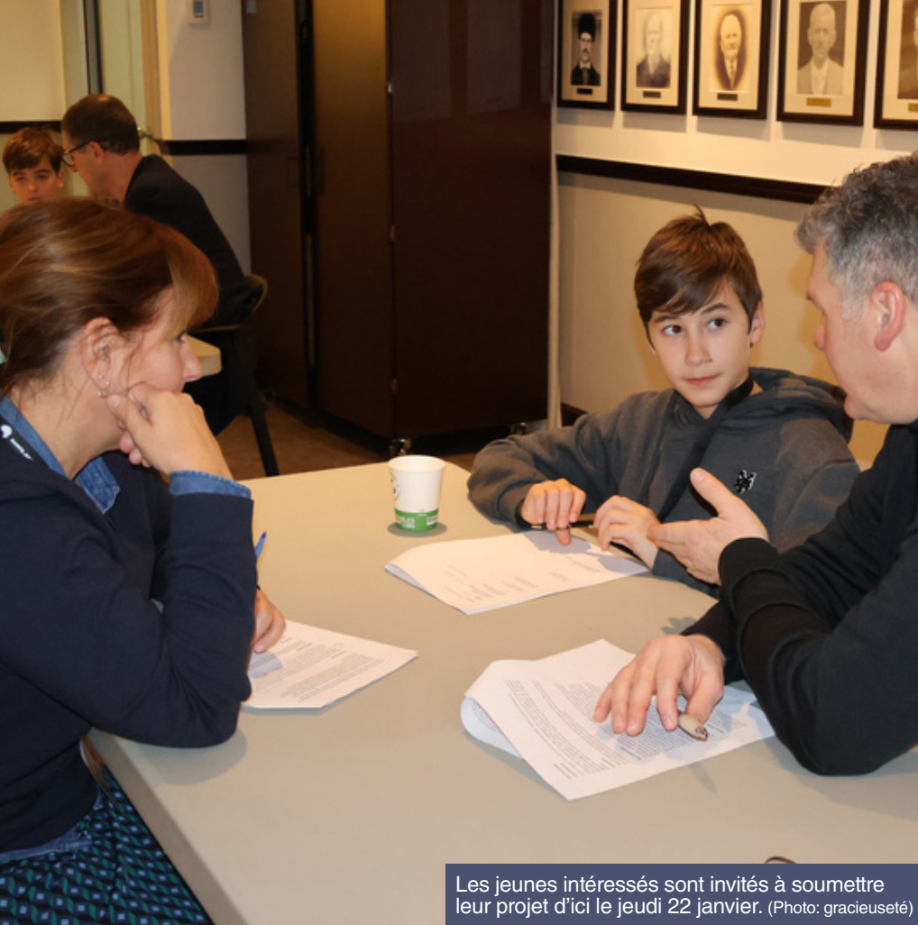
Les jeunes intéressés sont invités à soumettre leur projet d'ici le jeudi 22 janvier.