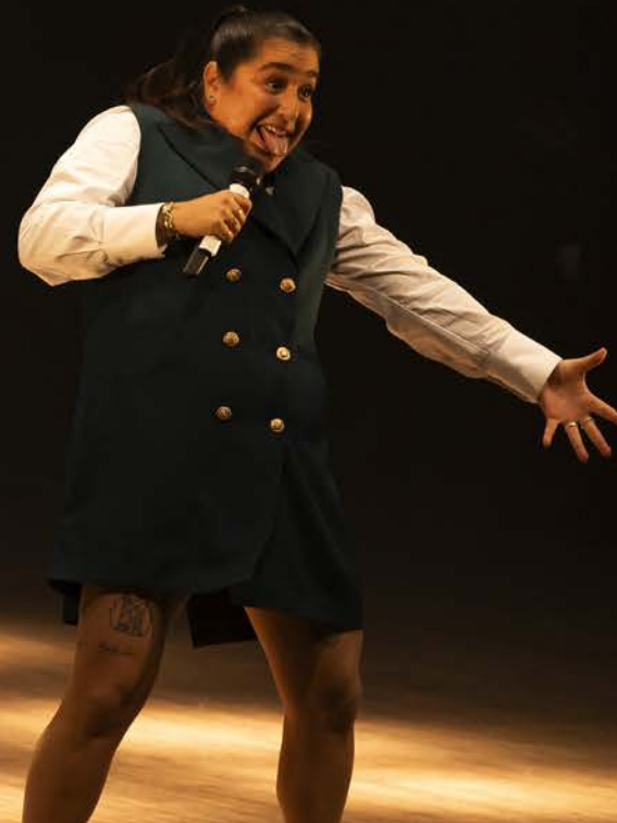
Mariana Mazza dans Foie gras