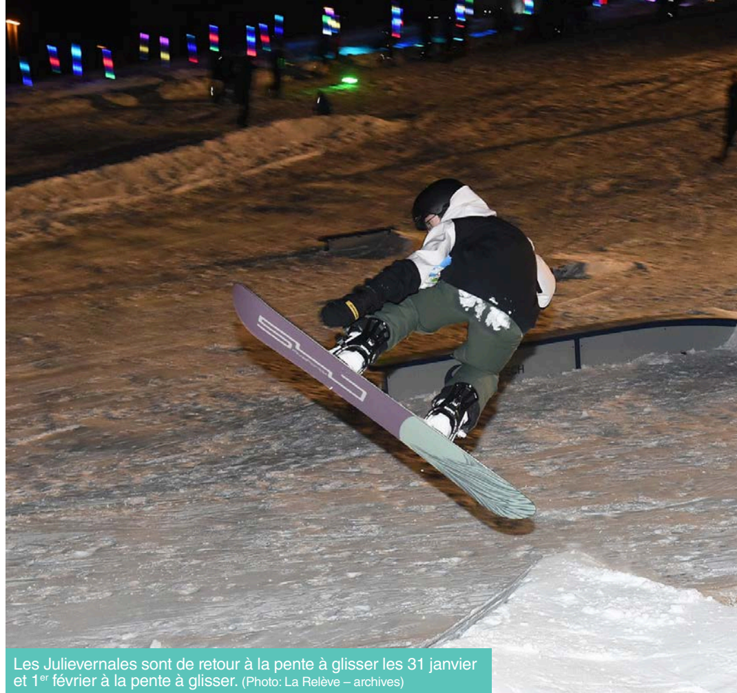
Les Julievernales sont de retour à la pente à glisser les 31 janvier et 1 er février à la pente à glisser.

traditionnel concours Bricole ton traîneau et le Carrefour Familial de Sainte-Julie animera des activités pour les tout-petits. Des zones de chaleur aussi seront accessibles sur le site durant ces deux journées.