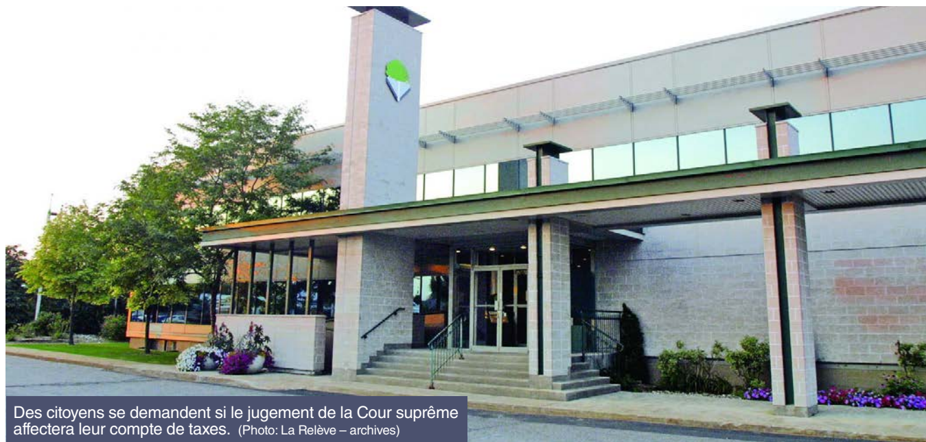
Des citoyens se demandent si le jugement de la Cour suprême affectera leur compte de taxes.

DANIEL BASTIN // DBASTIN@GRAVITEMEDIA.COM