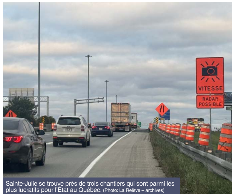
Sainte-Julie se trouve près de trois chantiers qui sont parmi les plus lucratifs pour l'État au Québec.

Il ne faut pas oublier que les travaux au tunnel Louis-Hippolyte-La Fontaine sont toujours en cours et que les radars photo mobiles ont émis en 2025 plus de 40 000 constats dans les deux sens de l'autoroute. Cela a permis d'amasser plus de 13 M$ et la valeur moyenne des amendes atteignait 335$. La limite de vitesse dans ce tronçon est de 50 km/h.