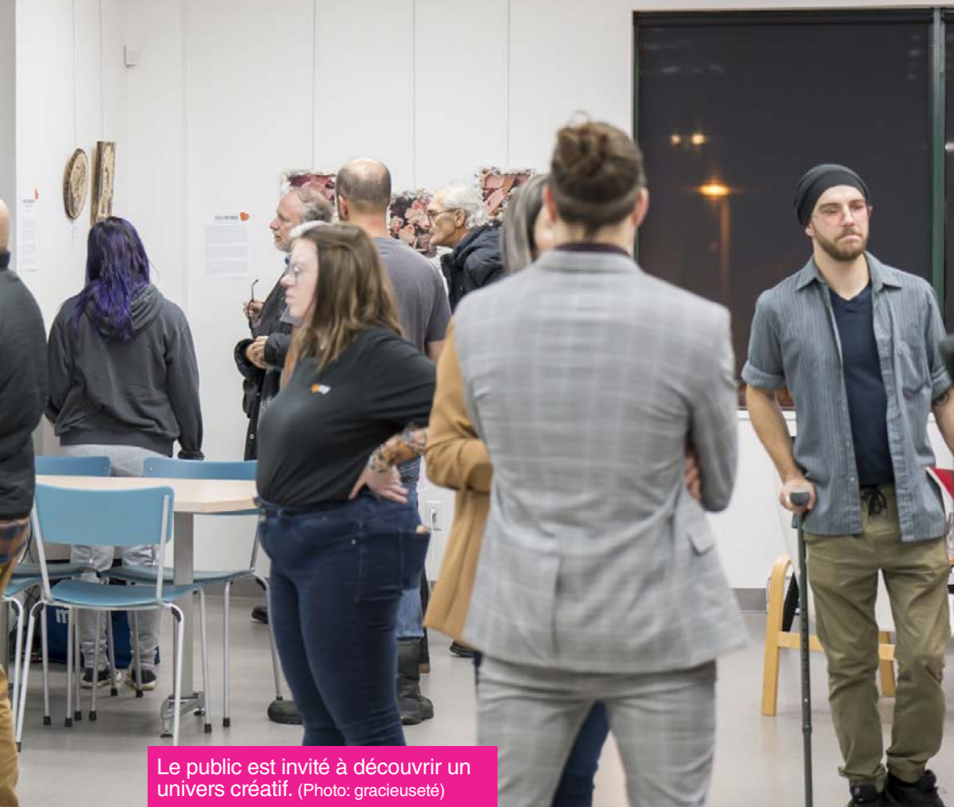
Le public est invité à découvrir un univers créatif.

L'activité est gratuite, mais le nombre de places est limité. La réservation est fortement recommandée, soit en ligne, soit par courriel (va@cjemy.org)