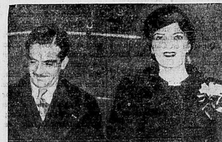
M. Anthony Eden et Mme. Eden quittant New York à bord du Queen Mary après une visite aux Etats-Unis.