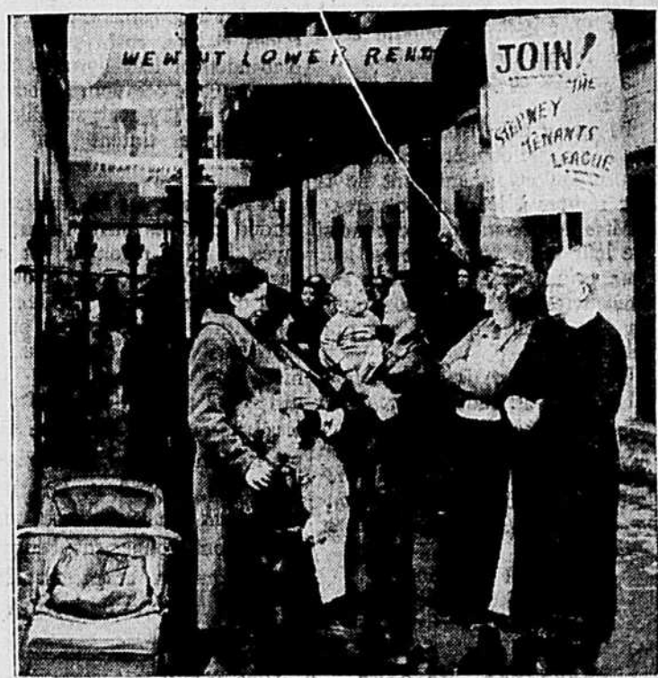
Les ménagères de Londres ont organisé un mouvement pour baisser les prix des loyers spécialement dans les districts de taudis.