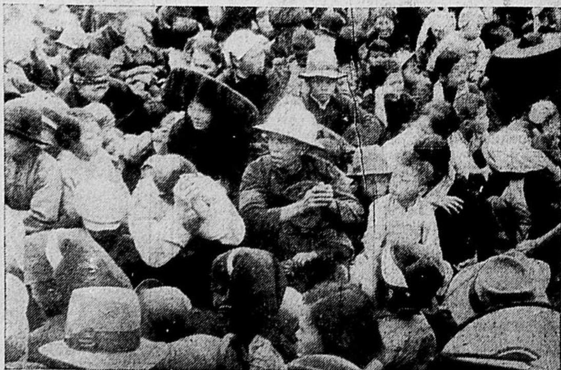
Cette photo montre une section d'un camp de concentration à Hong Kong dans le territoire anglais. 600,000 citoyens chinois se sont réfugiés dans ce camp quelques heures avant les envahisseurs japonais soient parvenus à la frontière.