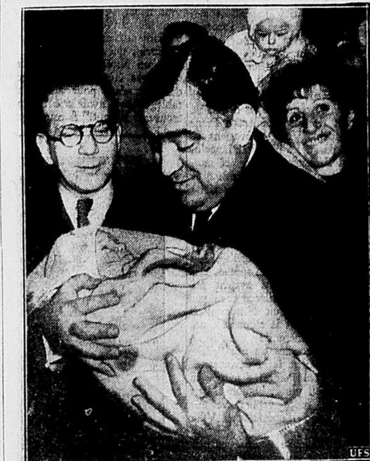
On voit ici le maire La Guardia de New York tenant un des bébés dans ses bras lors de l'ouverture d'une crèche à New York. Récemment le maire a reçu une lettre portant une swastika et contenant une balle. La police est en train d'enquêter au sujet de cette menace.