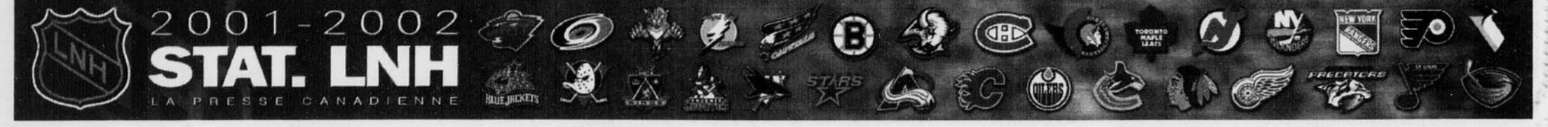
(Les matchs d'hiver ne sont pas comptés)

«Je suis fier de ce que j'ai réalisé depuis le début de la saison. J'ai exécuté des sauts plus difficiles que la majorité des athlètes et effectué mes descentes dans les meilleurs temps. Plus d'une fois, les classements lors des compétitions n'étaient pas significatifs. Il y a un problème de compétence chez les juges surtout en Europe et de la sorte, la coupe du monde perd de la notoriété», estime-t-il soulignant que plusieurs autres ont fait état de la piètre qualité des jugements.