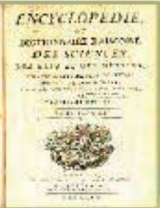
◀ Denis Diderot et Jean Le Rond d'Alembert. Encyclopédie, ou, Dictionnaire raisonné des sciences, des arts et des métiers. 3 e éd. (1777-1779)