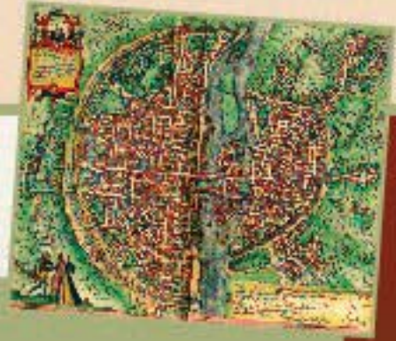
Georg Braun. Theâtre des cités du monde. (vers 1574).