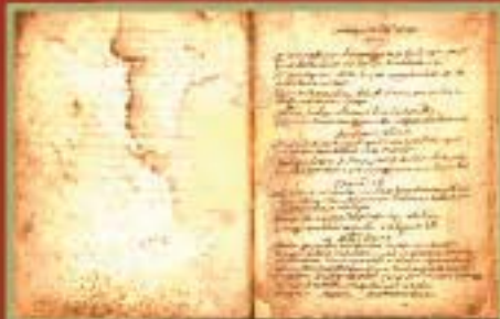
◀ Cantiques Etc. en huron. (1660)