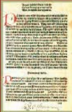
◀ Saint Thomas d'Aquin. Incipit summa edita a Sancto Thoma de Aquino de articulis fidei, et ecclesie sacramentis. (1472)