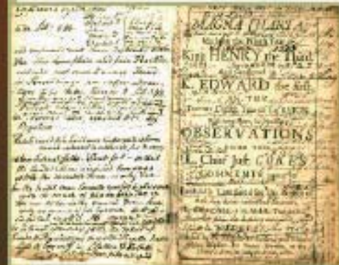
Magna charta. (1680) ▲