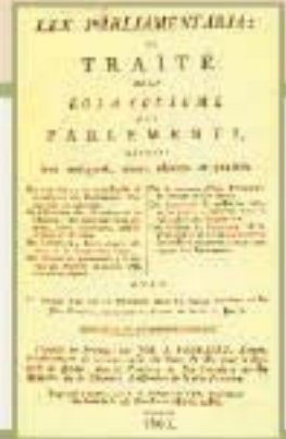
George Petyt. Lex parliamentaria, ou, Traité de la loi et coutume des parlements, montrant leur antiquité, noms, espèces et qualités. (1803)