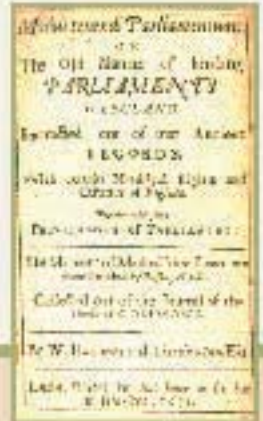
William Hakewill. Modus tenendi parliamentum, or, The old manner of holding parliaments in England. (1671)