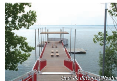
Quai de détente à Verdun