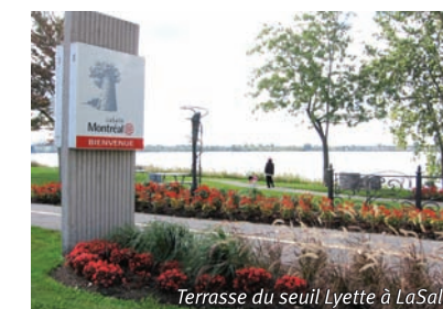
Terrasse du seuil Lyette à LaSalle