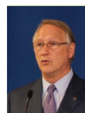
Gérald Tremblay Maire de Montréal et président de la Communauté

L'événement a connu un franc succès. Il a eu lieu en présence de députés, d'élus du monde municipal, de professionnels du domaine de l'habitation, de directeurs et directrices des offices municipaux d'habitation (OMH), de représentants de la Société d'habitation du Québec (SHQ), du ministère des Affaires municipales et des Régions (MAMR), de groupes de ressources techniques (GRT), d'organismes communautaires et de membres de la société civile.