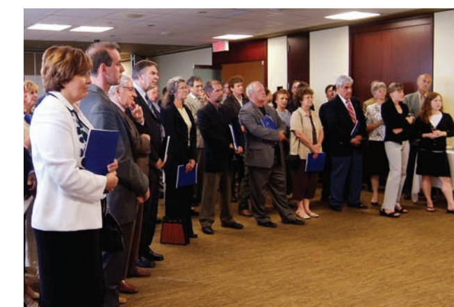
Lancement officiel des Orientations de la Communauté métropolitaine de Montréal en matière de logement social et abordable.

Le document d'orientations, ainsi que d'autres rubriques d'information ayant trait aux interventions de la CMM en matière de logement social et abordable, peuvent être consultés sur le site Internet de la Communauté à l'adresse suivante : www.cmm.qc.ca . Des copies du document d'orientations sont également disponibles sur demande auprès de la CMM.