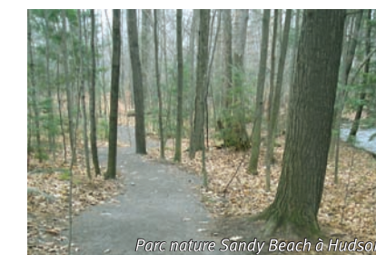
Parc nature Sandy Beach à Hudson

Les citoyens de la région métropolitaine de Montréal peuvent désormais profiter de trois nouveaux projets financés dans le cadre du Second plan d'action pour l'accessibilité aux rives et aux plans d'eau du Grand Montréal Bleu, aussi appelé Fonds bleu, soit :