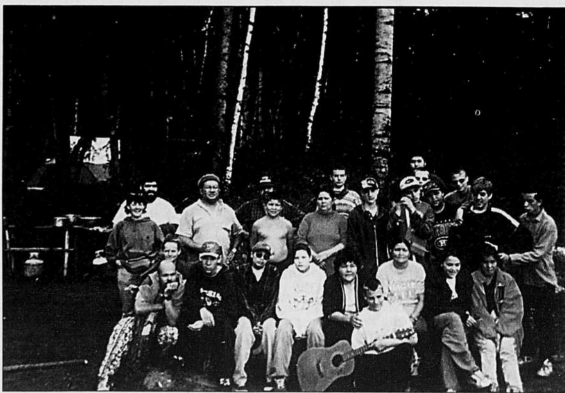
Les jeunes Atikameks et les jeunes Français réunis au lac Kempt avec leurs moniteurs.

Le jeune homme, s'il avait eu le choix, serait resté plus longtemps au Québec et