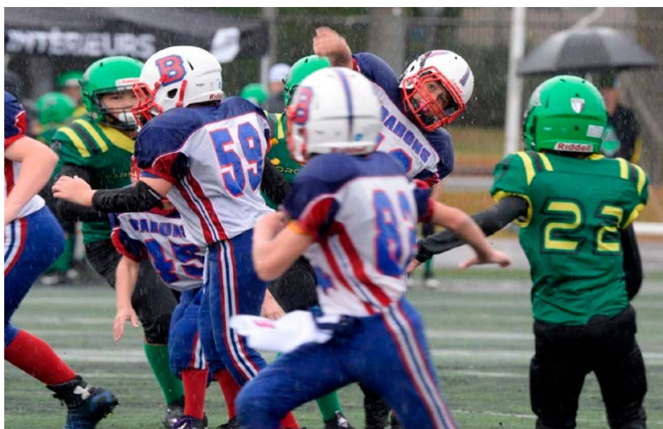
Les deux clubs se sont livrés un match nul de 14-14.

Pour réagir à cet article : redaction@versants.com