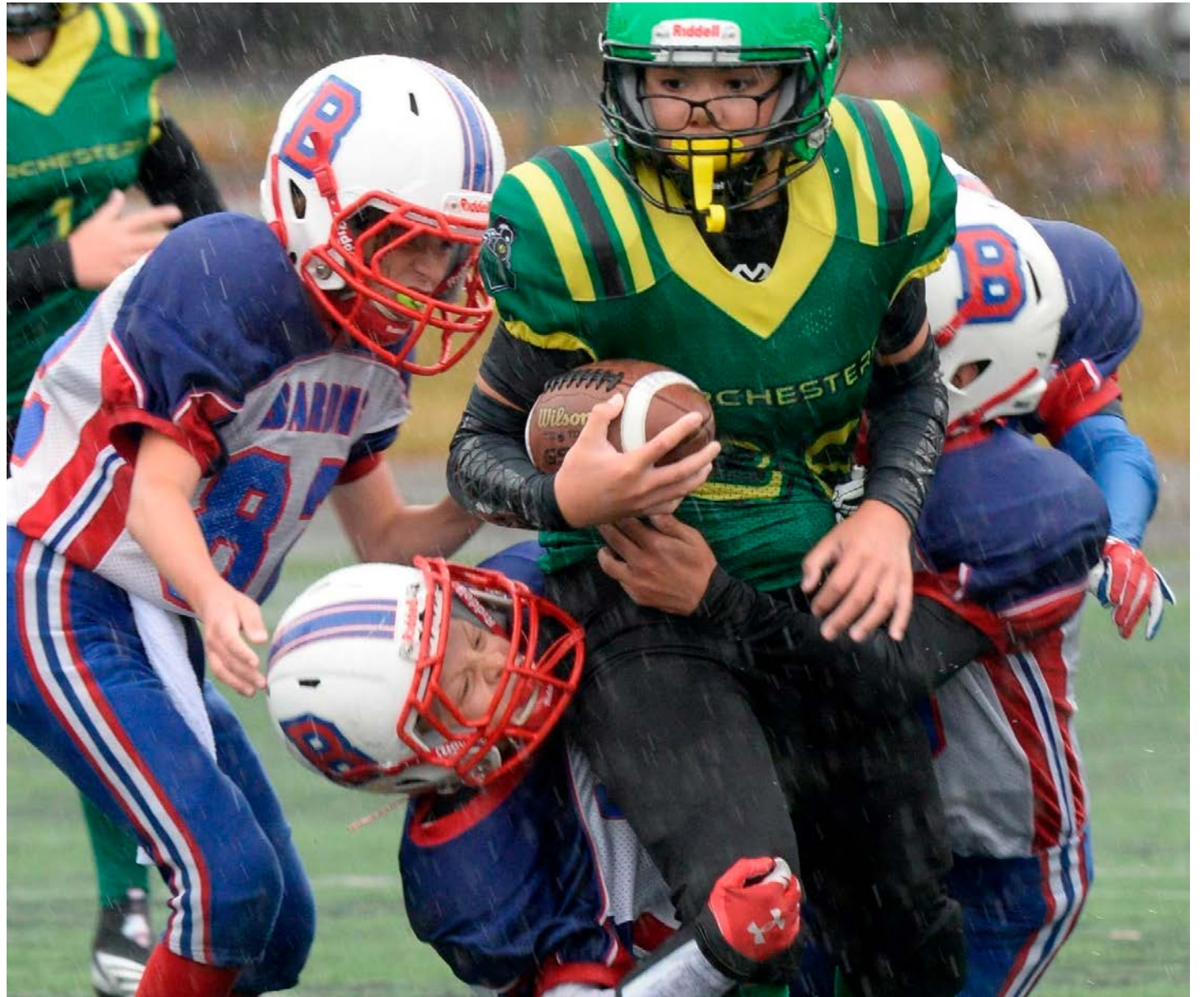
La forte pluie n'a pas empêché les joueurs de tout laisser sur le terrain.