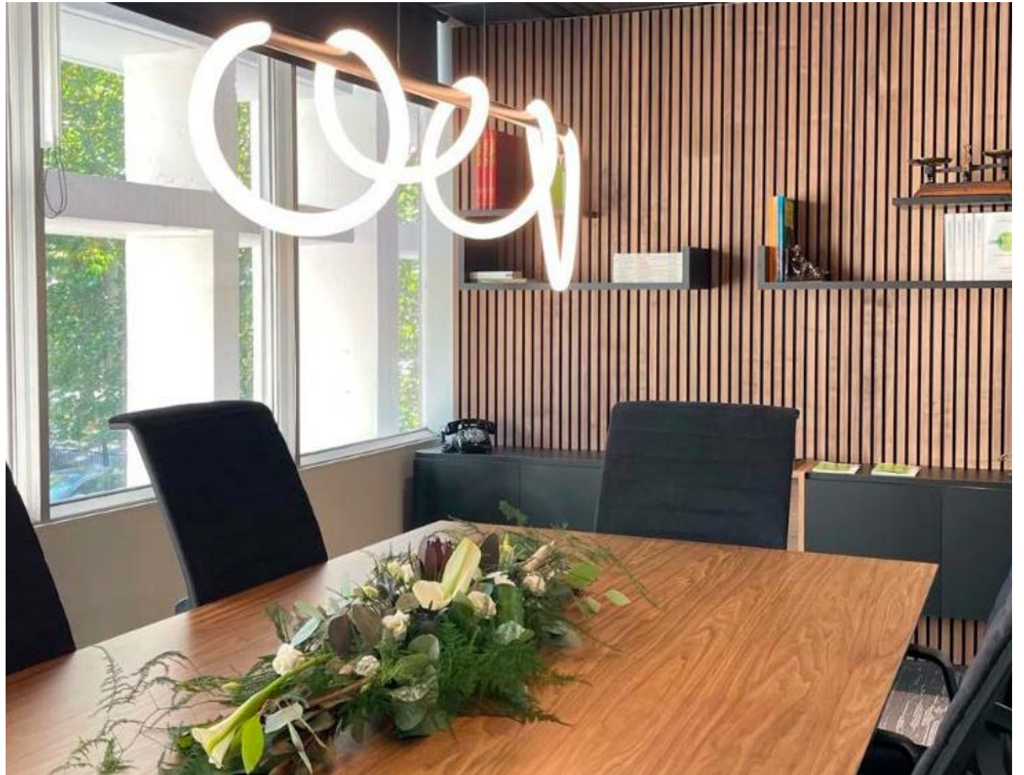
Le bureau de COTE 100 à Québec.