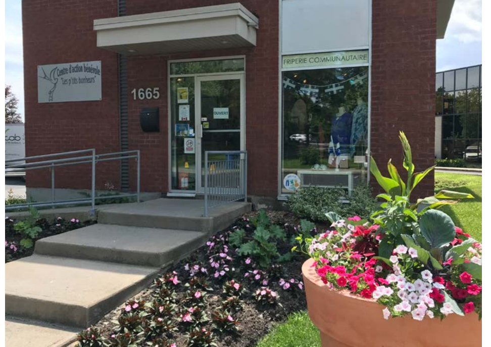
Le CAB vient en aide aux familles à faible revenu à l'approche de la rentrée scolaire.

Le thème de la Journée internationale des personnes âgées 2023 était « Vieillir, un heureux défi », un défi que propose le CAB de Saint-Bruno, qui compte parmi ses bénévoles de nombreux retraités.