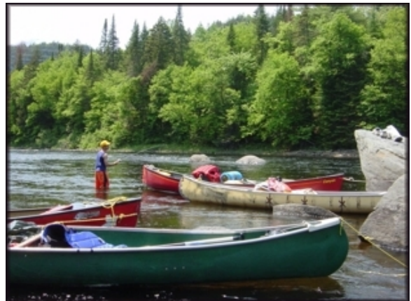
Rivière Bastiscan, juin 2003

La qualité des eaux du bassin de la rivière Bastiscan est étroitement liée à l'occupation de son territoire. Ainsi, la partie nord du bassin versant est largement dominée par la forêt et est peu peuplée. La portion sud du bassin versant, qui repose sur les basses terres du Saint-Laurent, est utilisée à des fins agricoles et est plus densément peuplée. La qualité de l'eau est bonne ou satisfaisante sur le cours principal de la rivière Bastiscan à cause du débit élevé de la rivière et des charges polluantes peu importantes. En dépit de l'assainissement des eaux usées municipales, la qualité de l'eau observée dans le sous-bassin de la rivière des Envies est cependant moins bonne. Elle varie de douteuse, en aval de Saint-Tite, à mauvaise près de l'embouchure. Pour ce petit sous-bassin versant, les activités agricoles, qui sont responsables d'un peu plus de 60 % des apports en phosphore et d'une érosion importante, engendrent une turbidité élevée dans le cours d'eau.