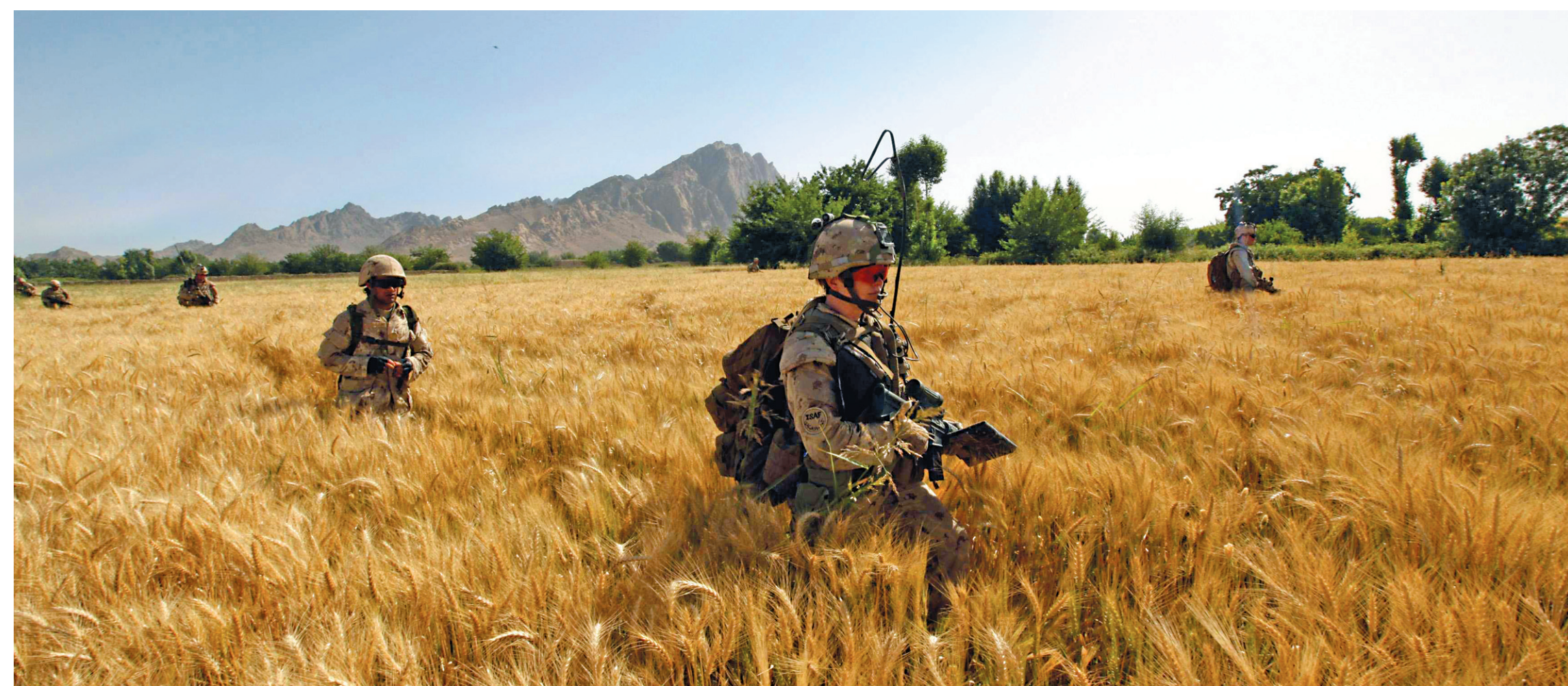
Des soldats canadiens du 1 er bataillon du Régiment royal du Canada patrouillant dans le district de Panjwai, au sud-ouest de Kandahar, en mai 2010. Après une présence de 10 ans en Afghanistan, le Canada a cessé ses opérations de combat en juillet dernier.