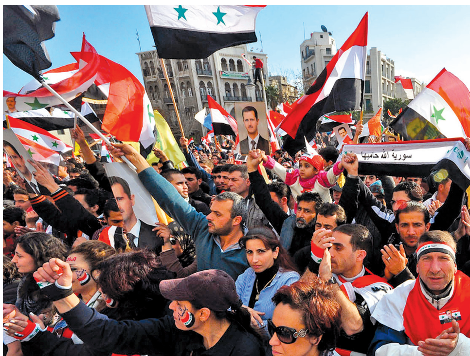
Les manifestations se poursuivent quotidiennement à Damas contre le régime du président Al-Assad.

Les 15 membres du Conseil de sécurité de l'ONU ont condamné hier «dans les termes les plus forts les attentats» perpétrés à