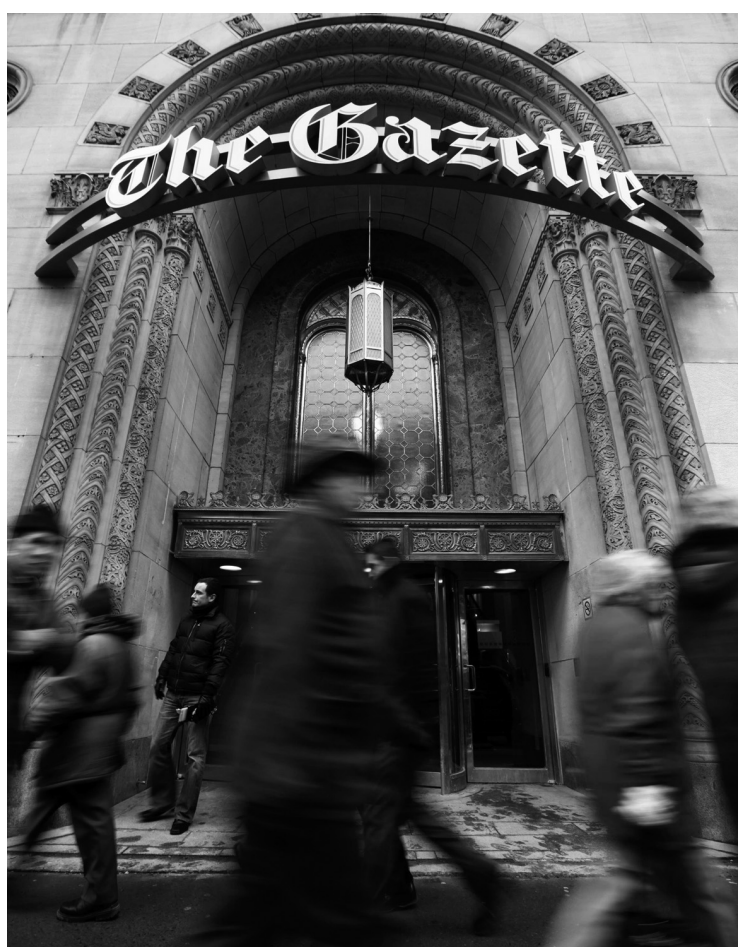
The Gazette engagera «des poursuites judiciaires immédiates» si une loi est adoptée au Québec pour créer «différentes classes de personnes en ce qui concerne le journalisme ou l'accès à l'information», affirme Alan Allnutt.

Quebecor s'est retirée du CPQ comme de tous les tribunaux d'honneur du Canada. M. Allnutt