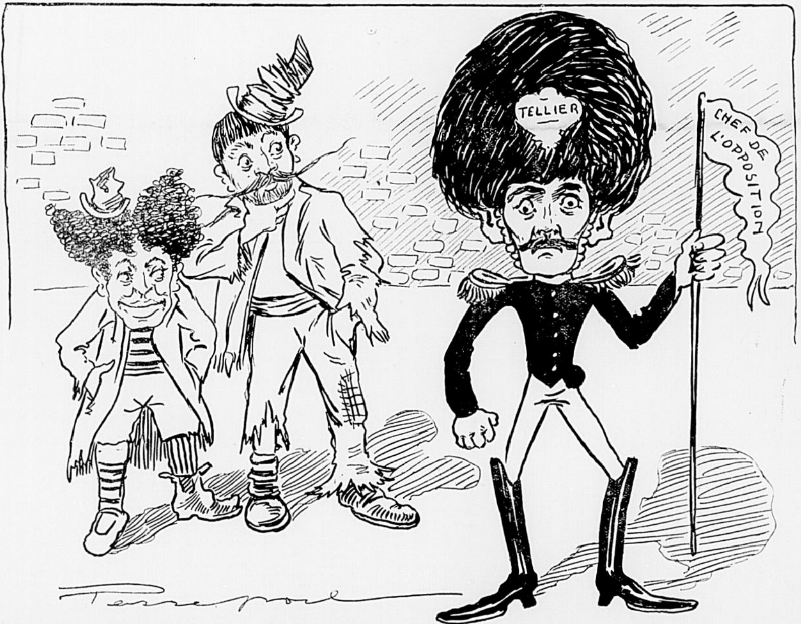
BOURASSA.—Batêche ! encore un' "job" que j'ai manquée. LAVERGNE.—C'est ben sacrant, boss !