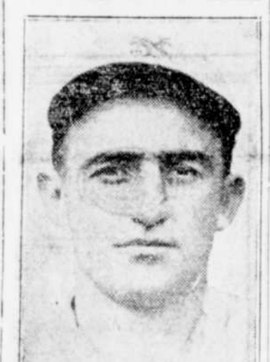
Frank FRISCH, autolieu des New York Giants, mais qui vient d'être transféré au St-Louis en échange de Rogers Hornsby.

Voici le score box de la partie de dimanche: TROIS-RIVIERES Noms AB R H PO A E Lamothe . . . . . 5 0 1 0 0 0 Guy . . . . . 5 0 1 1 1 0 Richard . . . . . 3 0 0 2 0 0 Garriety . . . . . 3 0 2 0 0 0 Betteau . . . . . 3 0 0 2 0 0 Dubé . . . . . 4 1 0 0 8 0 Bellefleur . . . . . 4 0 0 0 0 0 Miron . . . . . 4 0 1 2 4 1 Gauthier . . . . . 3 0 2 8 0 0 34 1 7 24 13 1