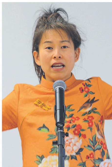
Une rencontre virtuelle avec l'auteure Kim Thúy est proposée par le Centre de femmes du Haut-Richelieu.

Réunies chaque année sous la bannière Collectif 8 mars, plusieurs organisations