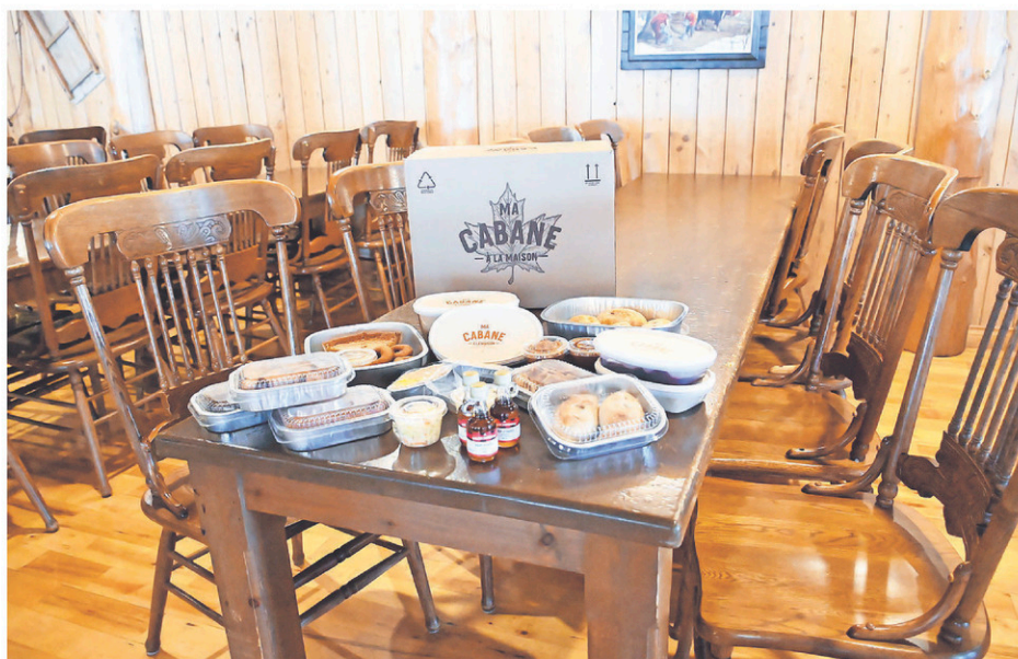
Les citoyens peuvent vivre le temps des sucres à domicile en commandant une boîte de repas de la campagne Ma cabane à la maison.