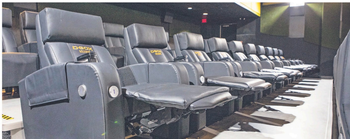
Les salles du Cinéma Capitol ne peuvent accueillir plus de la moitié de leur capacité habituelle.

Le Capitol ne peut cependant pas accueillir plus de 50 % de sa capacité par salle, conformément aux lignes directrices fournies par les autorités de santé publique. Les mesures de sécurité et de nettoyage renforcées continuent de s'appliquer, tout comme