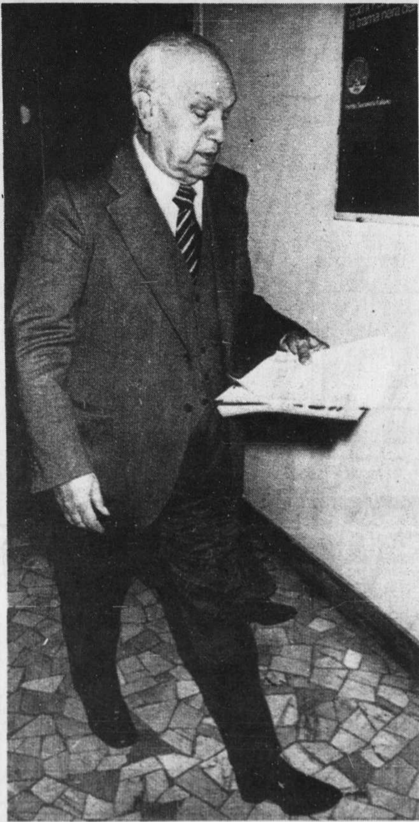
M. Francesco de Martino, secrétaire général du Parti socialiste italien, à la sortie de la session où fut prise la décision de retirer l'appui "extérieur" au gouvernement Aldo Moro. Rome entre dans sa 37e crise ministérielle, 411 jours après la précédente.