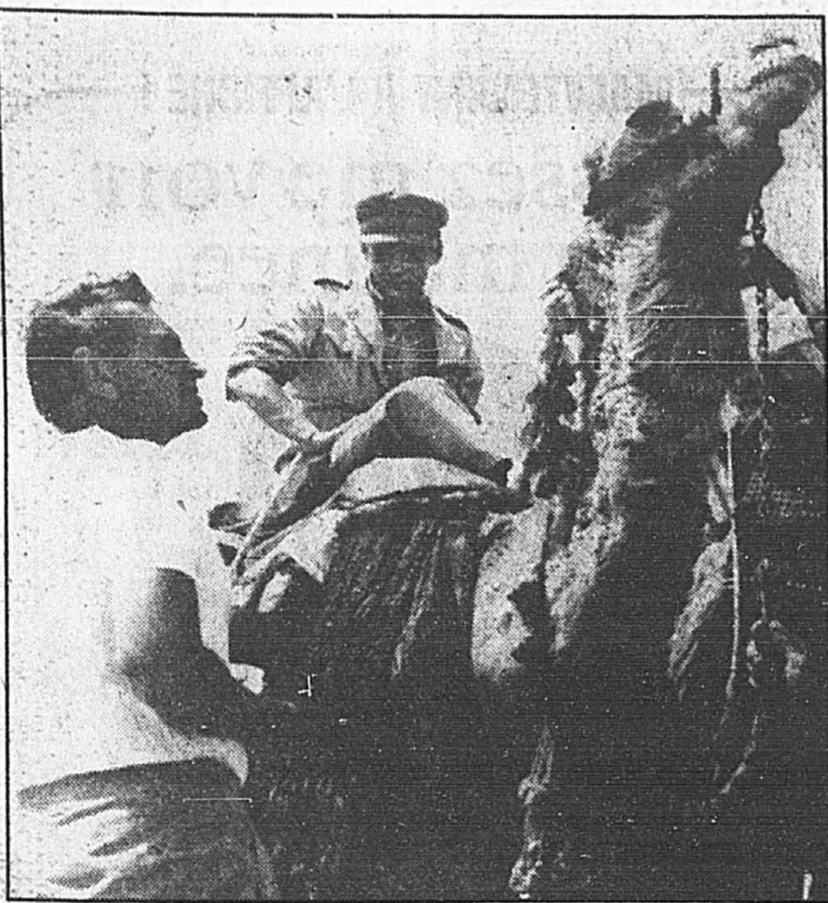
Cette photo d'archives datant de 1961 montre le metteur en scène David Lean en train de parler avec l'acteur britannique Peter O'Toole, assis sur un chameau, durant le tournage du film Lawrence d'Arabie .

Par ailleurs des billets à 100 $ l'unité (tirage le 29 mai) sont en vente pour la campagne de financement 1991 de l'organisme. La compagnie de câble Cogeco y contribue pour 20 000 $, la Banque Nationale pour 80 000 $; l'objectif global est 500 000 $.