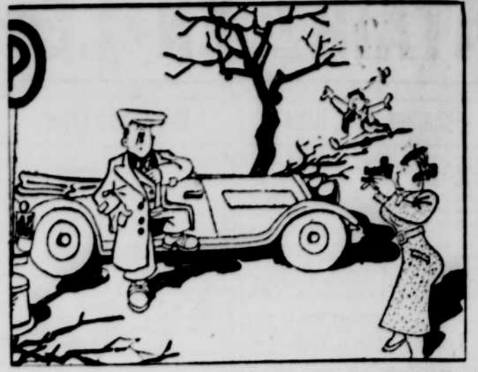
Prends vite cette photo, chérie, car voici le propriétaire de la voiture.