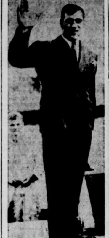
Le géant italien Primo Carnera

qui vient de convoier au pays du "bel canto". Les nouvelles disaient, hier soir, que la traîne de la marie mesurait 26 pieds.