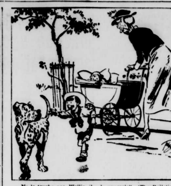
— Ne le touche pas, Wellie, il a la rougeole! — (The Bulletin)