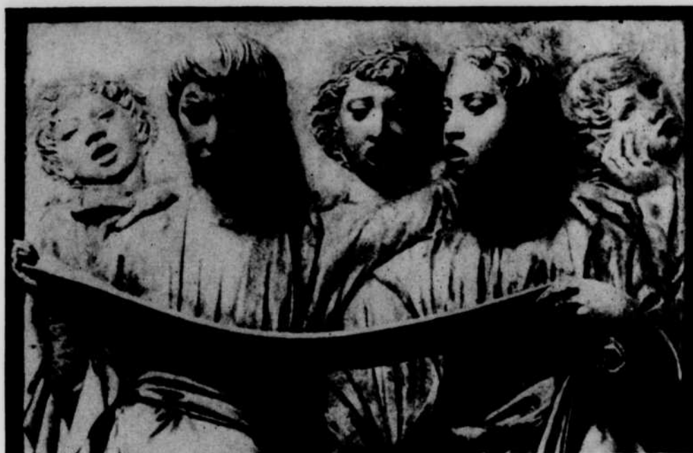
Bas-relief de Luca della Robbia, XVe siècle.