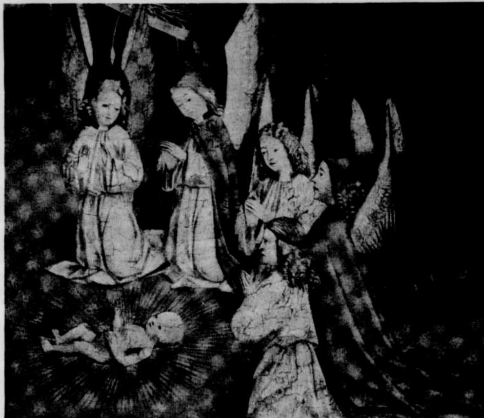
Maître de Liesborn, XV e siècle