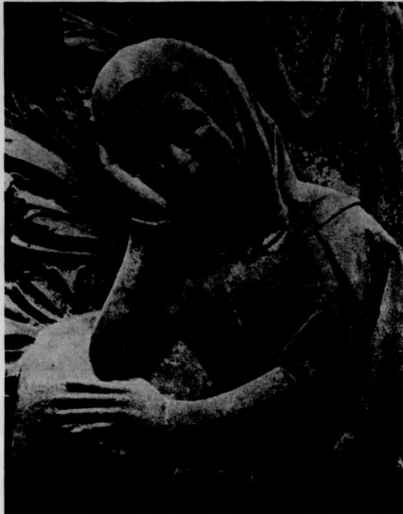
Une Vierge de Notre-Dame de Paris.

Images de la Nativité sera réalisé par Gilles Potvin.