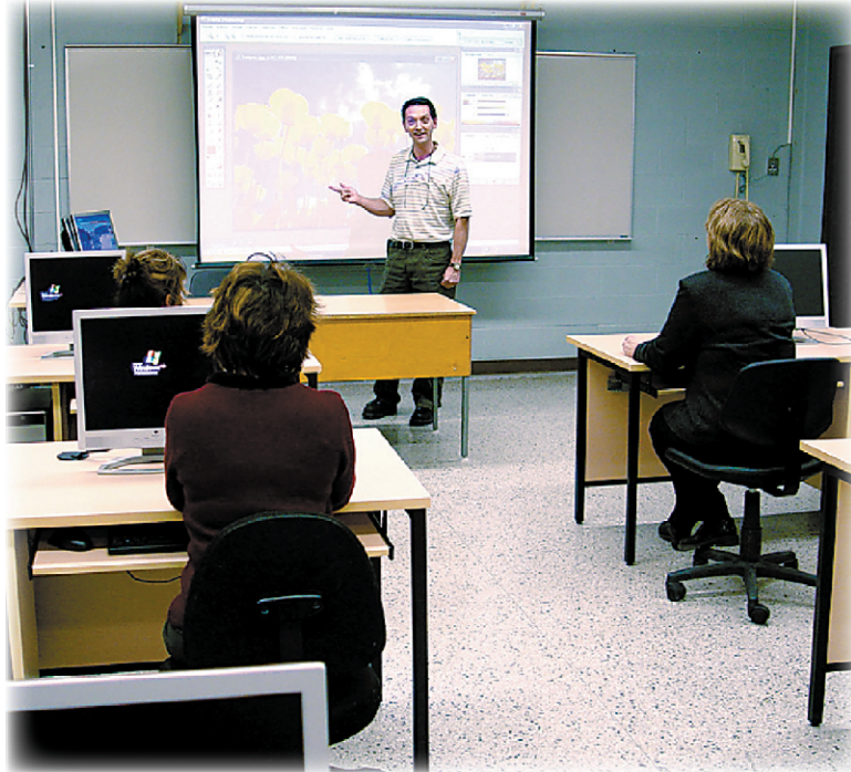
Le Service de formation continue du Collège Shawinigan offre la Reconnaissance des Acquis et des Compétences (RAC).

Cette démarche constitue une autre façon de répondre aux standards et exigences attendus pour l'obtention du diplôme ou de l'attestation. Elle est de ce fait reconnue par le Ministère de l'éducation du loisir et du sport. La RAC est une démarche