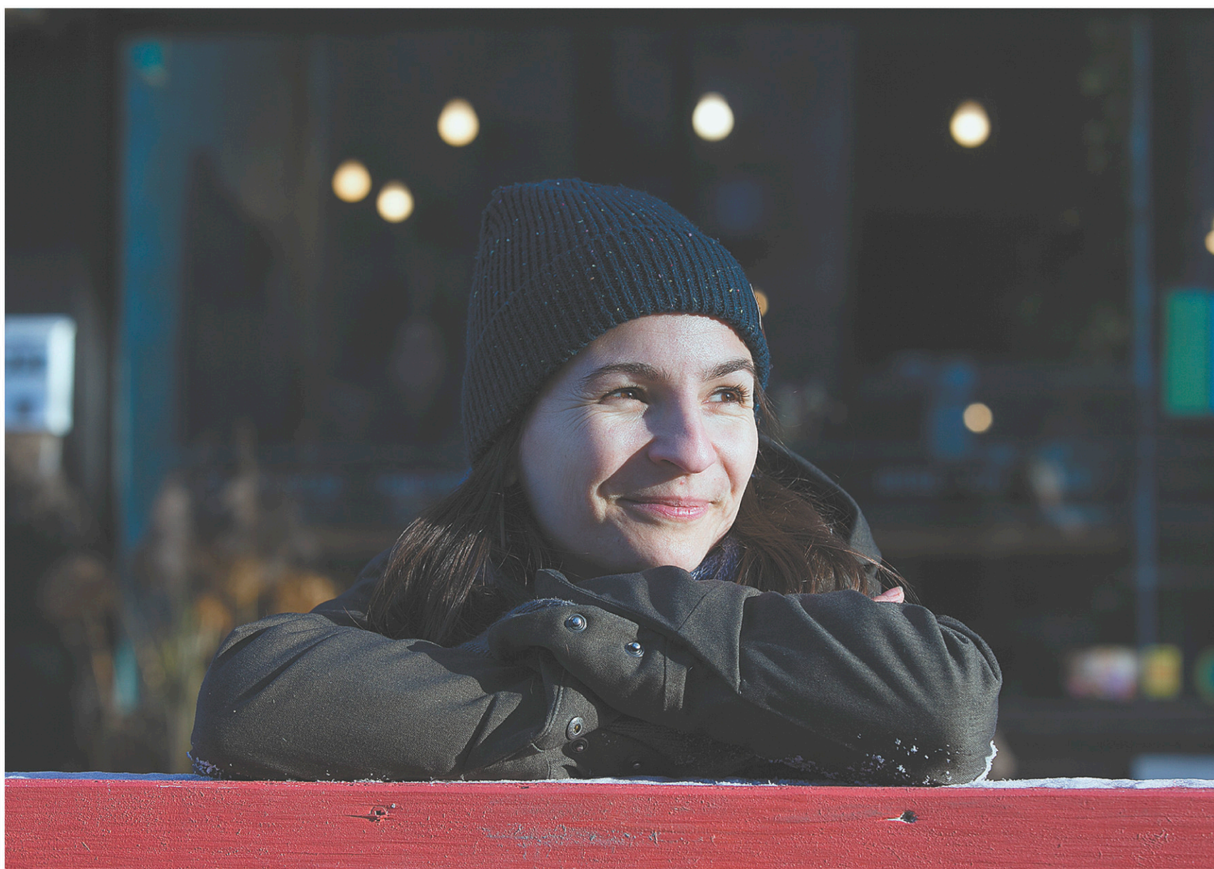
Le langage juridique s'invite dans Procès verbal pour défendre la parole complexe, plurivoque, responsable et lente.