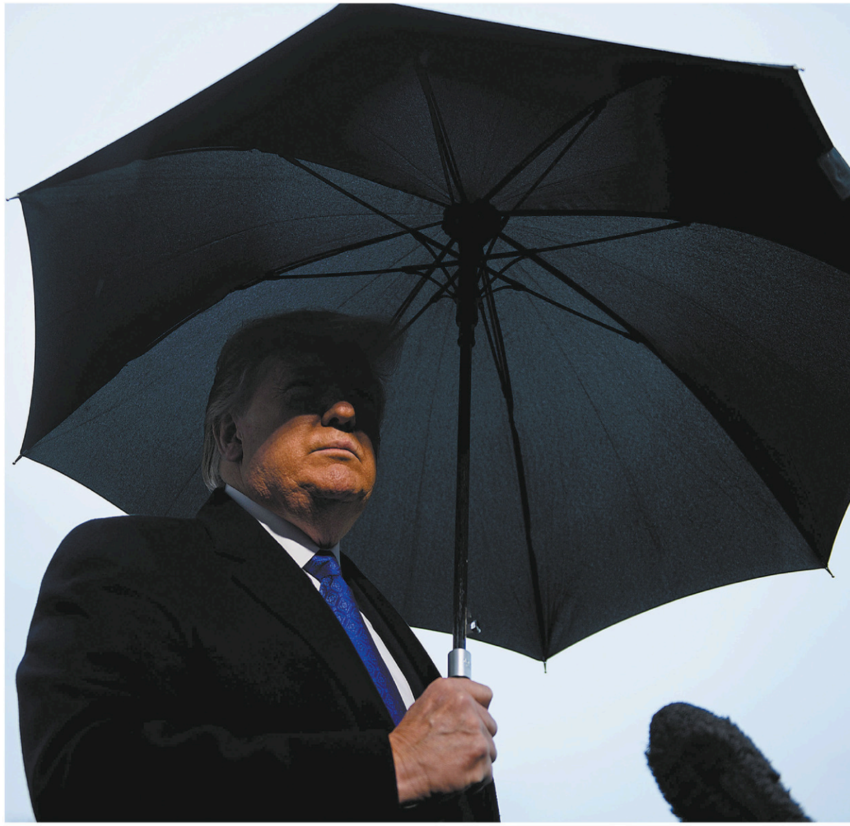
Donald Trump a discuté lundi avec des journalistes avant de s'envoler pour le sommet de l'OTAN, à Londres.

Le président ukrainien a de nouveau nié tout accord de « donnant-donnant » sur cette aide militaire, dans un entretien publié lundi par plusieurs titres internationaux. « Je n'ai pas du tout parlé au président américain Trump en ces termes : "je te donne ceci, tu me donnes cela" », a déclaré Volodymyr Zelensky.