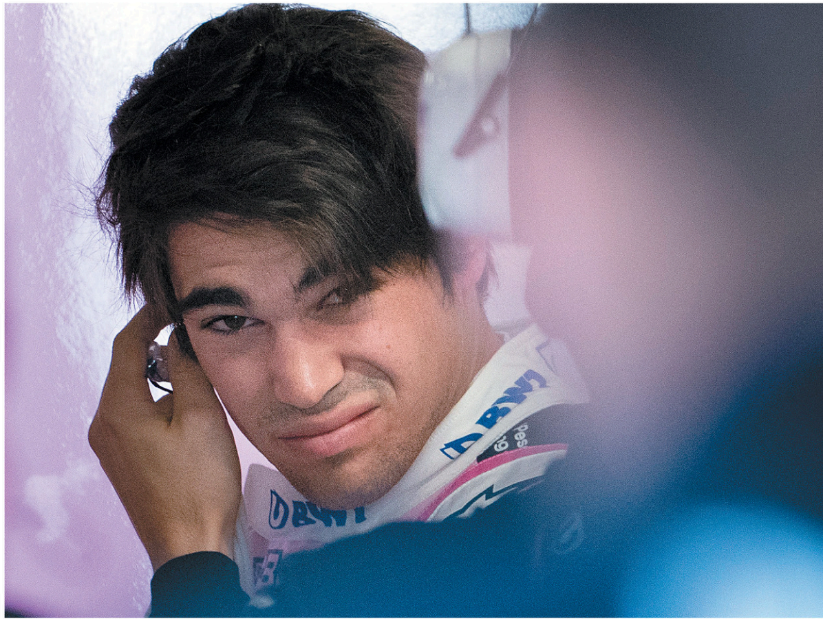
Lance Stroll a terminé l'année au 15 e rang, avec une maigre récolte de 21 points.

PARIS — Un nouveau sacre historique, synonyme de record absolu : l'Argentin Lionel Messi a remporté le sixième Ballon d'or de sa riche carrière, lundi lors d'une cérémonie à Paris, où l'Américaine Megan Rapinoe a décroché la plus prestigieuse distinction individuelle dans le football chez les dames. Avec ce 6 e titre de meilleur joueur de la planète (2009, 2010, 2011, 2012, 2015, 2019), Messi est désormais seul au monde devant son éternel rival Cristiano Ronaldo (5 Ballons d'or) et d'autres légendes comme Johan Cruyff, Michel Platini, Marco Van Basten (3 Ballons d'or). « Il ne faut jamais cesser de rêver, jamais cesser de travailler », s'est félicité Messi, se sentant « béni ». « Je pense que j'ai encore de belles années devant moi même si la retraite approche. Je suis content aussi d'écrire l'histoire, l'histoire de mon club que j'aime tant », le FC Barcelone. Rapinoe, devenue une icône de l'opposition au président américain Donald Trump, succède à la Norvégienne Ada Hegerberg, qui avait reçu le premier Ballon d'or féminin de l'histoire en 2018. Agence France-Presse