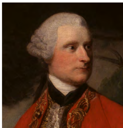
Le gouverneur James Murray