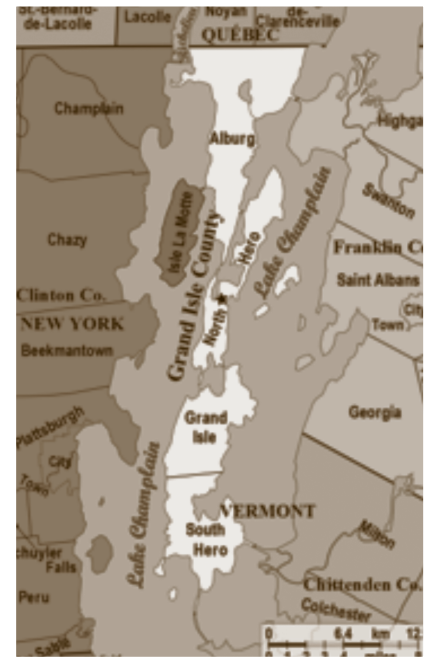
La Grosse Ile dans le lac Champlain, actuellement Grand Isle et South Hero.