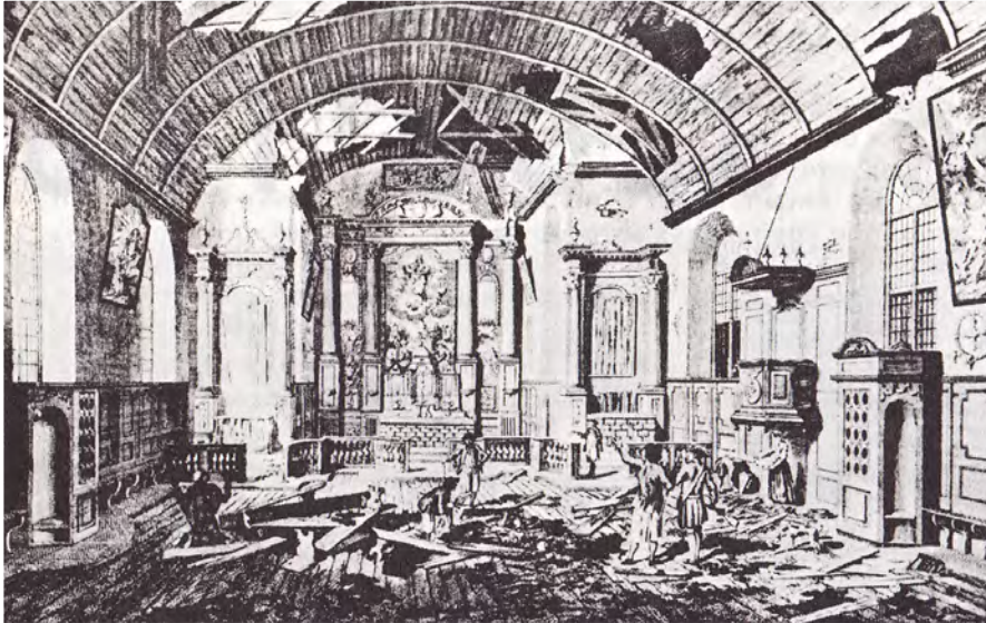
Intérieur de l'église des Récollets