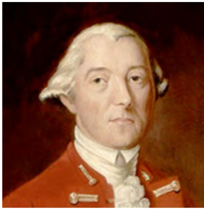
Le gouverneur Guy Carleton

Préoccupé par les concessions prévues pour les colons britanniques dans l'Acte de Québec qui devait entrer en vigueur le 1 er mai 1775, Carleton modifia le système judiciaire prévu par les autorités de la métropole. Afin d'imposer la tenue de procès