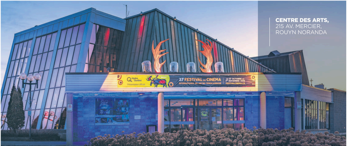
CENTRE DES ARTS, 215 AV. MERCIER, ROUYN NORANDA