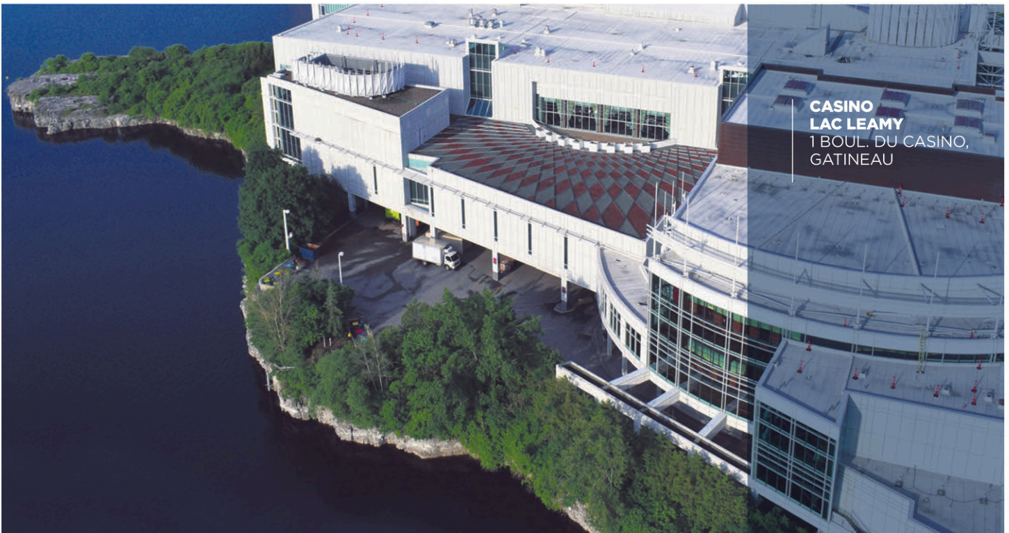
CASINO LAC LEAMY 1 BOUL. DU CASINO, GATINEAU