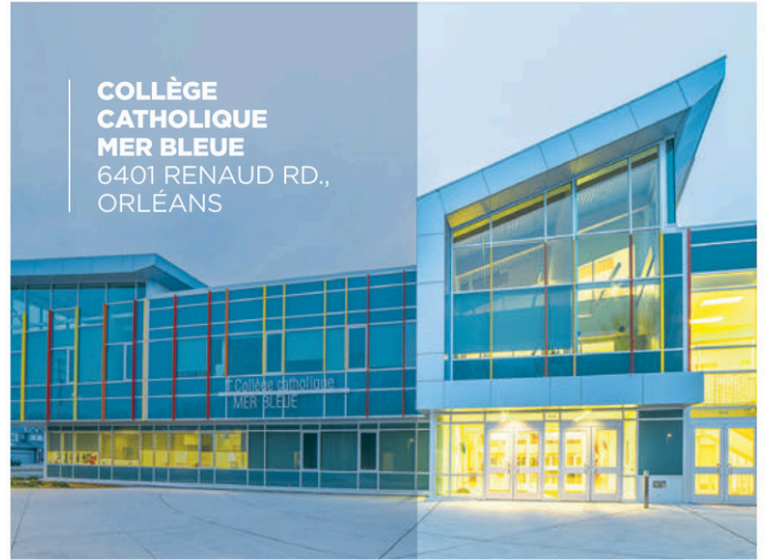
COLLÈGE CATHOLIQUE MER BLEUE 6401 RENAUD RD., ORLÉANS