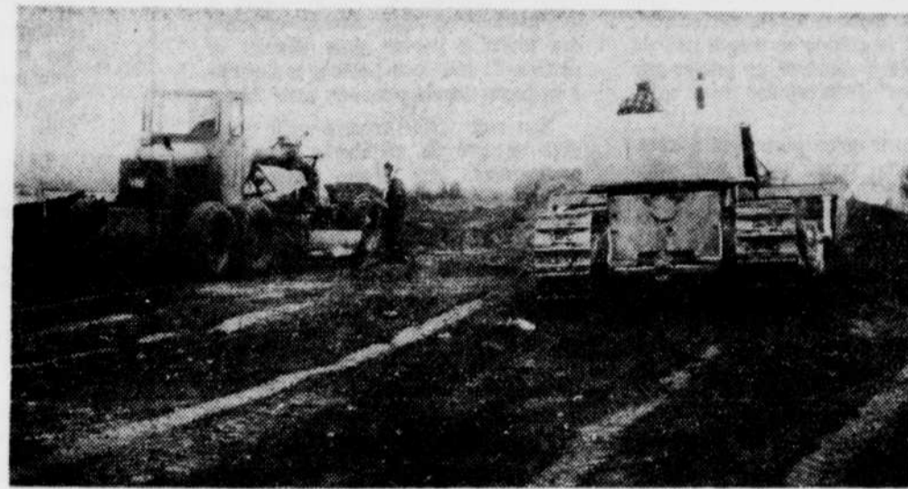
On pouvait voir cinq niveleuses sur la rue Merry nord hier matin. Bosco Construction fait maintenant les choses en grande pour que la construction de cette route soit terminée le plus tôt possible.