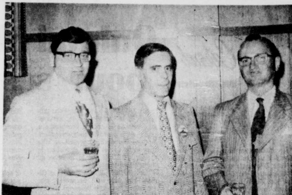
AVANT LE 30 OCTOBRE... les candidats font face à une grande tension.