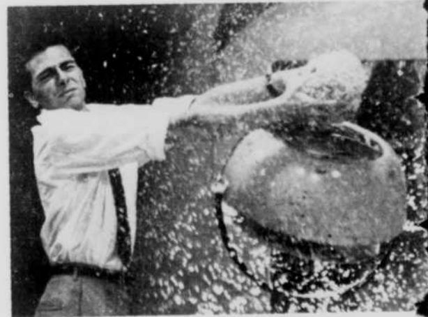
Il y aura tempête au Chenal du Moine... Reportage vous montrera qu'avec des brindilles de nylon... et de l'expérience, on peut, en toute saison, créer la plus effrayable des poudreries.

La nuit, aux alentours de l'aéroport de Dorval. On roule sur un chemin isolé, tortueux, glacé. Enfin, une barrière, avec un policier. Une autre barrière et un grand hangar, tout neuf, le plus grand hangar d'aviation du monde. Devant, un appareil DC-8, le premier que possède la société Air-Canada. Personne autour: seul un vent glacé soulève un peu de neige. Quatre grands disques rouges obstruent les ouvertures des quatre turbo-réacteurs Rolls-Royce. Insolite semble cet avion isolé. Insolite d'autant plus apparaît la réunion qui se tient à l'intérieur de ce fuselage de 150 pieds 5 pouces, boutonné par ses hublots. Il y a foule. D'abord une équipe d'Air-Canada à l'entraînement au sol: pilote, mécanicien, navigateur,