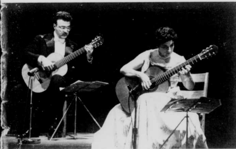
ALEXANDRE LAGOYA et IDA PRESTI, le fameux duo de guitaristes que les téléspectateurs ont pu apprécier à l'Heure du concert, en décembre 1958.