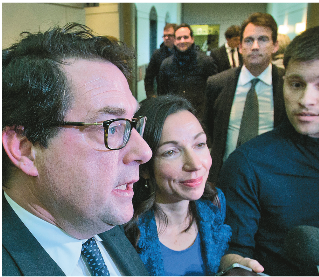
Les cinq candidats se sont dits satisfaits de l'entente intervenue jeudi au sujet des débats.