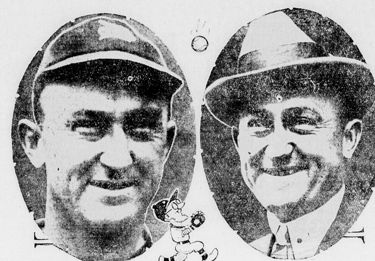
TY COBB, le fameux joueur de balle, le héros de plus d'un magnifique combat et la plus brillante étoile du sport national américain. Le vétéran est en train de surpasser le record établi il y a longtemps par Cap. Anson.