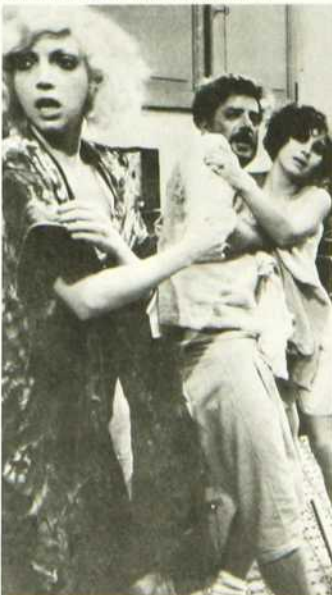
Un film d'amour et d'anarchie

Ce film est une critique acerbe des grandes idéologies politiques par son comique truculent, et sa compassion pour les petites gens le rend très attachant. On dit que les cinéphiles qui connaissent bien le cinéma italien reconnaîtront les influences de De Sica, de Zurlini, de Fellini et même de Sergio Leone dans l'oeuvre de ce jeune cinéaste.