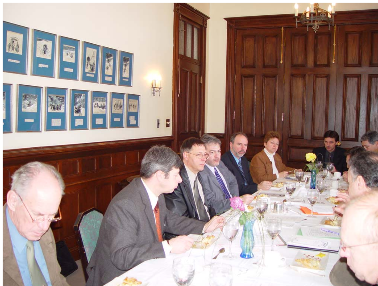
Commission Gestion des ressources informationnelles II

Ministère des Services gouvernementaux – SAGIR