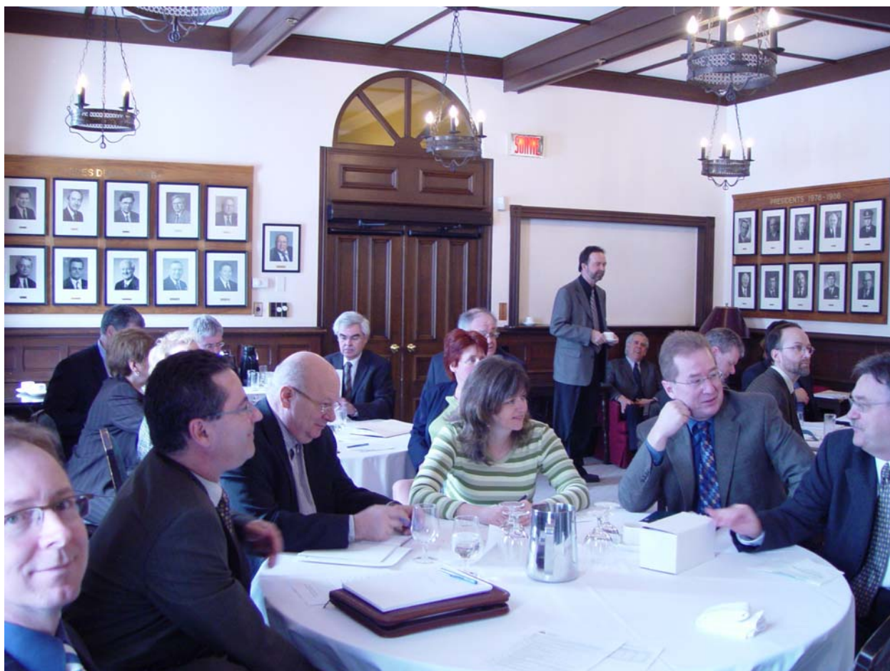
Membres en assemblée