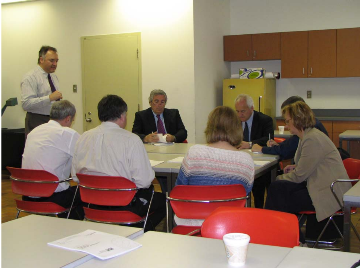
Formation des membres, session de Montréal