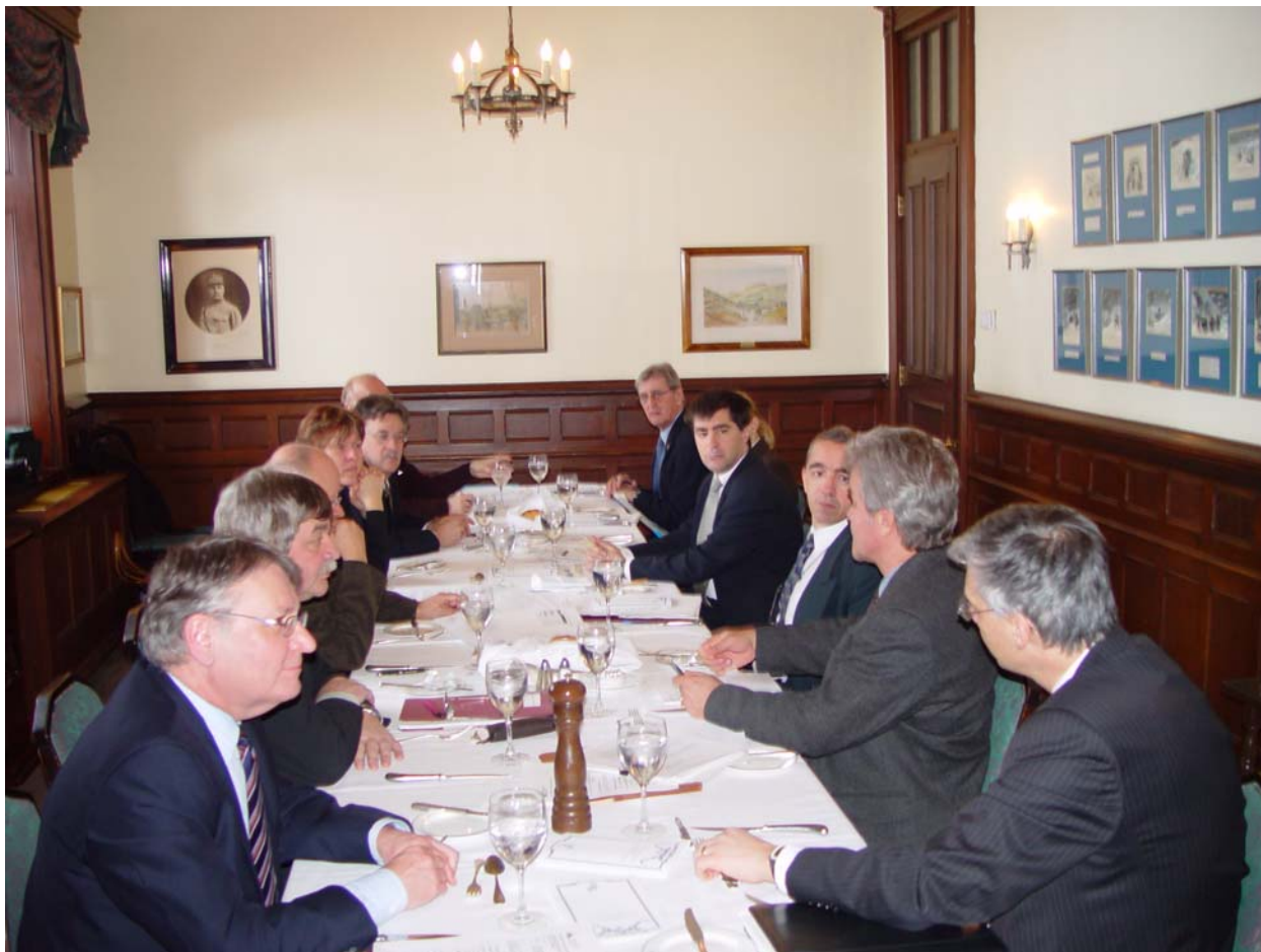
Commission Gestion des ressources humaines en TI