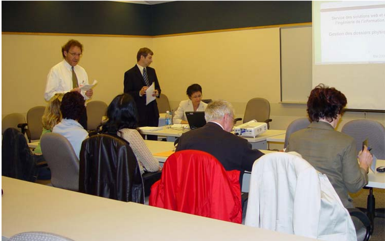
Comité sur la gestion intégrée des documents