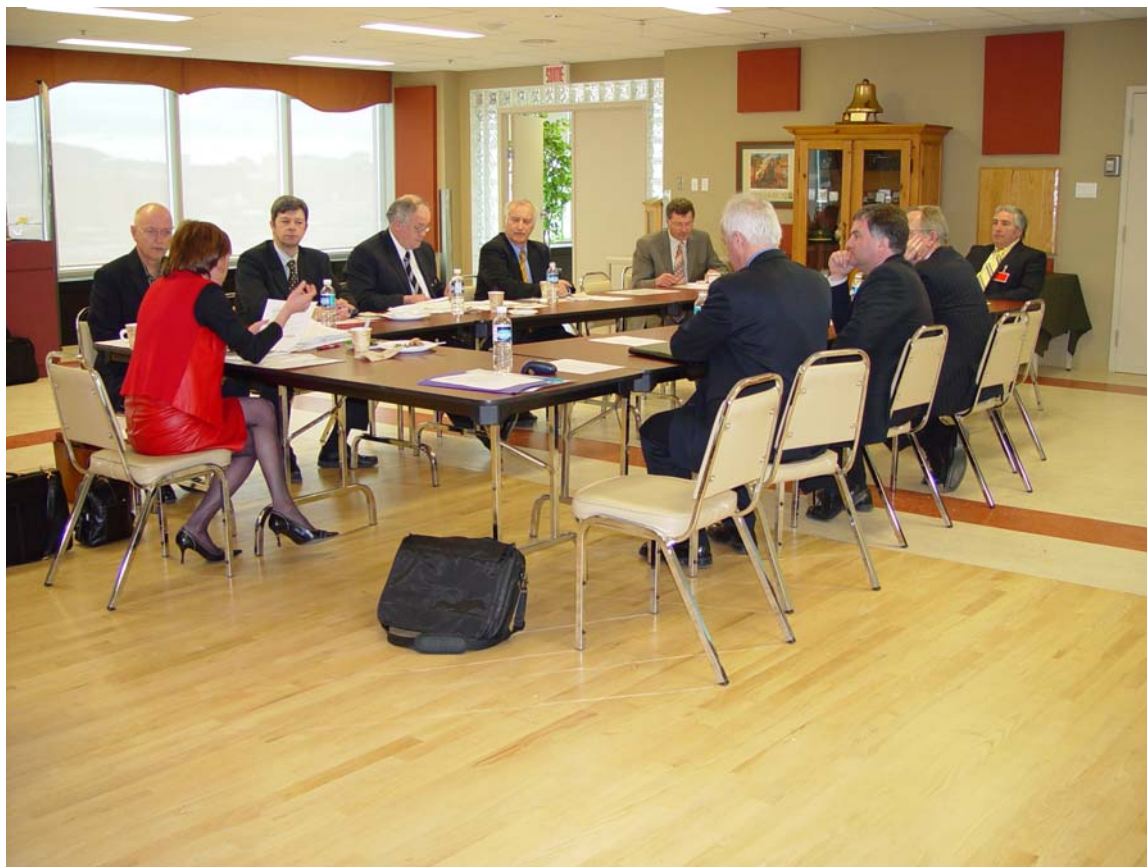
Rencontre avec les membres de Montréal

La seconde a permis aux membres de Montréal ainsi qu'aux membres du Comité exécutif de discuter de la gouvernance des TI et d'avoir une présentation des services d'identification d'identité en place à la Sûreté du Québec .