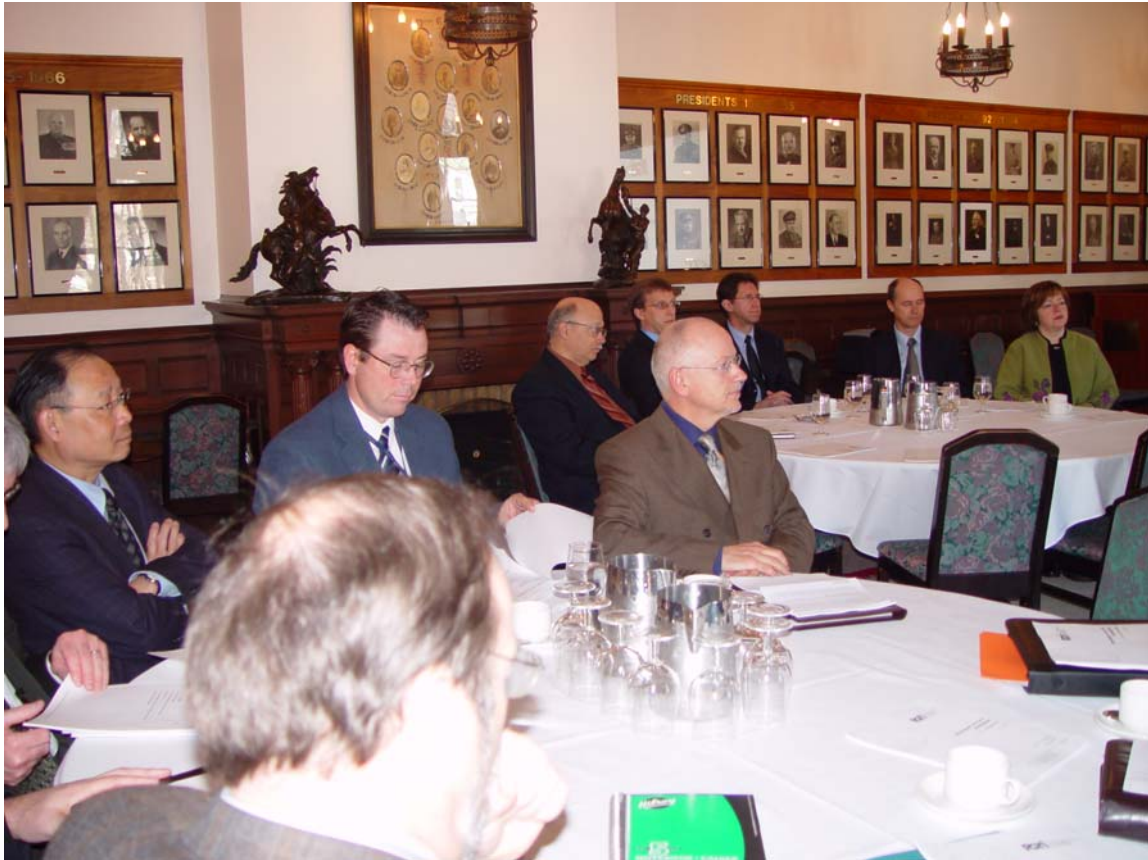
Formation des membres, session de Québec

De plus, 4 sessions dispensées par un expert externe, ont permis à près de 80 gestionnaires de bénéficier d'une formation sur le thème de « développer son sens stratégique ». Ce thème est une suite à la session de l'année passée sur le sens politique. Les participants ont pu expérimenter concrètement des façons de faire, apprendre des stratégies d'intervention et développer une pensée axée sur les tactiques à adopter pour mieux intervenir de façon efficace au sein de leur organisation. Les commentaires des participants ont été très positifs.