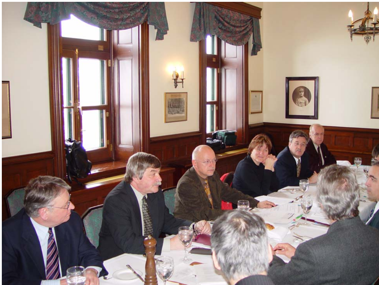
Commission Gestion ressources humaines en TI

Ministère de la Culture et des Communications