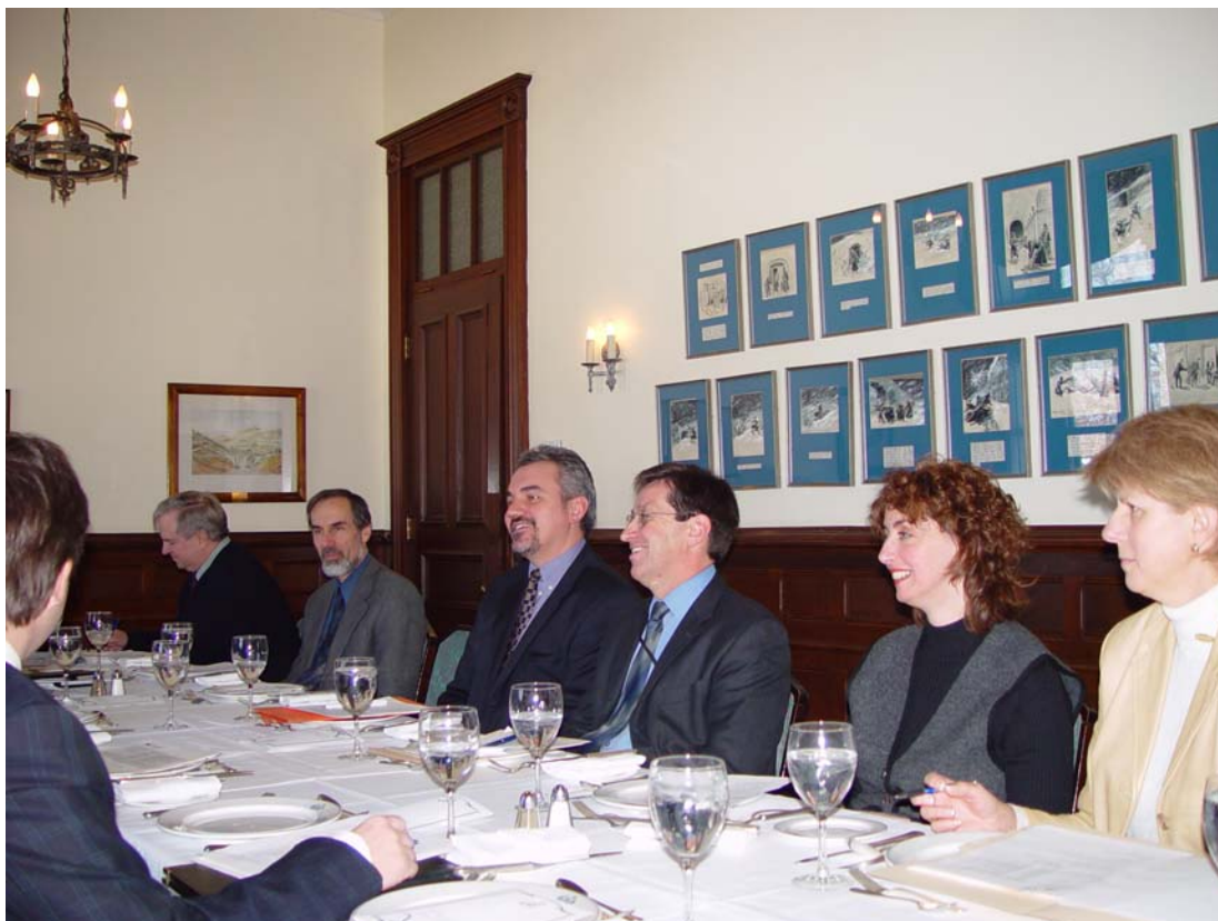
Commission Gestion ressources informationnelles I

Un représentant des membres a été désigné et les travaux ont débuté en mars 2006.