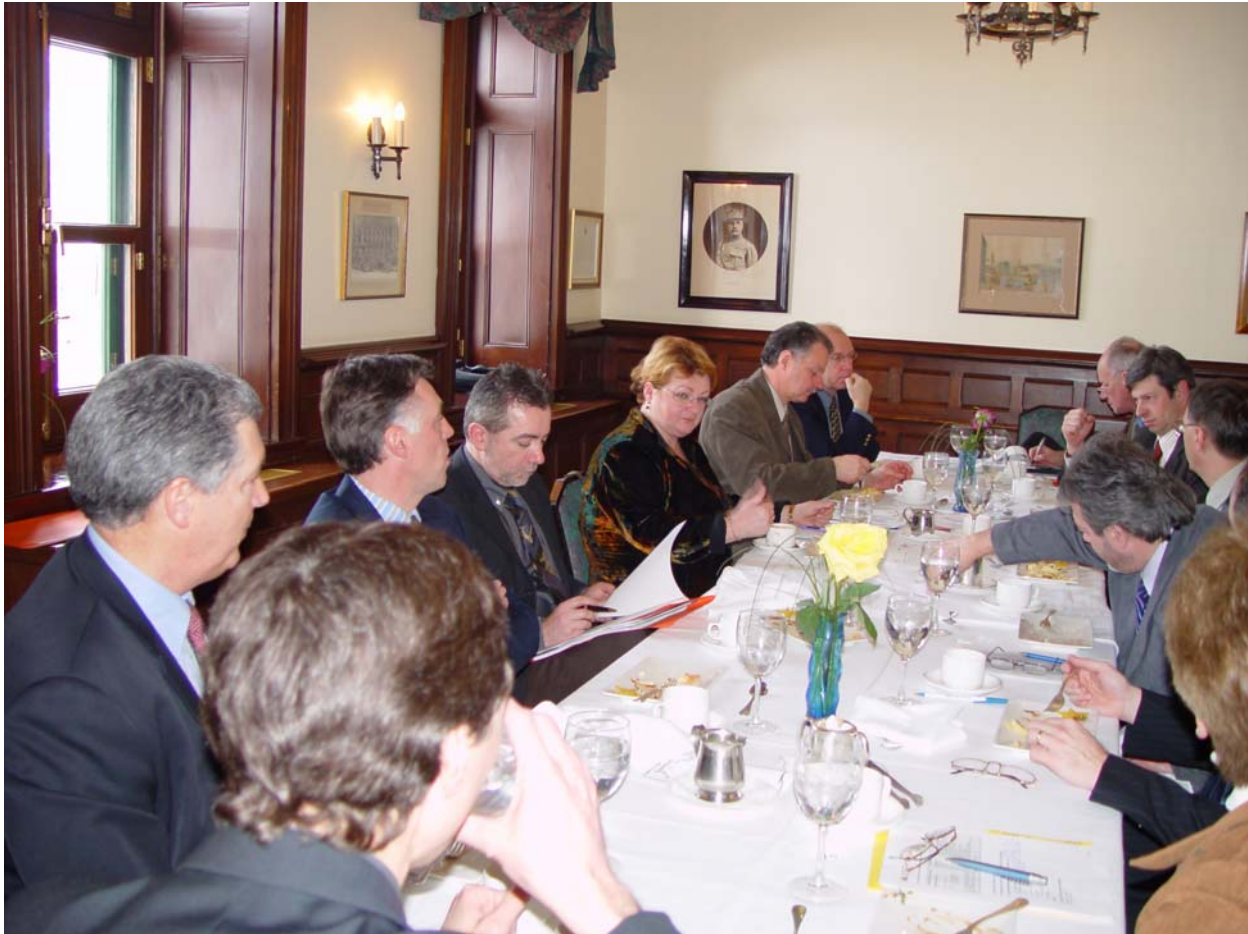
Commission Gestion de ressources informationnelles II