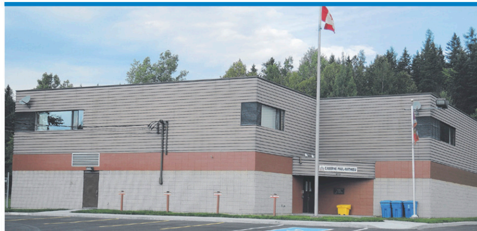
L'événement aura lieu le 3 juin au manège militaire de Beauceville.