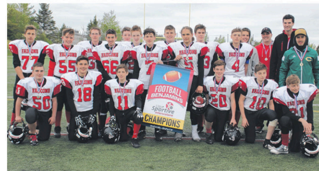
Les Faucons 1 de la polyvalente Saint-François de Beauceville sont les champions de la Ligue printanière de football benjamin.

Dans les autres matches présentés lors du jamboree, les Faucons 1 avaient disposé de l'École Bon-Pasteur 18-0 et des Cyclones de l'École des Appalaches de Sainte-Justine 21-0 alors que les Faucons 2 avaient pris la mesure de l'école secondaire Saint-Charles 18-6 et de l'École secondaire Veilleux 29-8. Les Patriotes de la polyvalente Bélanger de Saint-Martin ont eux aussi remporté deux victoires de 21-0 sur les Cyclones et de 21-0 sur l'École Bon-Pasteur. Enfin, l'École secondaire Veilleux et l'École secondaire Saint-Charles ont fait match nul 8-8. (S.B.)