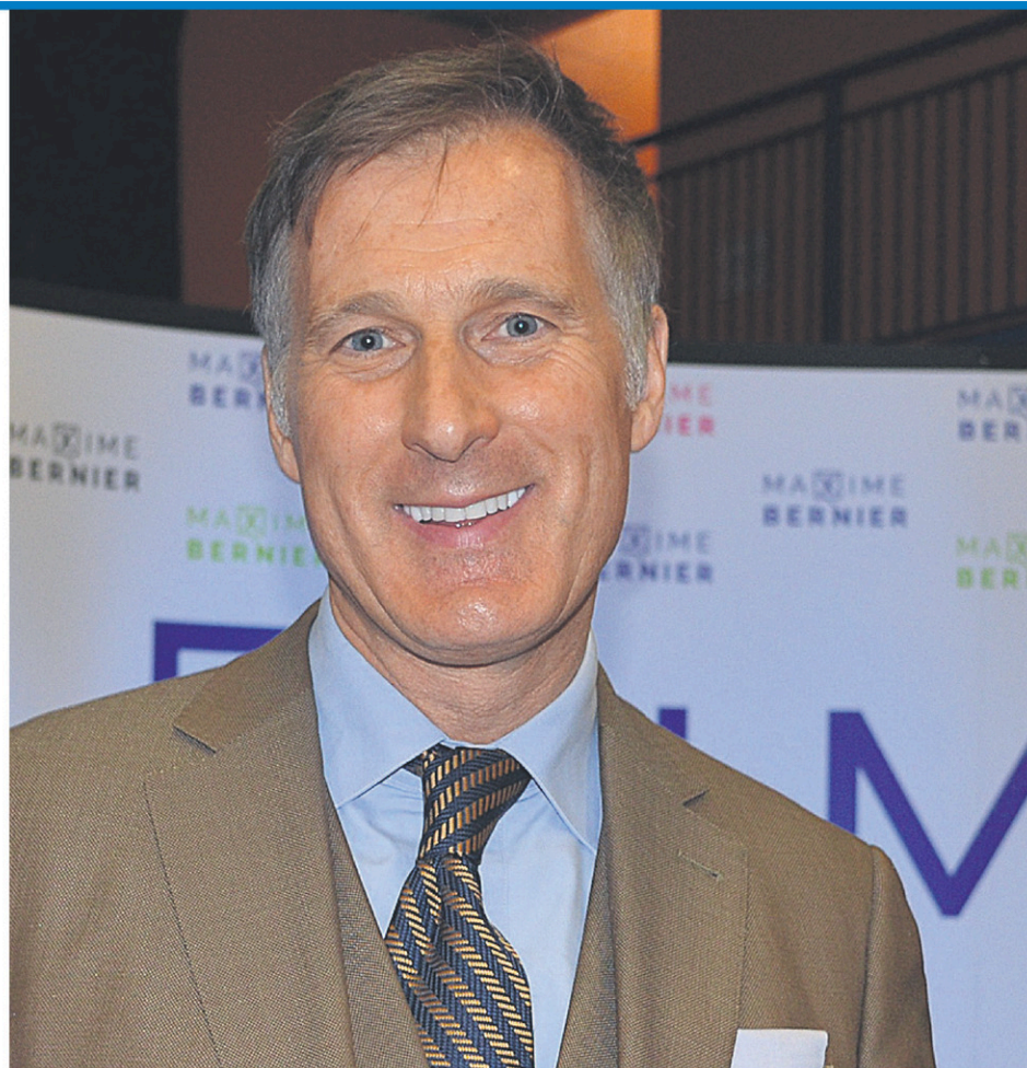
Maxime Bernier confirme qu'il sera candidat en 2019.

Maxime Bernier dit ne pas regretter s'être engagé dans un débat de principe. « Les gens ont apprécié un politicien qui prend