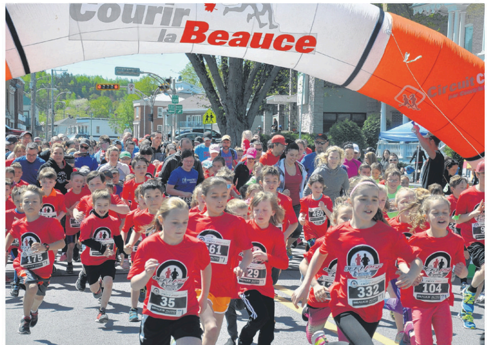
Les jeunes enthousiastes ont pris le départ du 2 kilomètre.

d'amasser 25 000 $, et nous avons déjà 14 000 $ d'amassés. Les jeunes travaillent fort », ajoute M. Loubier.