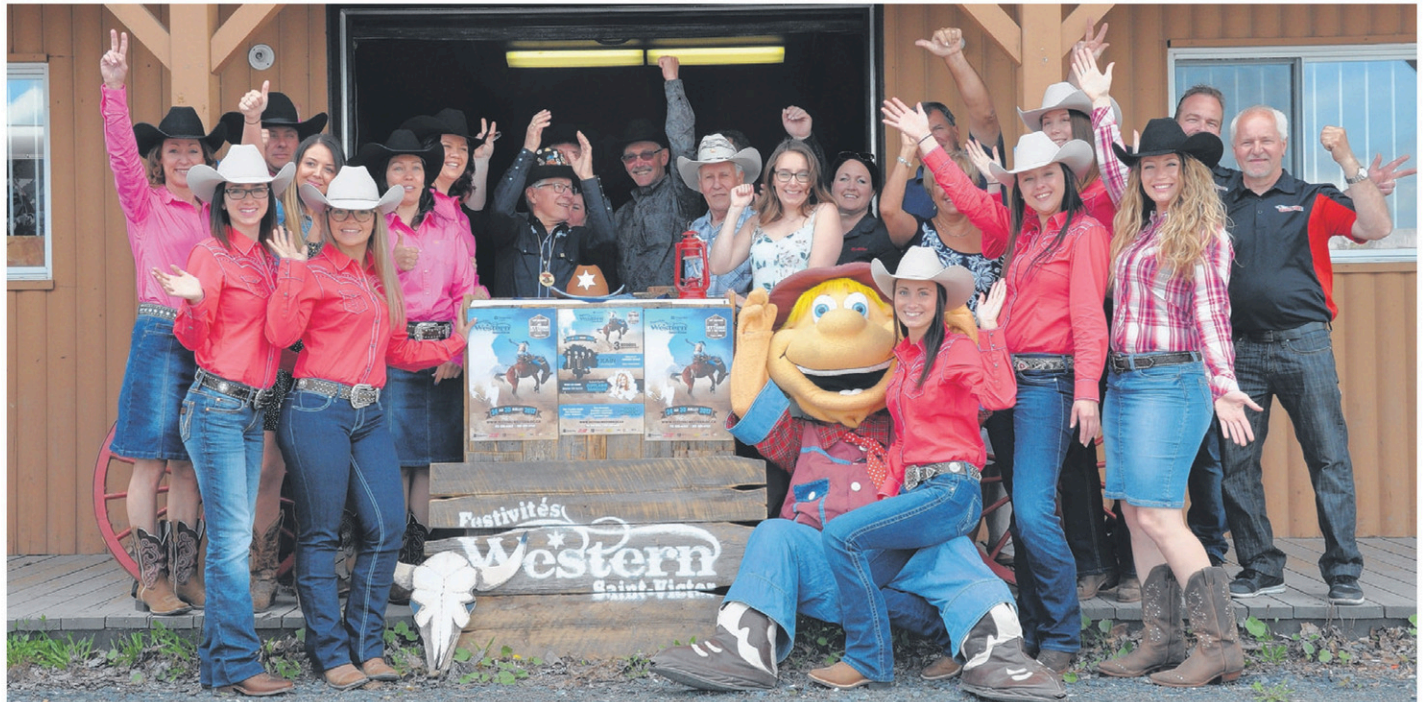
Le comité organisateur, les duchesses et les partenaires des Festivités Western de Saint-Victor.

Après plusieurs années, les populaires courses de chuck-wagon et les courses de chevaux de selle seront de retour. Celles qui avaient auparavant lieu à l'extérieur du ring avaient été annulées lors de la