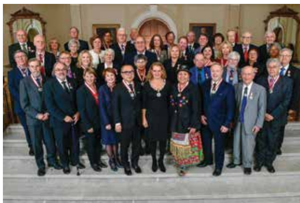
Toutes nos félicitations à L'honorable Louis LeBel, juge retraité de la Cour suprême du Canada et juge en résidence de la Faculté de droit de l'Université Laval, qui s'est vu remettre l'Ordre du Canada par Son Excellence la très honorable Julie Payette, gouverneure générale du Canada, le 20 novembre dernier.

L'horaire de la cérémonie, la liste des récipiendaires, leurs citations ainsi qu'une fiche d'information sur l'Ordre du Canada sont joints au présent avis aux médias.