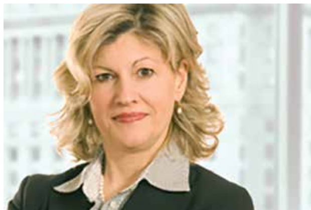
Honorable Jocelyne Gagné

L'honorable Jocelyne Gagné a été nommée à la Cour fédérale le 31 mai 2012. Depuis sa nomination, elle a acquis auprès de ses pairs une réputation de juriste respectée et réfléchie, qui travaille fort et valorise la collaboration. La juge Gagné est parfaitement bilingue et elle entend régulièrement des causes dans les deux langues officielles. En plus de son travail à la Cour fédérale, elle a également été nommée à la Cour d'appel de la cour martiale du Canada en mars 2013 ainsi qu'au Tribunal de la concurrence en février 2017.