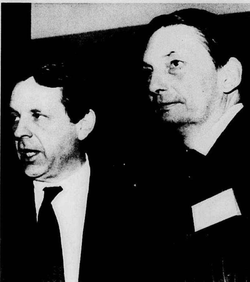
Les secrétaires d'État aux Transports Sam Skinner des États-Unis, et Paul Shannon, de Grande-Bretagne, réunis à Montréal, hier.

Il suggère entre autres de renforcer la vérification des bagages avant de les monter à bord d'un avion et de les transférer d'un appareil à un autre. Il faudrait également voir selon lui si certains