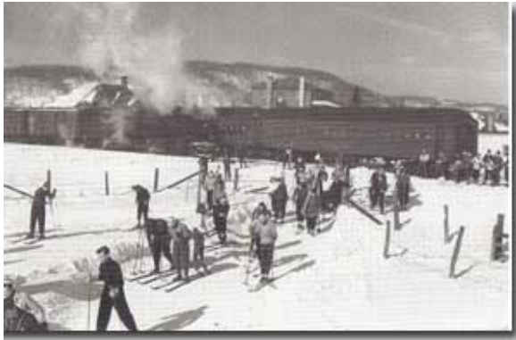
Train de ski à Saint-Sauveur (CN), vers 1939.

Les voyages de noces et les virées familiales étaient populaires aux chutes du Niagara et dans le Maine, mais la plupart des voyages de vacances se limitaient au Bas-Saint-Laurent et à la Gaspésie, aux villages côtiers de Charlevoix et, pour les gens de la région de Montréal, aux Laurentides et aux Cantons-de-l'Est.