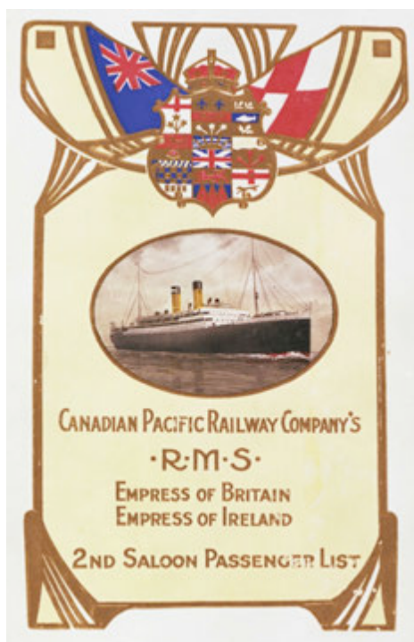
Affiche promotionnelle

Pour celles et ceux curieux d'en savoir plus, la Société d'histoire et de généalogie du Plateau-Mont-Royal a mis en ligne un mini-reportage sur le voyage de noces d'Édouard et Clémentine sur leur site Internet dans la nouvelle section Exposition virtuelle 4 .