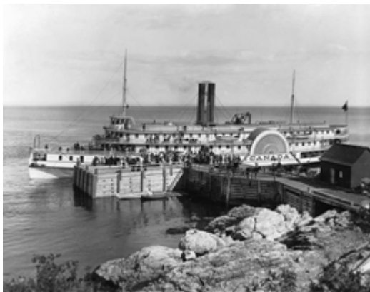
Cap-à-l'Aigle, La Malbaie Photographie du S.S. Canada, Cap-à-l'Aigle, La Malbaie, Qc, vers 1895.

Pendant des dizaines d'années, les croisières sur le fleuve en bateau à vapeur furent très populaires tout comme les excursions en chemin de fer, un moyen de transport qui a stimulé le développement de l'industrie touristique dans les Laurentides.