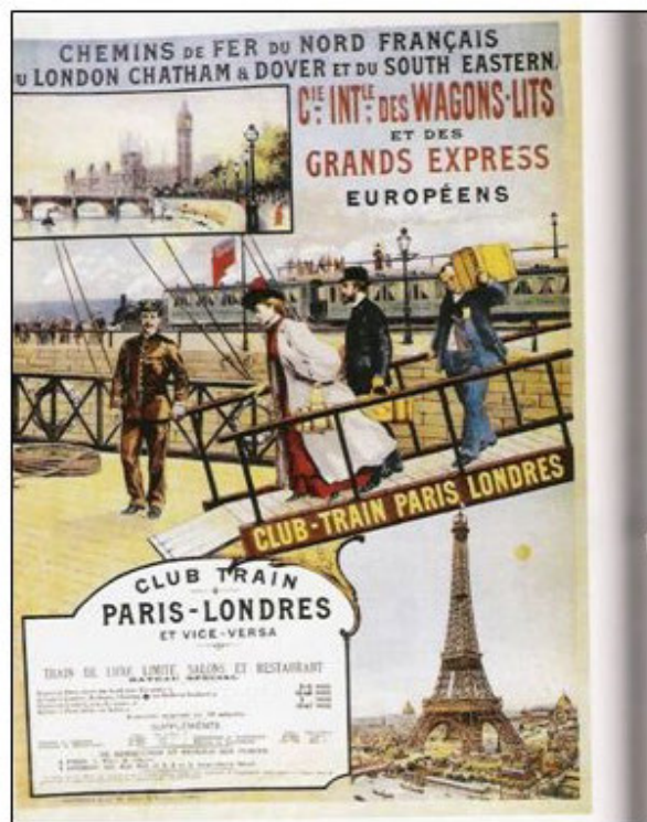
Source : Chemins de fer du Nord français Club train Paris-Londres et vice-versa..., lithographie, 1895, Gallica/BnF

Ces voyageurs qui nous ont précédés ont à leur tour inspiré les plus jeunes à découvrir le monde. L'avion a décloisonné les frontières, l'autostop a mis sur les routes des milliers de jeunes dans les années 1970 et 1980. Le tourisme moderne est multiforme et de plus en plus accessible.