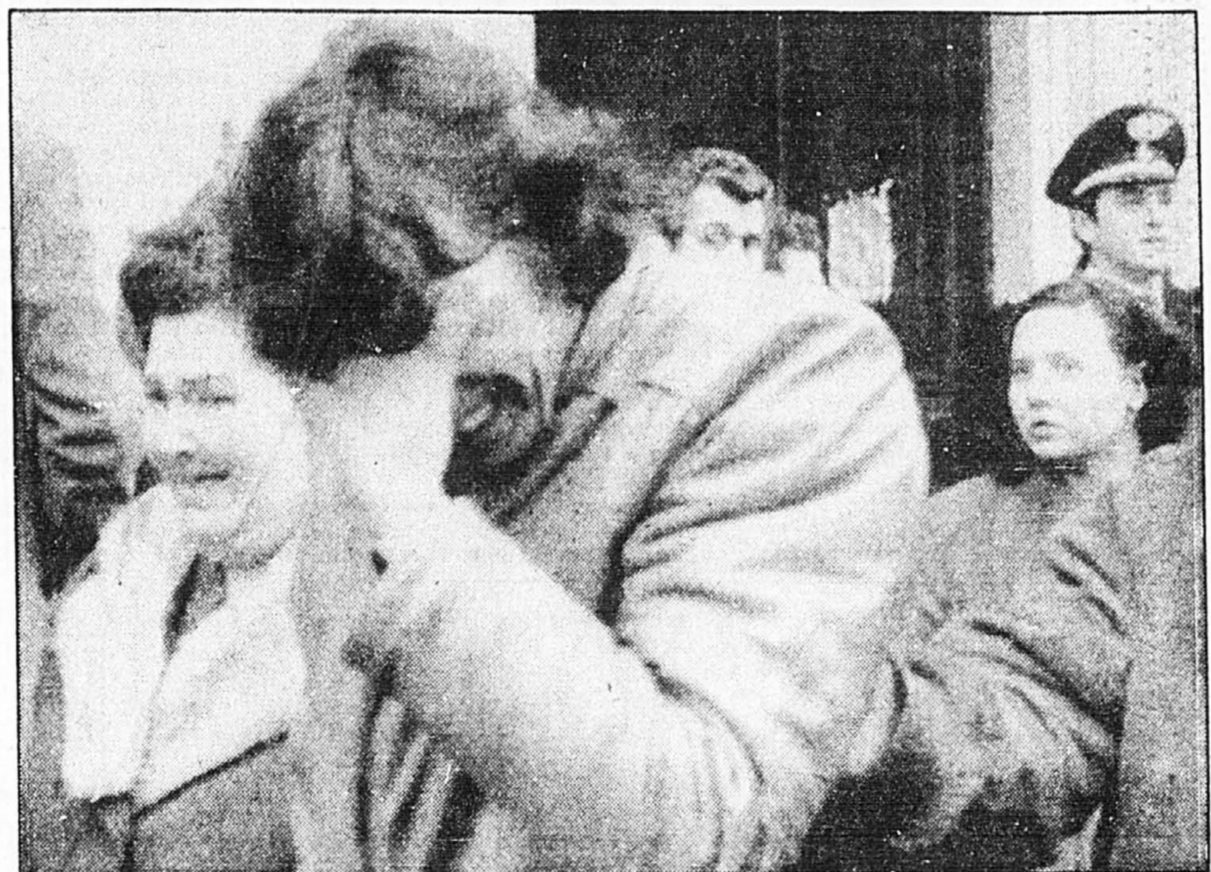
Un homme et une femme en pleurs sortent de la morgue de Turin après avoir identifié un parent mort dans l'incendie du cinéma

La plupart des victimes étaient des jeunes appartenant à des familles d'immigrés venues du sud de l'Italie. Treize familles entières ont péri dans le désastre.