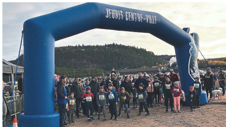
Il y avait beaucoup de monde sur la ligne de départ, comme en fait foi cette photo des participants du tracé de 2 km.

De nombreux bénévoles ont contribué à la bonne marche de cette activité, appelée à revenir l'an prochain. « On se donne rendez-vous en 2022 », se promet un des responsables, Sébastien Moisan.