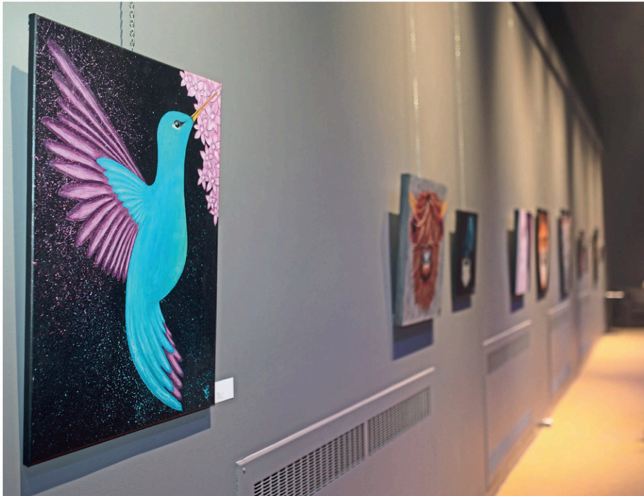
L'exposition sera présentée jusqu'au 12 décembre.

On peut voir l'exposition pendant les heures d'ouvertures de la billetterie, soit du mercredi au vendredi, de 12 h à 17 h, ainsi que lors des activités prévues au Complexe culturel.