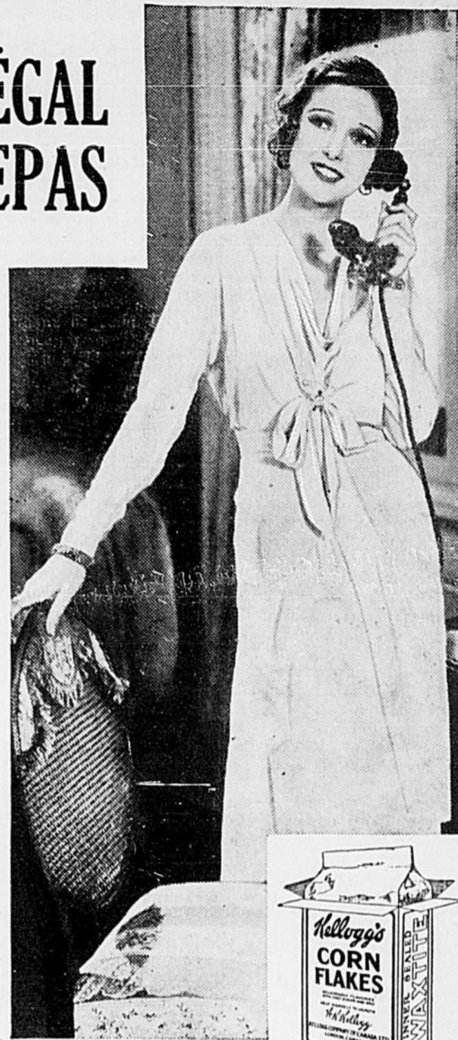
LORETTA YOUNG — First National Pictures

Vous en avez pour plusieurs fois dans une seule boîte qui ne coûte que quelques sous seulement. Toujours frais comme au sortir du four dans le sac intérieur breveté WAXTITE "fermée à la cire." Quoi d'étonnant que les Flocons de Maïs de Kellogg sont la céréale prête à manger la plus populaire! En vente chez tous les épiciers. Préparés par Kellogg à London, Ontario. "Qualité garantie."