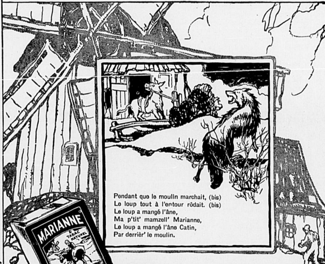
Pendant que le moulin marchait, (bis) Le loup tout à l'entour rôdait. (bis) Le loup a mangé l'âne, Ma p'tit' mamzell' Marianne, Le loup a mangé l'âne Catin, Par derrière' le moulin.