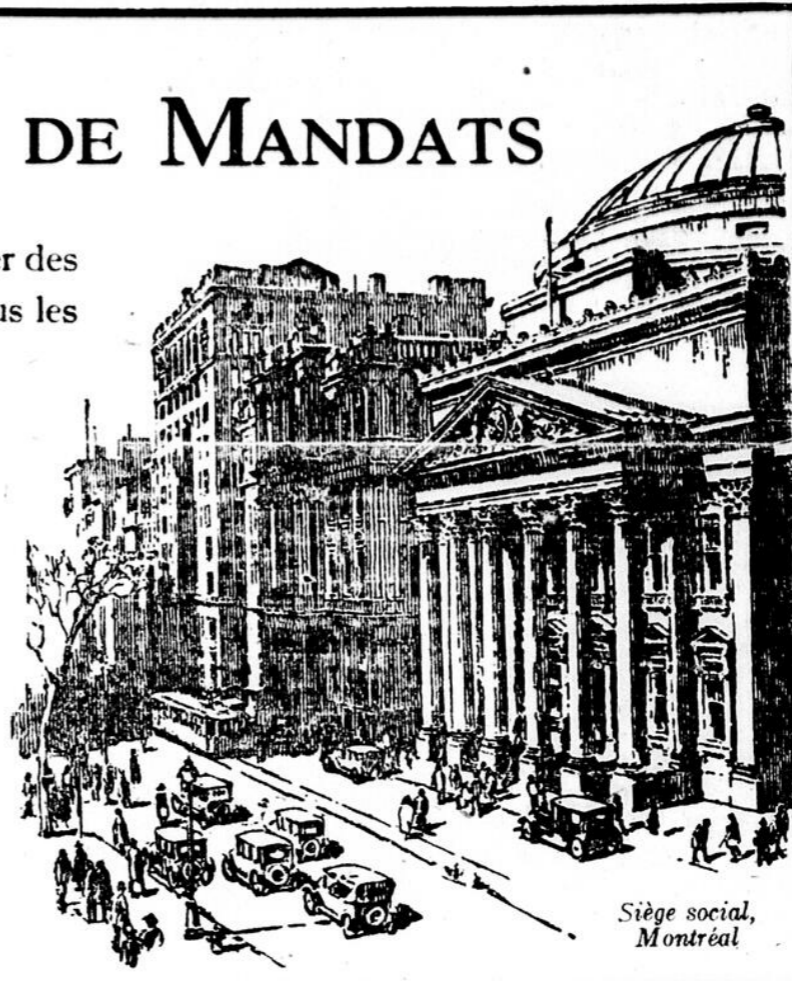
Siège social, Montréal