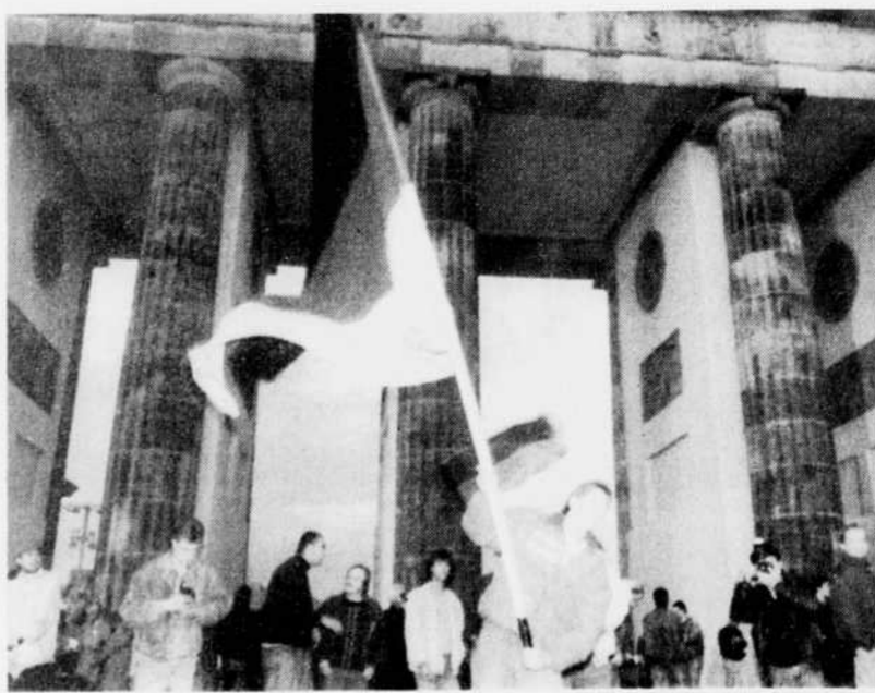
Manifestation de joie, mardi dernier, lors de la réunification officielle de l'Allemagne

Diane Ross Service Budgétaire Populaire Sherbrooke