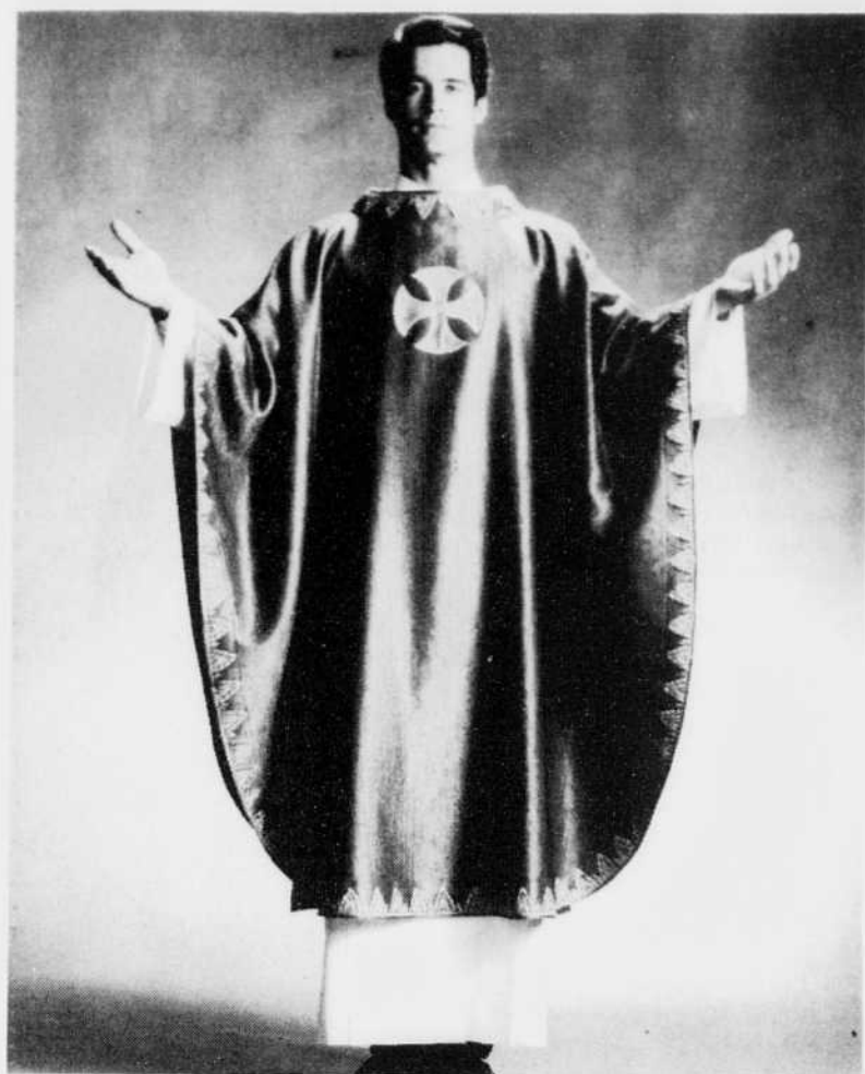
Une chasuble signée Michel Robichaud: une texture riche, avec des galons et des bordures assortis à l'étoffe.