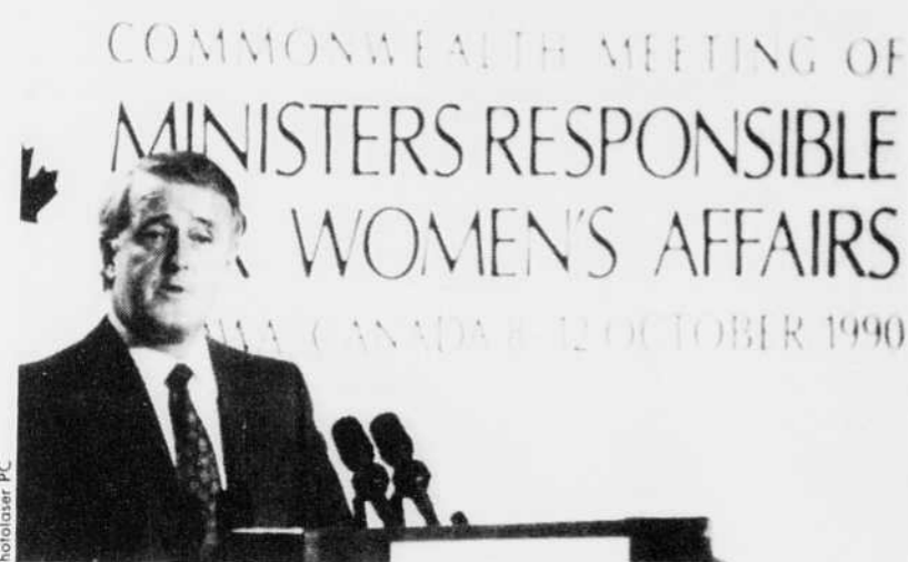
À l'ouverture de la conférence des ministres du Commonwealth responsables de la situation de la femme, le premier ministre Brian Mulroney a livré un discours chaudement applaudi.