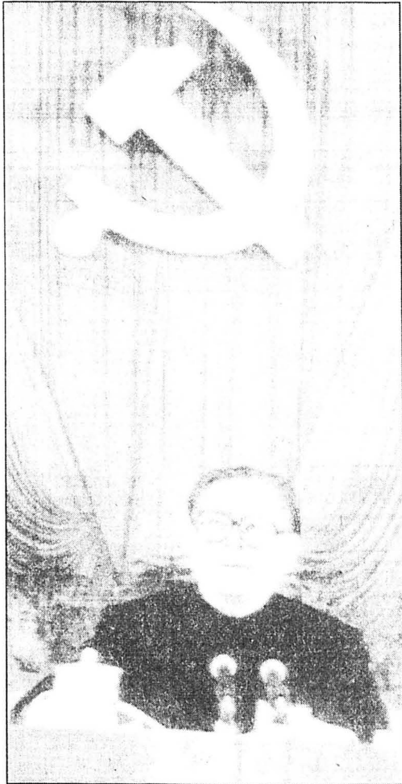
Le secrétaire général du PCC, Djiang Zemin, prenant la parole hier à l'issue de six jours de réunion du Comité central du PCC.

Par ailleurs, 24 «contre-révolutionnaires» et 428 criminels, dont 242 «séparatistes» ont été arrêtés cette année au Tibet et les autorités de cette région himalayenne sous administration