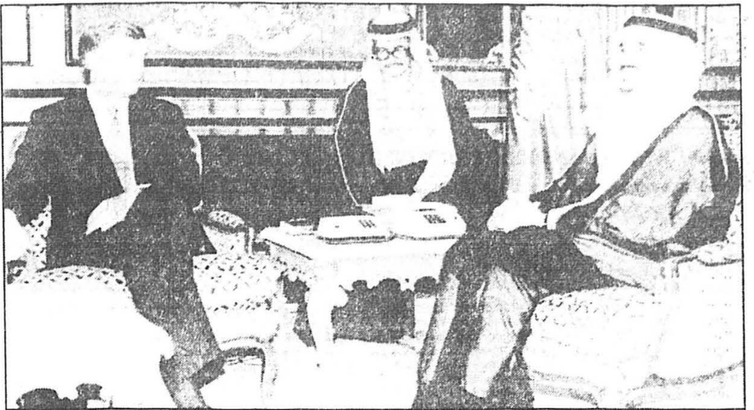
Le vice-président américain Dan Quayle a été reçu hier par le roi Fahd à son palais de Riyad.

Aucun chiffre n'a été donné concernant le supplément d'aide consenti par l'Arabie saoudite. Ryad a déjà donné neuf milliards de dollars en argent et en fournitures à l'armée américaine, et 3,9 milliards de dollars à d'autres pays contribuant à l'effort international contre l'Irak, dont la Turquie et l'Égypte.