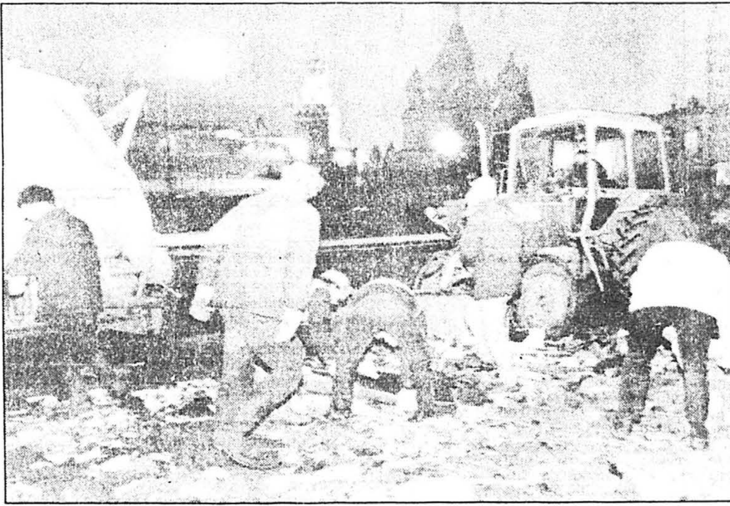
Des ouvriers déblaient ce qui reste du village de tentes.

Les habitants du camp ont été avertis samedi de l'opération, conduite sur ordre du procureur de Moscou en application d'une