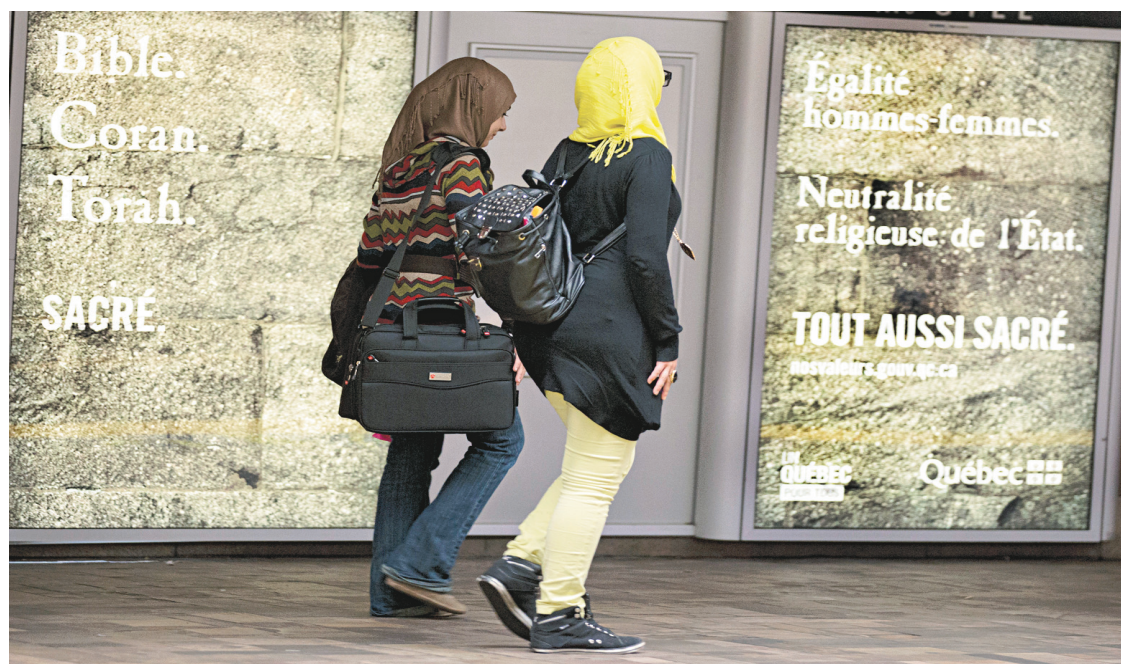
La Charte de la laïcité a fait couler beaucoup d'encre en 2013.

4. La guerre des chartes, québécoises et canadiennes , illustre bien que les constitutions et les chartes ont été écrites par les juristes et les politiciens pour s'assurer que le peuple ne fait pas obstacle aux libertés individuelles, à la propriété privée, aux minorités, au libre-échange et au multiculturalisme dont ont besoin les riches. Les juges veillent au grain pour mettre un frein aux droits du peuple de protéger son territoire, son histoire, sa culture et son mode de vie. L'argent est et doit rester apatride et sans frontière. L'État de droit est désormais celui qui assure le droit des riches, non celui du peuple.