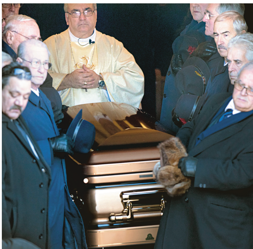
La dépouille de Vito Rizzuto a été transportée à l'extérieur de l'église Notre-Dame-de-la-Défense au terme d'une cérémonie d'une heure célébrée par Iginio Incantalupo.

Plusieurs experts s'entendent pour dire qu'il est difficile de prédire qui prendra la relève de