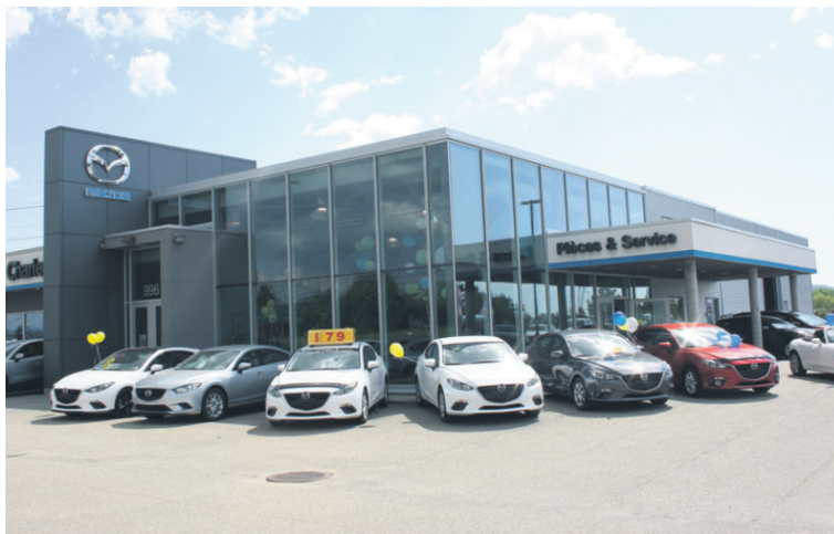
La nouvelle image de Charlevoix Mazda