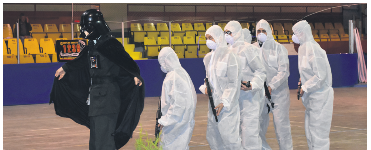
En plus des traditionnels pelotons de précision, les spectateurs ont eu droit à plusieurs numéros de variétés.