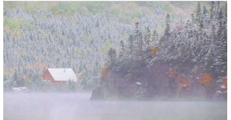
La photo de Thierry Martin, gagnant du premier prix du concours de photo de la zec du Lac-au-Sable en 2015.

Comme à chaque année, on retrouvera l'activité pêche en herbe pour les jeunes de 6 à 17 ans et la pêche sera