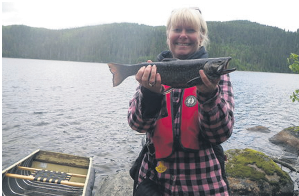
Une belle prise au lac Gagy!

S'y rendre : Prendre la route 138 à Baie-Saint-Paul et la route 381 en direction de Saint-Urbain. Le poste d'accueil de la zec des Martres est situé au kilomètre 27.