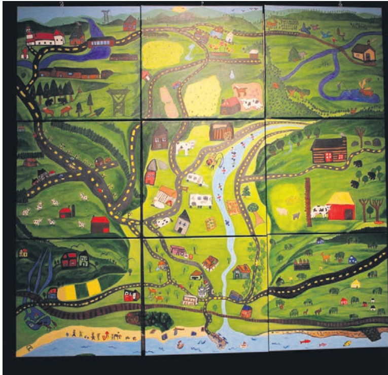
La création collective

La motivation des jeunes a permis d'aller encore plus loin et de réaliser la murale dévoilée la semaine dernière. L'artiste Natacha Audet, en collaboration avec Mme Huard et les enseignantes, a chapeauté la création de l'imposante œuvre collective (54 pouces par 60 pouces). Les 44 élèves des 2 classes ont été répartis en 9 équipes, une équipe pour chaque unité de paysage. « Le projet a été très enrichissant pour nos élèves. Ils ont pu découvrir, caractériser et mieux apprécier ce qui les entoure », ont commenté les enseignantes. L'œuvre est présentée au public au Carrefour culturel jusqu'au 5 juin et trouvera ensuite sa position permanente