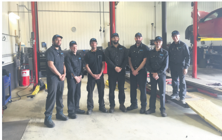
Des employés au cœur de la réussite