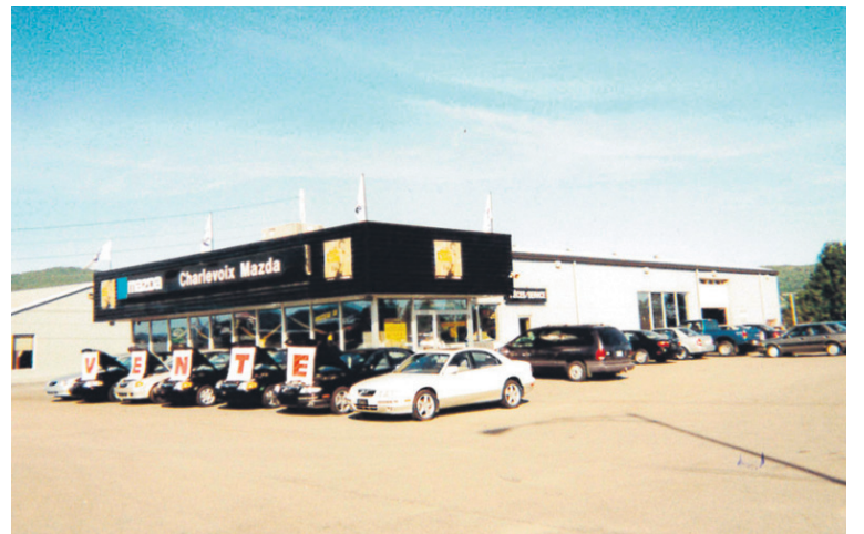
Charlevoix Mazda, au tournant du siècle dernier...