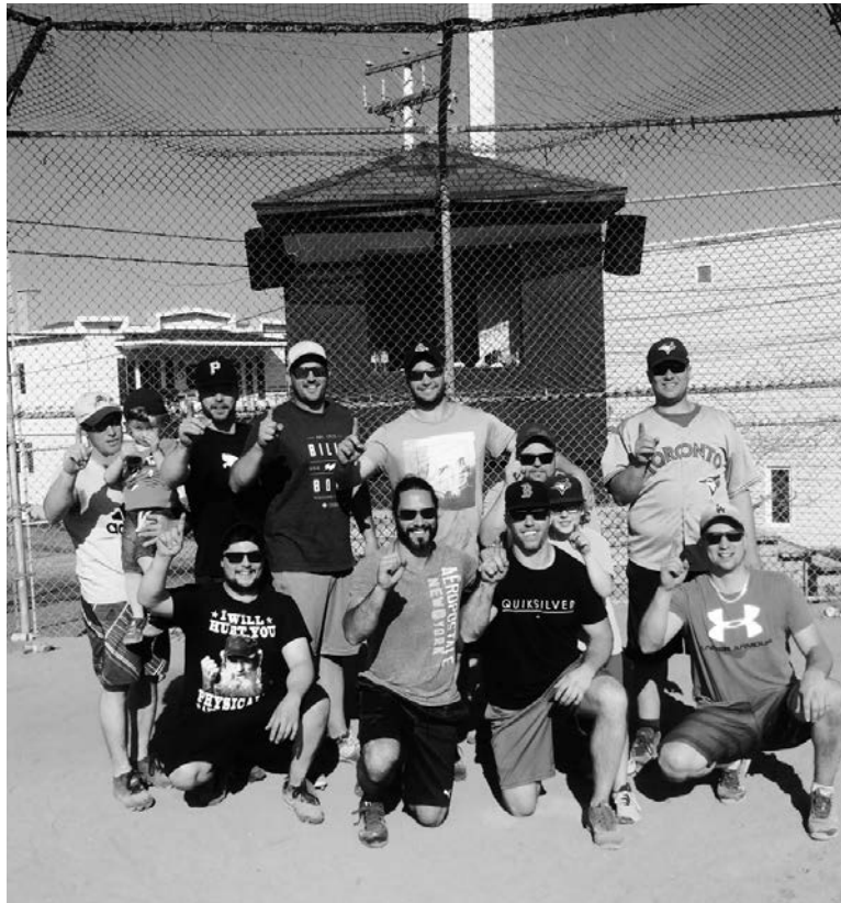
L'équipe championne de la classe A, Les Copains.

L'équipe des organisateurs remercie tous les commanditaires impliqués dans le tournoi et particulièrement la Ville de Clermont.