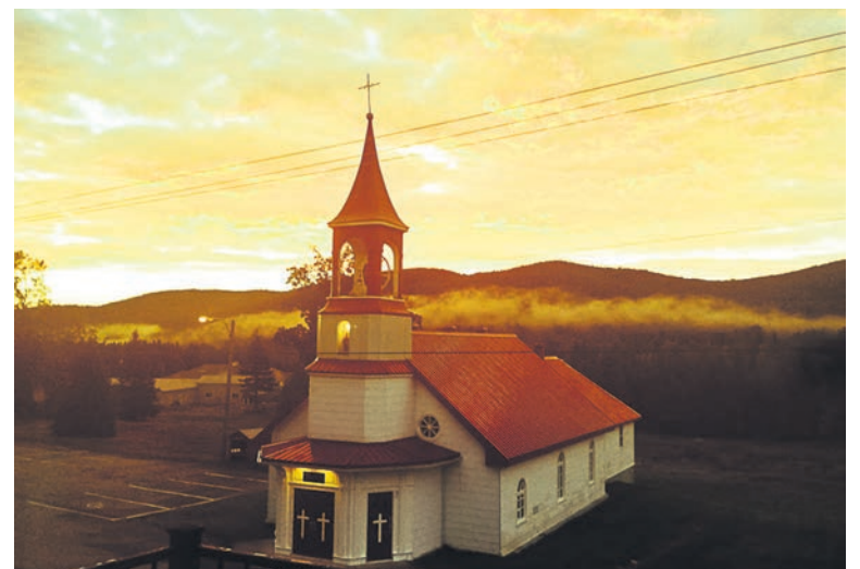
L'église de Saint-Placide

Le Comité lance un appel à tous, que ce soit pour participer aux activités, donner un coup de main, donner des objets pour la vente de