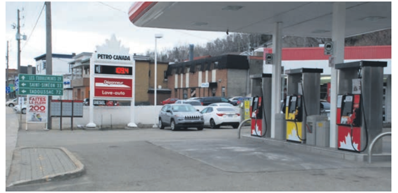
De superbes esquisses du projet qui remplacera le commerce actuel ont été présentées à l'hôtel de ville devant les membres du comité d'urbanisme.