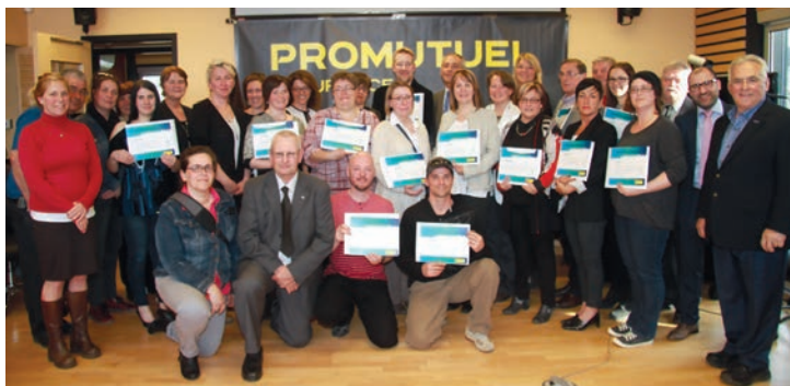
17 organismes de Charlevoix, de la Côte-de-Beaupré, de l'Île d'Orléans et de Beauport ont reçu des bourses totalisant 58 700$.

Promutuel Assurance du Lac au Fleuve a remis 125 700$ à 39 organismes communautaires et coopératives de son territoire pour la réalisation de projets!