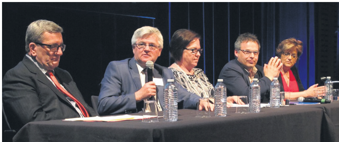
Les élus qui ont participé à la table ronde politique.