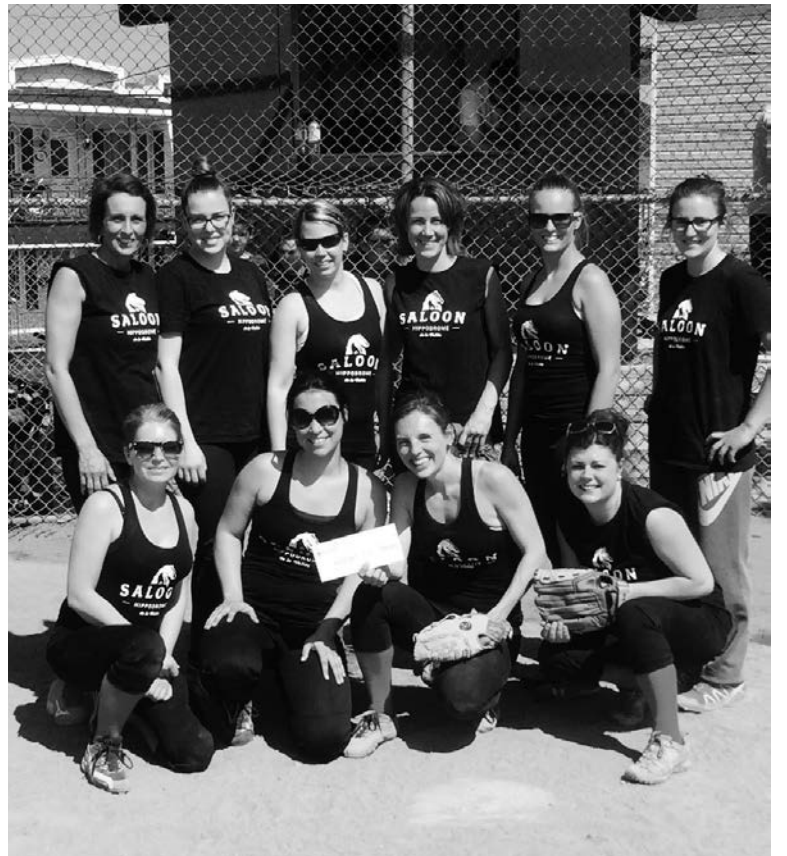
L'équipe du bar Le Saloon a remporté la palme chez les femmes.