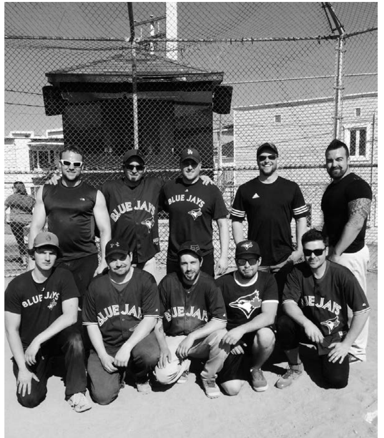
Les gagnants de la catégorie consolation, les Blue Jays.