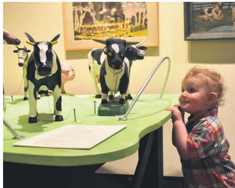
56 œuvres d'art populaire représentant des vaches sont exposées sur différentes tables.

présentée au Musée québécois de l'agriculture, au Musée de La Pocatière et par la suite, elle va être exposée dans différents musées au Québec, énonce Mme Breton. C'est la première fois qu'on crée une exposition pour qu'elle devienne itinérante », ajoute-t-elle, en précisant que cette caractéristique a son lot de problématiques. « Au niveau des textes, il fallait faire