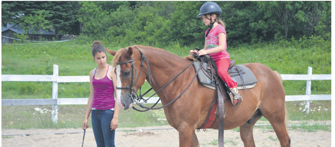
Le Centre du Cheval enchanteur accueille les garçons et les filles de 6 ans et demi à 15 ans.

Le Centre du Cheval enchanteur, reconnu pour ses services de rééducation destinés aux jeunes qui ont certaines difficultés d'apprentissage ou de développement