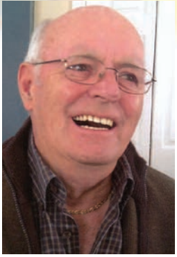
M. André Brassard 1937 - 2016