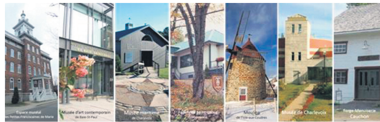
Les sept institutions qui s'allient pour vous inviter sur le Circuit des 7 lieux.

au https://www.facebook.com/circuit7lieux/ .