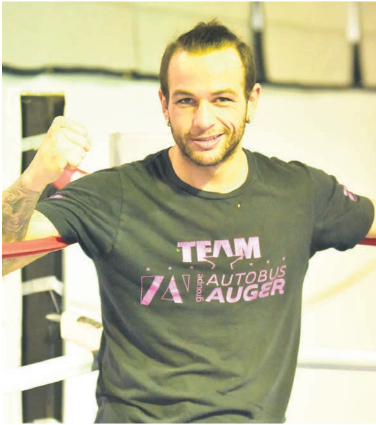
Sébastien a hâte d'en découdre avec le Belge. Un boxeur qui, tout comme lui, aime combattre près de son adversaire.

Le boxeur originaire de Baie-Saint-Paul, 11 victoires et 1 défaite chez les professionnels, n'a pas encore eu le temps de bien assoir sa tactique, mais il a hâte d'en découdre. « J'ai juste eu le temps de voir un petit extrait de ses combats et, à première vue, on voit que c'est un grand gars qui boxe assez à l'intérieur. On devrait avoir du plaisir à boxer contre lui, parce que j'aime ça boxer rapproché. J'ai bien hâte à ce combat-là », a-t-il mentionné lors d'une entrevue téléphonique dimanche dernier.