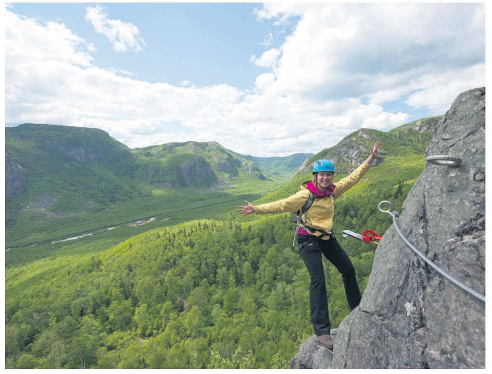
Les parcs nationaux ont enregistré 160 000 jours-visite en 2015.