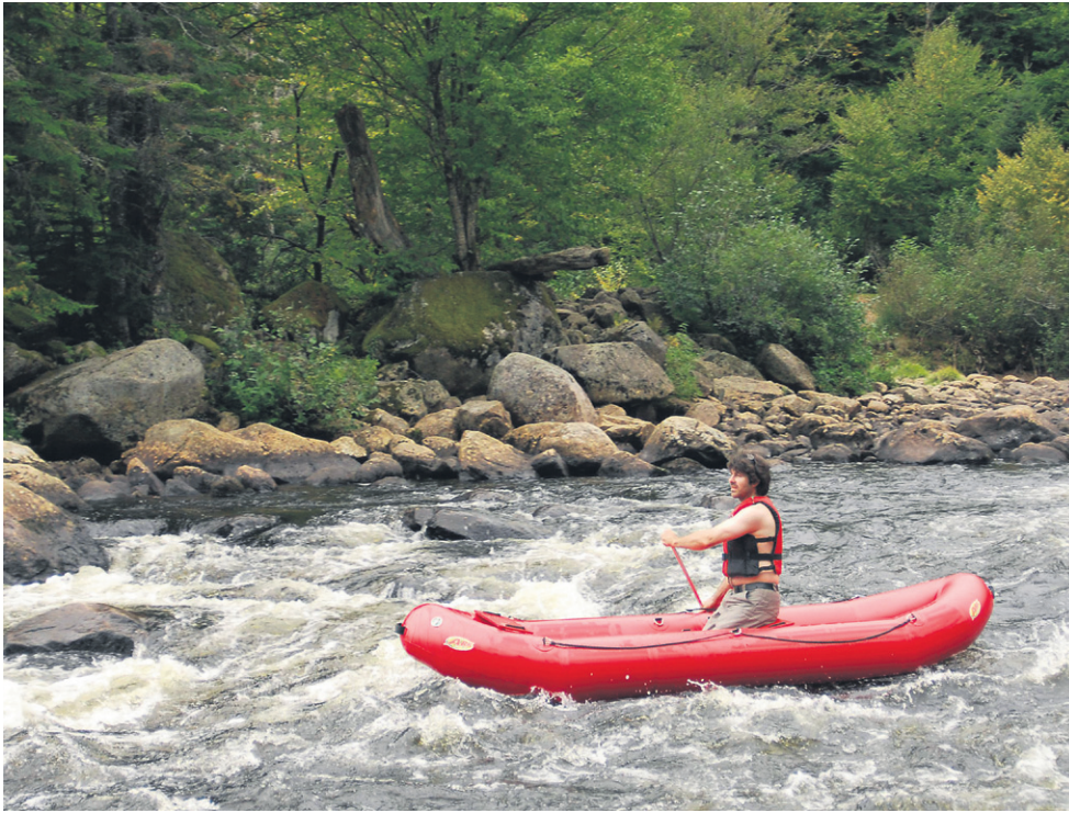
Le canot pneumatique est introduit dans les Hautes-Gorges.