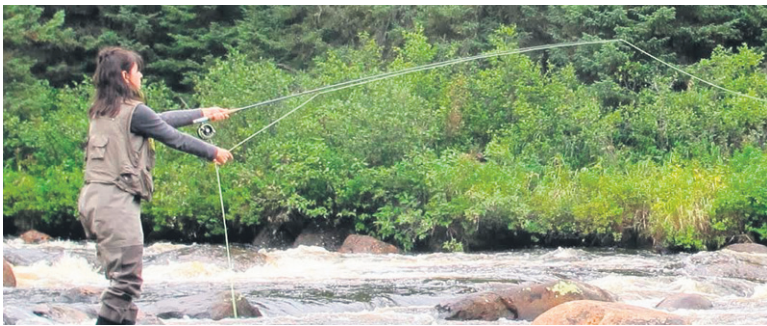
Les pêcheurs au saumon saisonniers devront désormais s'enregistrer à l'accueil lors de chaque journée de pêche.

Gouffre. C'est juste pour savoir le nombre de pêcheurs qu'il va y avoir sur la rivière cette journée-là. C'est une mesure demandée par le ministère pour avoir plus de précision au niveau des jours de pêche pendant la saison. On avait un problème avec ça. Les pêcheurs saisonniers, ceux qui ont leur droit de pêche pour l'été, s'enregistraient au début de la saison et après cela, ils donnaient une approximation des jours pêchés pendant la saison, mais ce n'était pas assez précis », explique M. Girard, en ajoutant qu'on pourra se procurer la carte d'enregistrement électronique aux mêmes endroits que le permis de pêche au saumon.