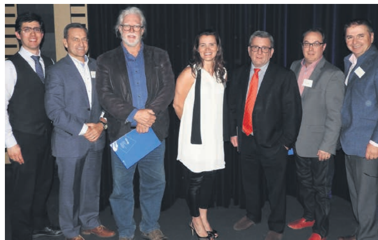
Les élus qui ont participé à la table ronde politique.