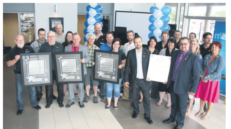
Une entreprise qui multiplie les honneurs comme en fait foi avec fierté cette superbe équipe. Charlevoix Mazda, une affaire de famille.