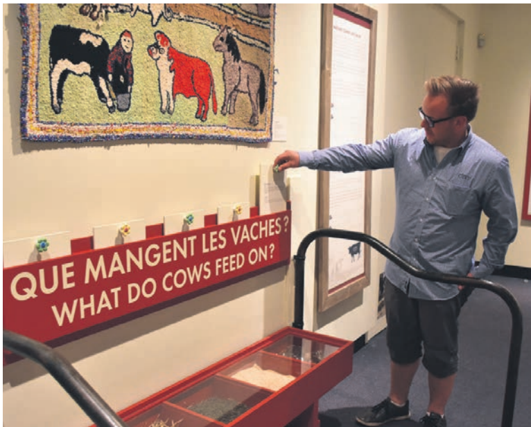
Les gens peuvent apprendre tout en manipulant certaines parties mobiles des présentoirs.