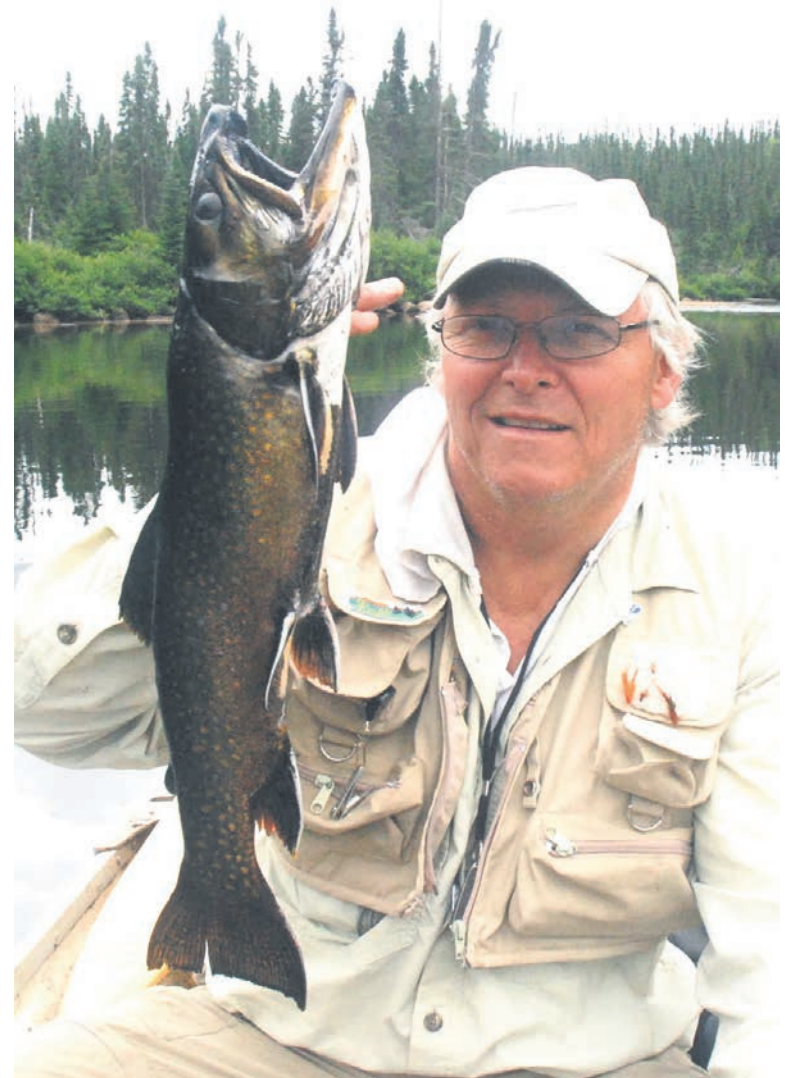
Une belle truite mouchetée pêchée dans un des lacs du parc des Grands-Jardins.