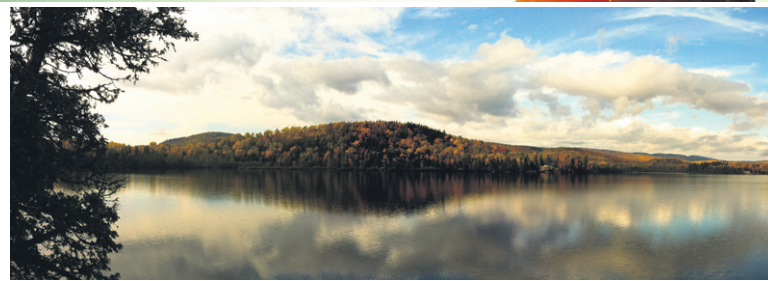
Le lac aux Canards

S'y rendre: L'entrée principale est située, via la route 138, au 31,