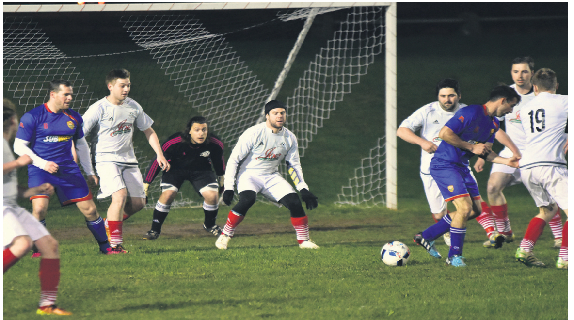
Le Joe Smoked Meat s'est réveillé beaucoup trop tard en marquant trois buts à 15 minutes de la fin lors du match de lundi dernier à Saint-Étienne.