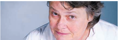
LOUISE COUSINEAU TELEVISION

TROIS PRINCESSES POUR ROLAND d'André-Line Beuparant. Image : Robert Morin. Montage : Sophie Leblond. Son : Marcel Chouinard, Richard Jutras. Montage Sonore : Martin Allard. Production : Danielle Leblanc, Coop Vidéo de Montréal. Au cinéma Ex-Centris tous les jours à 15h30 et 21h, jusqu'au 21 mars.