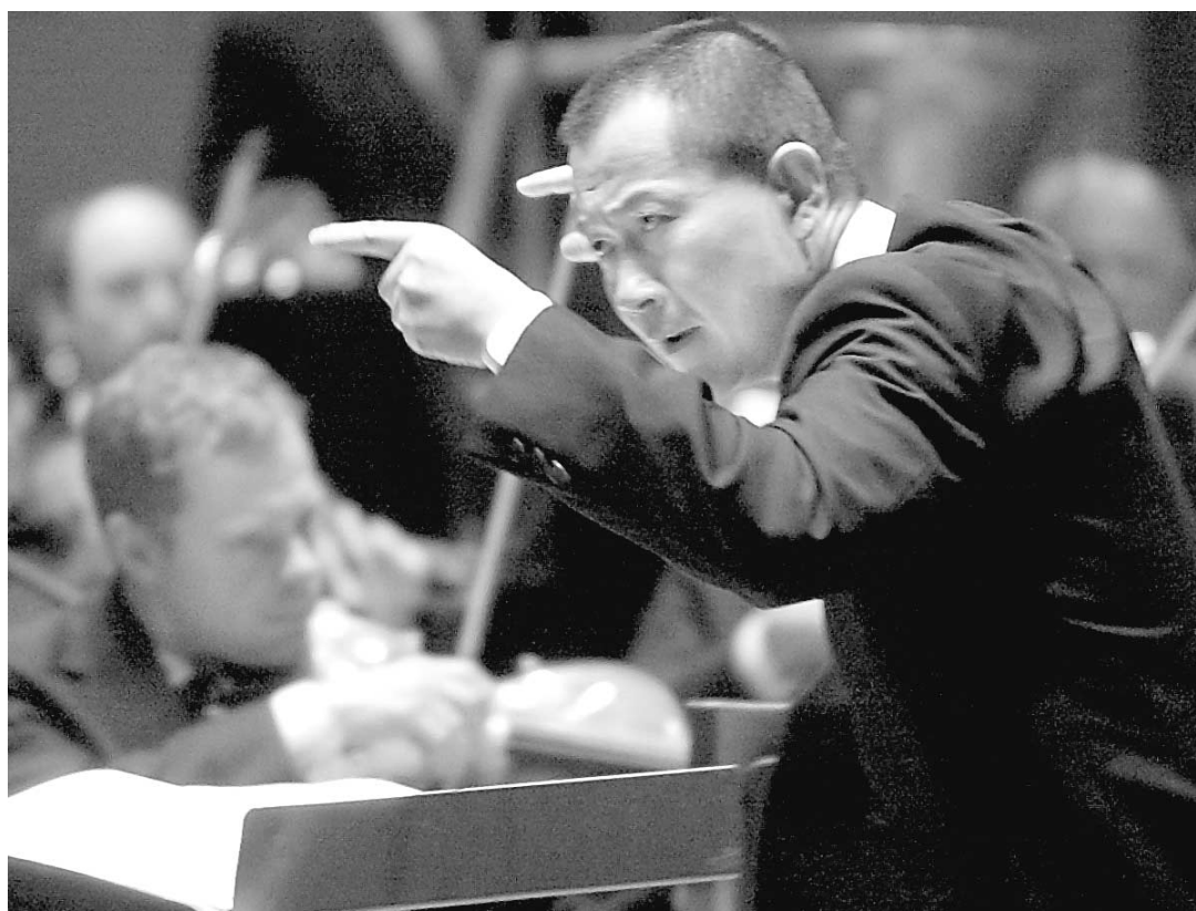
Tan Dun a subjugué l'auditoire de la salle Pollack, hier soir.

La musique de Tan Dun occupait toute la deuxième partie du concert où il a d'abord dirigé une autre de ses oeuvres, Orchestral Theatre I : Xun (flûte asiatique). Ici, comme