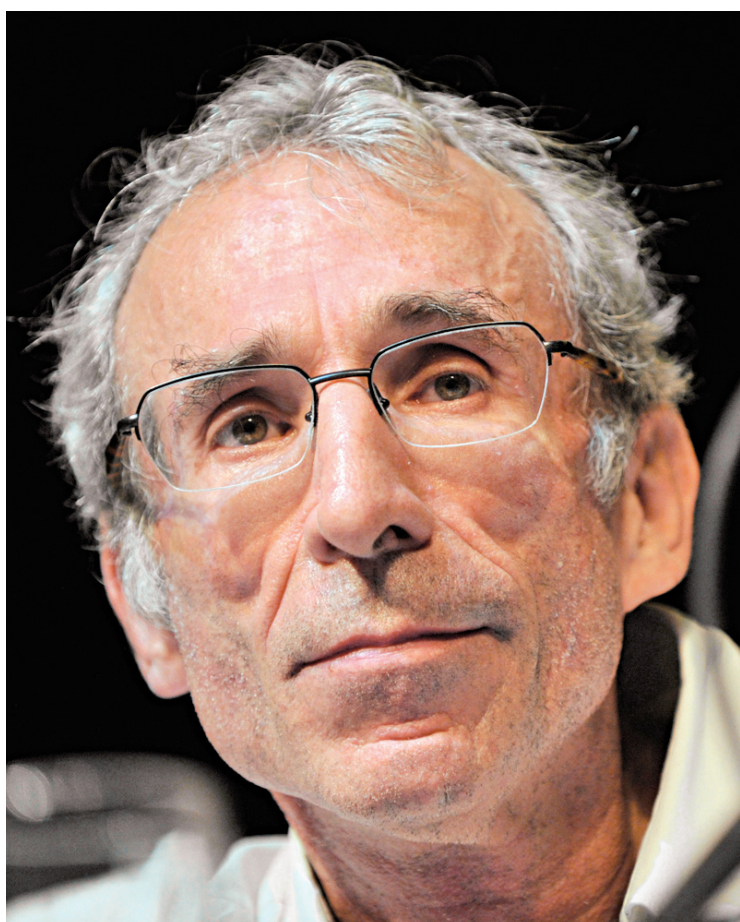
Photo prise le 30 mai 2008 à la Mutualité à Paris du philosophe Daniel Bensaïd lors d'une réunion de la Ligue communiste révolutionnaire (LCR). Bensaïd, un des fondateurs de la LCR, qui avait également participé activement à la création du NPA d'Olivier Besancenot en février dernier, est mort hier à 63 ans, des suites d'une longue maladie.

M. Bensaïd était bien connu dans les cercles de gauche du Québec. Ses textes paraissaient souvent dans les revues plus ou moins marginales. Il était enco-