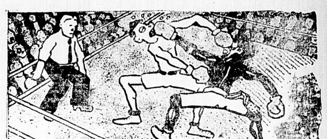
—Ça n'a rien de plus que la boxe n'est pas un sport intellectuel... Il y a parfois de rudes carnavals de lièvre!

Taupin est à la chasse. Un lièvre part. Taupin tire et blesse un labourer dans le champ voisin. Taupin se désole. On le console. La blessure n'est pas grave. —Mais non, dit-il, je ne me consolerais jamais d'avoir manqué un si beau lièvre. —:— Dialogue du jour. —Pas bêtes, les patrons bou-chiers! Vous ne savez pas ce qu'ils ont imaginé pour parer à la grève? —Non... —Il paraît qu'ils se sont assurés les concours des habitués de certains cercles, connus pour la grande habitude qu'ils ont des...ab-tages!