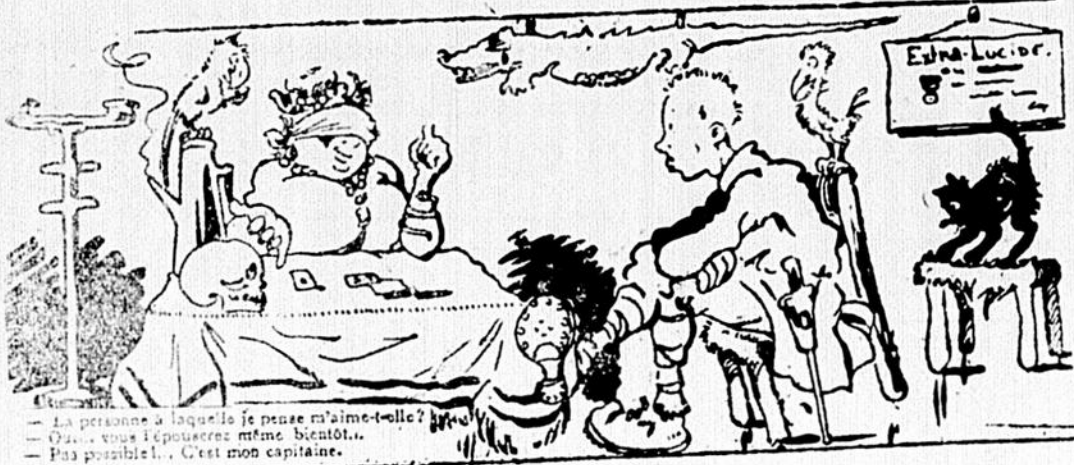
—La promesse à laquelle je pense m'aime-t-elle? —Oui... vous l'épouserez même bicatol... —Pas possible!... C'est mon capitaine.

—Une indemnité!... Mais vous n'avez pas logé de soldats? —C'est vrai, mon capitaine, mais j'avais acheté tout ce qu'il fallait pour les recevoir. —:— —Vous n'avez tenu aucun compte de mes observations à propos de votre fille; il ne fallait jamais la laisser aller à Paris. Avez-vous de ses nouvelles? —Ah! oui, j'en ai, et je vous réponds qu'elle a une belle position! ... Elle vient de m'écrire qu'elle était dame de compagnie!... —Dame de compagnie!... Ah diable!... Et où ça? —Aux Folies-Bergère!