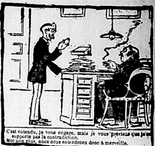
C'est entendu, je vous engage, mais je vous prie de préciser que je ne supporte pas la contradiction. Moi non plus, nous nous entendrons donc à merveille.

Une petite actrice qui a des dé-mêlés avec son directeur disait l'autre soir, au foyer de son théâtre: —Oh! mais, ça ne se passera pas comme ça... Nous plaiderons! Et je suis sûre d'avoir un juge dans ma manche! Le directeur montrant du doigt les gigantesques ballons recouvrant les gradins de sa pensionnaire: —Vous pourriez bien y loger tout le tribunal! —:— Un professeur de physique fait son cours: —Je rappellerai enfin que les Américains ont adopté l'électro-tuction comme mode de supplice. On attache le condamné à mort sur un siège spécial et on lui fait passer au travers du corps un courant de plusieurs mille volts... C'est ce qu'on nomme le fauteuil Volta. (Après réflexion.) Pour ma part, je préfère le fauteuil Voltaire... —:— Voilà, monsieur, votre douzaine de mouchoirs. Et avec ça? —Avec ça je me mouchoierai!