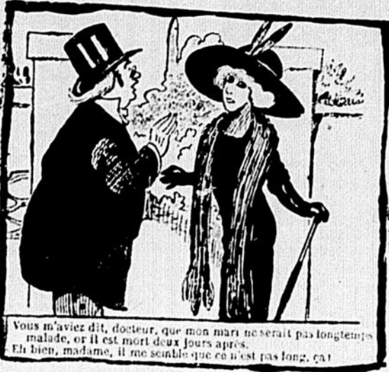
Vous m'avez dit, docteur, que mon mari ne serait pas longtemps malade, or il est mort deux jours après. Et bien, madame, il me semble que ce n'est pas long, ça!

—Tu ne sais pas? Je me marie. Ah bah! —Mon Dieu! oui. Je parie que tu ne devines pas ce que fait ma future? —Oh! parfaitement. Elle fait une bêtise. —:— Rencontré hier un pauvre diable que conduisait un caniche. Au cou du mendiant pendait un écriteau: "N'ayez pas honte de me donner un sou: je suis aveugle!" —:— Bout de dialogue. —Moi, mon cher, je ne suis pas venu à terme. —Tu es pourtant le fils d'un propriétaire.