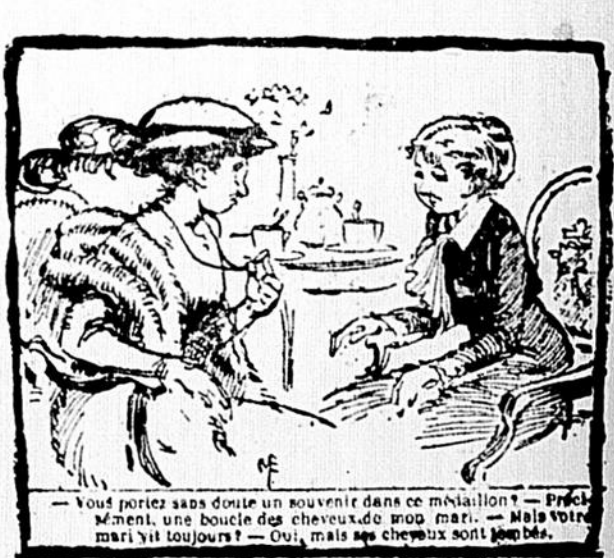
—Vous portez sans doute un souvenir dans ce médaillon? — Précisément, une boucle de cheveux de mon mari. — Mais votre mari vit toujours? — Oui, mais ses cheveux sont blancs.

—Je supporte bien des choses, mais je ne pardonne pas aux maîtres d'avoir d'aussi mauvais rhum. —:— Le client. — Garçon! il n'est vraiment pas gros, votre beefsteak! Le garçon, (avec un sourire). —C'est vrai, monsieur, mais vous verrez comme vous serez tout de même long à le manger! —:— —Marie, il y a au moins quinze jours que cette poussière est sur ce meuble! —C'est bien possible, madame, mais je n'y suis pour rien: je ne suis ici que depuis huit jours. —Vous appelez ça quatre sous de fromage? —C'est dans l'intérêt des clients. Vous ne savez donc pas que rien que dans un gramme de gruyère, il y a cent quarante mille microbes? —:— —Ah! ça... vous rincez les verres avec vos doigts? —Avec cette chaleur, les serviettes sont si sales!