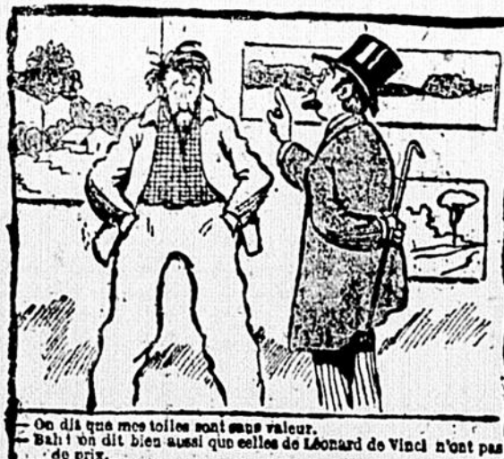
—On dit que mes talons sont mes valeurs. —Bah! on dit bien aussi que celle de Léonard de Vinci n'est pas de papier.

—Dites donc, chef, ce sont des crapauds que vous cuisinez là! —Tant pis!... fallait pas qu'ils ressemblent à des grenouilles. Dans un hôtel de Paris: —Vous reste-t-il une chambre? —Oui, monsieur, au sixième... —Et on appelle ça descendre à l'hôtel! —:— Dans un restaurant de huitième ordre: —Garçon, depuis combien de temps votre patron a-t-il acheté ces crevettes? —Monsieur, je ne sais pas. Je ne suis ici que depuis huit jours.