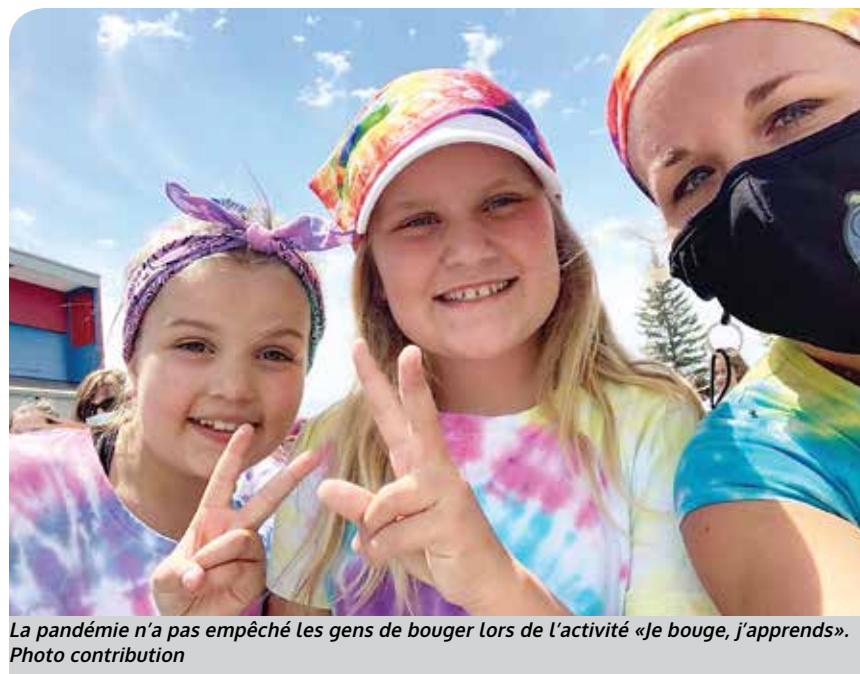
La pandémie n'a pas empêché les gens de bouger lors de l'activité «Je bouge, j'apprends».