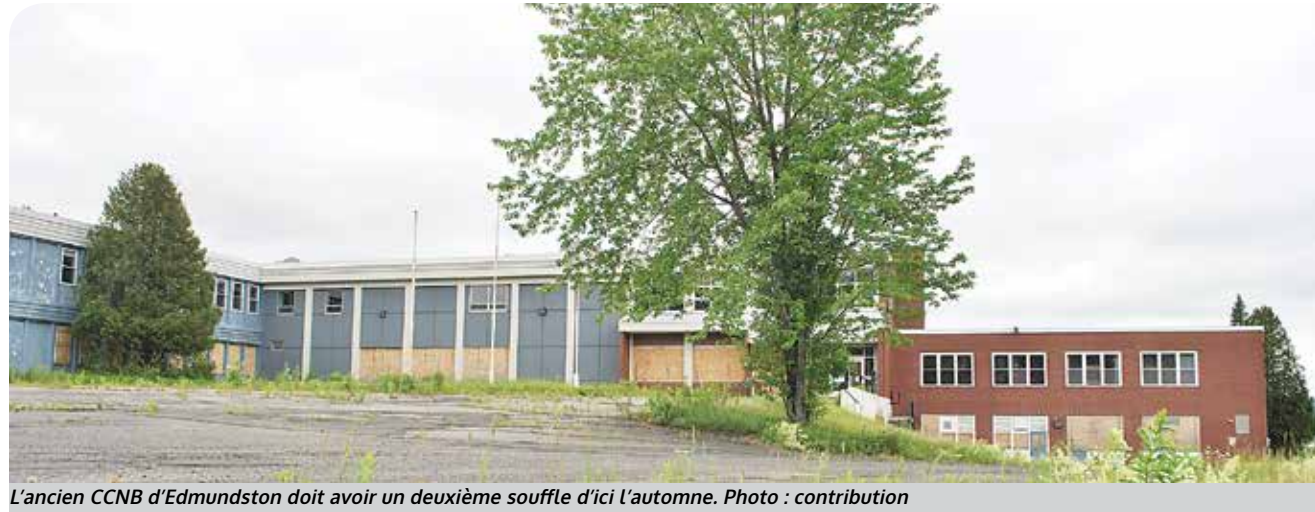
L'ancien CCNB d'Edmundston doit avoir un deuxième souffle d'ici l'automne.

« Il a fallu se revirer de bord assez vite