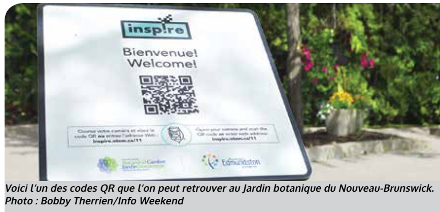
Voici l'un des codes QR que l'on peut retrouver au Jardin botanique du Nouveau-Brunswick.

De plus, en collaboration avec le Musée historique du Madawaska, des objets à valeur patrimoniale seront installés dans des endroits publics afin de les rendre accessibles à la population en général.