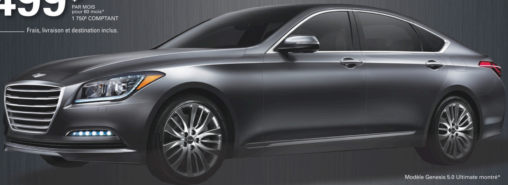
Modèle Genesis 5.0 Ultimate montré*

— Frais, livraison et destination inclus.