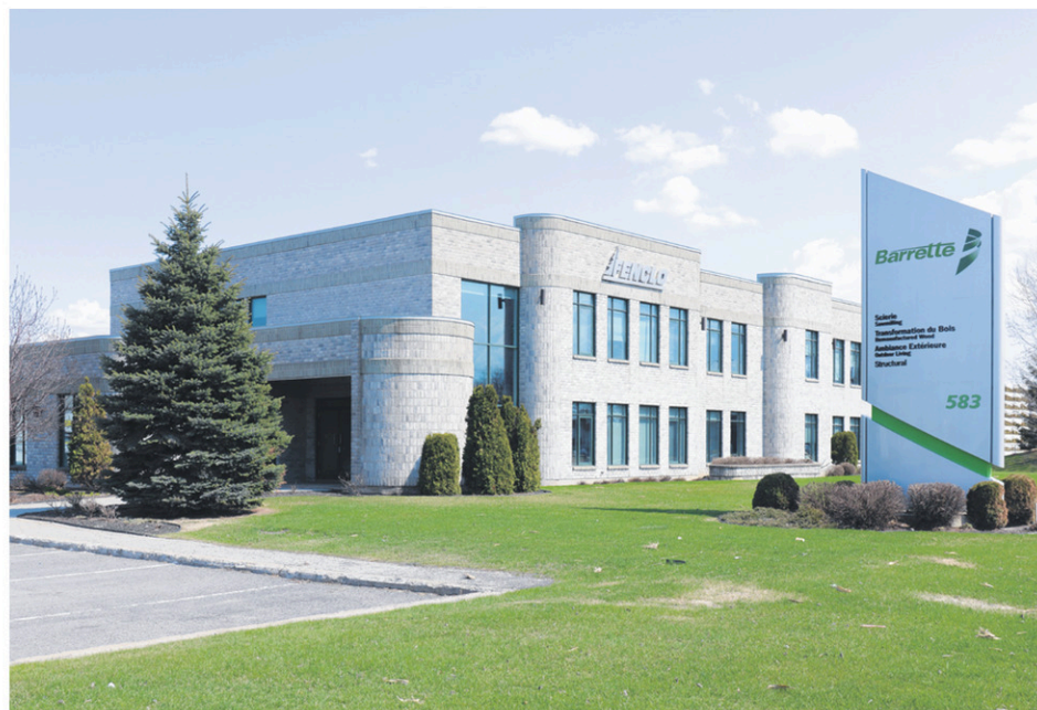
Barrette Wood inc. monte au classement des employeurs manufacturiers grâce à l'ajout d'une trentaine de postes équivalents à temps complet.

Cette même étude révèle également que la perte d'emplois dans ce secteur est attribuable à une baisse de la fabrication de biens non durables alors que l'emploi tend à se stabiliser depuis 2012 dans les entreprises qui se spécialisent dans les biens durables. Bref, un secteur en changement.