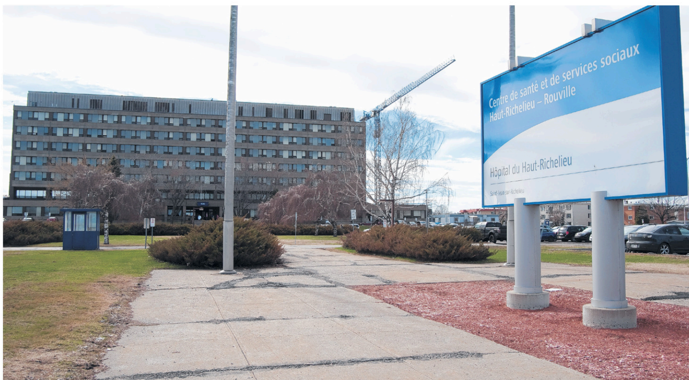
Pour une quatrième année consécutive, le CSSS Haut-Richelieu occupe le premier rang du classement.

Le classement permet également de constater le rôle essentiel que jouent