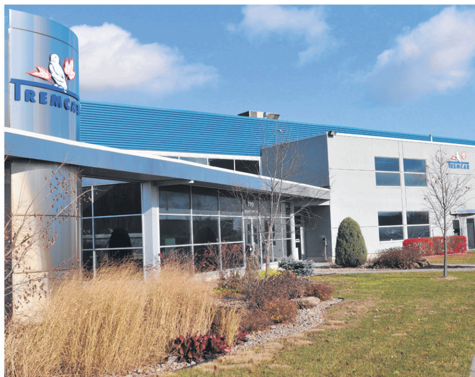
Les investissements annoncés par Tremcar au cours de l'année l'ont fait grimper au classement. La compagnie occupe maintenant le 6 e rang.

À l'inverse du secteur public qui est tributaire des décisions gouvernementales, le secteur privé doit conjuguer avec la réalité d'une économie qui se remet tranquillement de la tempête de 2009. Bien que les premiers effets de la baisse du dollar canadien se fassent déjà sentir, il faudra attendre le classement de 2015 pour en connaître les répercussions sur les emplois locaux.