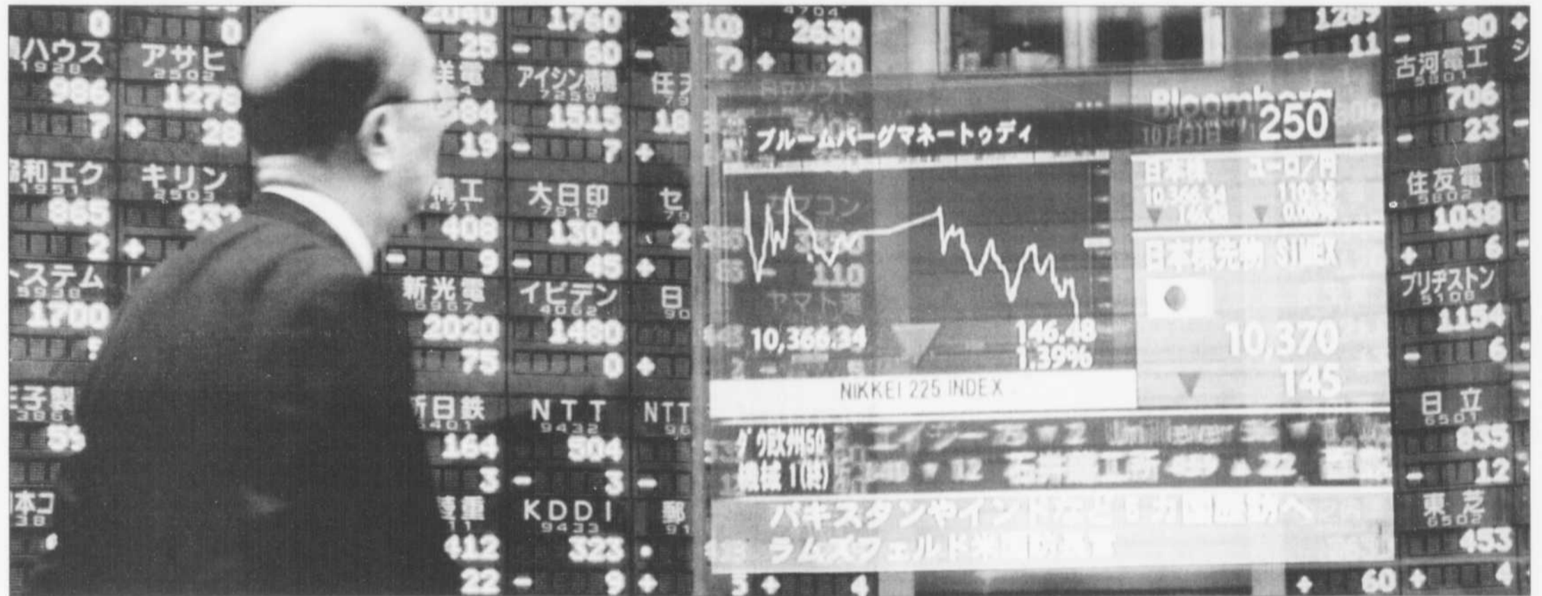
Difficile semaine à la Bourse de Tokyo, alors que son principal indice, le Nikkei, a glissé de quelques centaines de points, avant de finalement reprendre un peu du poil de la bête hier.

Un budget pour les 18 prochains mois, ce n'est pas pire que l'absence de budget pendant 22 mois à Ottawa. Mais n'oubliez pas, madame Marois, le « war room... Le war room et la botte aux fesses des pousse-crayons de vos ministères!