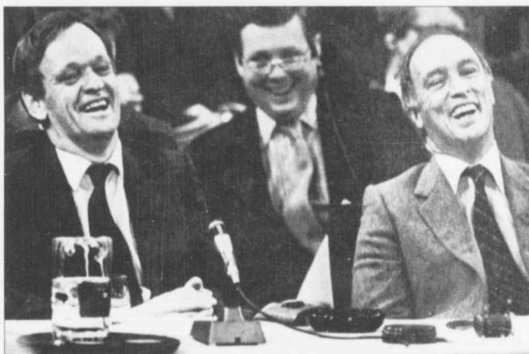
Jean Chrétien (alors ministre de la Justice) et Pierre Trudeau s'esclaffent à la suite d'une remarque lancée par le premier ministre ontarien Bill Davis, à la Conférence des premiers ministres.

Le soir même, dans le salon de la résidence de Jean Chrétien, rue Bower à Ottawa, le représentant de l'Ontario — allié d'Ottawa — et celui de la Saskatchewan — membre de «la gang des huit» —, envisagent pour la première fois le «compromis»: la nouvelle Constitution contiendrait une Charte des droits et libertés qui, en plus des droits fondamentaux comme la liberté de religion, de parole ou d'association et l'égalité des sexes, protégerait les droits des minorités linguistiques et reconnaîtrait les droits ancestraux des peuples autochtones — les Inuits, les