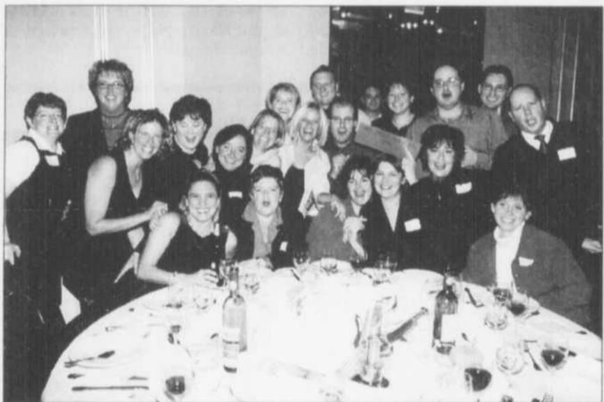
Les anniversaires de promotion - on aperçoit ici des membres de la promotion 1991 en relations industrielles - ont contribué, cette année encore, à la popularité croissante des Retrouvailles de l'ADUL.

Les retrouvailles annuelles organisées par l'Association des diplômés de l'Université Laval (ADUL) ont commencé le 12 octobre alors que près de 120 diplômés de la promotion 1951, accompagnés de leur conjointe ou de leur conjoint, de leurs enfants et amis, se réunissaient dans la Salle de bal du Château Frontenac afin de célébrer, lors d'un gala-