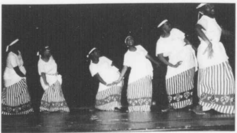
Danse folklorique rwandaise

Le groupe de danse Inkindi, en collaboration avec l'Association des étudiants rwandais de l'Université Laval, présente le spectacle «La danse folklorique rwandaise», à l'amphithéâtre Hydro-Québec du pavillon Alphonse-Desjardins, le vendredi 9 novembre à 20 h. Plus de 25 danseurs et danseuses, majoritairement étudiantes et étudiants à l'Université, vous feront découvrir des rythmes typiques du Rwanda. Cette troupe de danse folklorique désire, entre autres, participer à la promotion du multiculturalisme et favoriser les échanges entre la population de la région et la communauté rwandaise. Les billets sont en prévente au Service des activités socioculturelles, au local 2344 du pavillon Alphonse-Desjardins, au coût de 10 $, et de 5 $ pour les enfants de moins de 12 ans (12 $ à l'entrée).