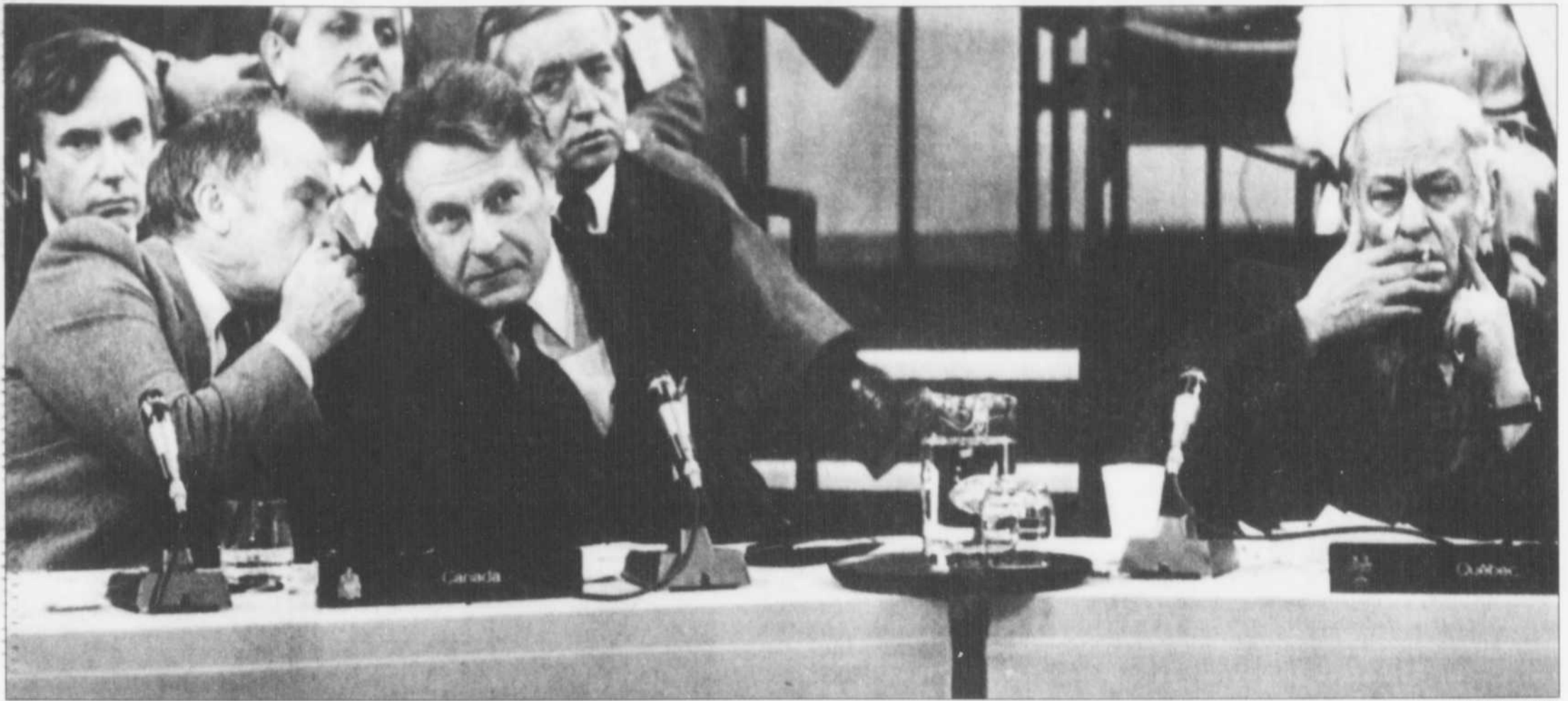
René Lévesque (à droite) fume tranquillement sa cigarette tandis que le premier ministre Pierre Elliott Trudeau discute à voix basse avec son ministre des Finances, Allan MacEachan, à la conclusion de la Conférence des premiers ministres, à Ottawa, le 5 novembre 1981. Le matin même, le Canada avait une nouvelle Constitution, que toutes les provinces, sauf le Québec, avaient signée. René Lévesque écrira plus tard dans ses «Mémoires»: «Le 20 mai 1980 avait été jour de deuil, infiniment triste. Ce 5 novembre 1981, c'était jour de rage et de honte.»