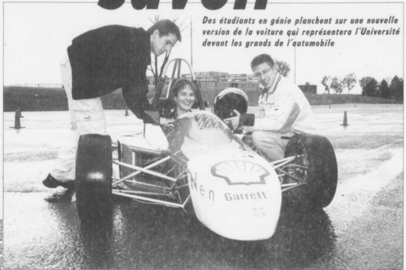
Des étudiants en génie planchent sur une nouvelle version de la voiture qui représentera l'Université devant les grands de l'automobile