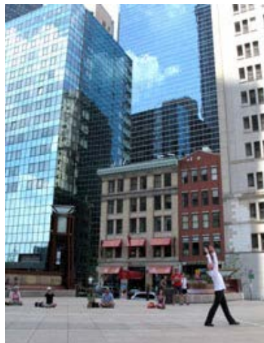
Paul-André Fortier interprétant Solo 30/30 à New York.

>>> Détails sur le site officiel du film