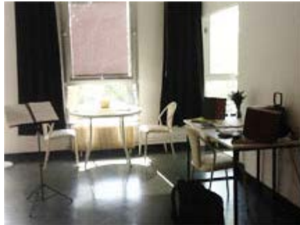
Intérieur du studio.