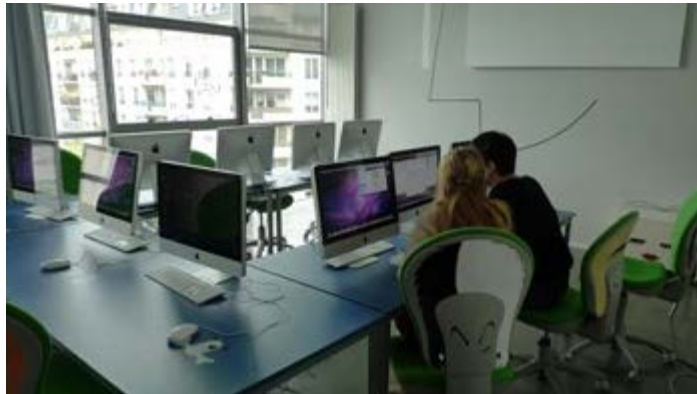
Artistes au travail au "Cube" d'Issy-les-Moulineaux

Considérant l'importance pour le gouvernement du Québec de poursuivre l'établissement de liens culturels durables avec la France, le Conseil des arts et des lettres du Québec (CALQ) a conclu une entente de partenariat de trois ans avec l'Institut français afin d'offrir aux artistes québécois l'opportunité de réaliser des résidences de ressourcement et de création à Paris dans le domaine des arts numériques.