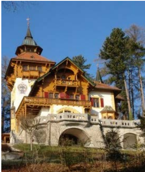
Villa Waldberta.

Considérant l'importance pour le gouvernement du Québec de développer des liens culturels durables avec la Bavière, le Conseil des arts et des lettres du Québec (CALQ) a conclu une entente de partenariat de deux ans avec l'organisme Kulturreferat München (Bavière) / Villa Waldberta pour réaliser un programme de résidences de création et de ressourcement en littérature entre le Québec et la Bavière.