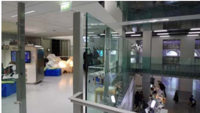
La Gaité lyrique, à Paris

En contrepartie, deux artistes français seront accueillis à Montréal et travailleront soit à la Société des arts technologiques, soit à OBORO.