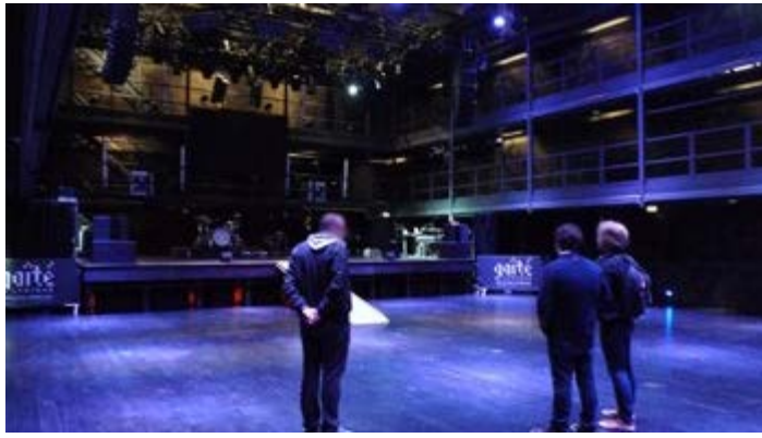
La Gaité lyrique, à Paris