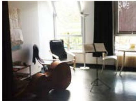
Intérieur du studio.