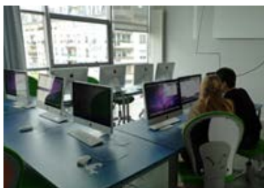
Le Cube, à Issy-les-Moulineaux.