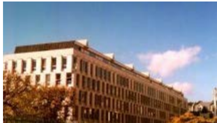
La Cité Internationale des Arts à Paris