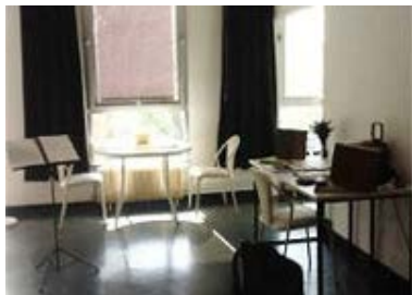
Intérieur du Studio du Québec à Paris.