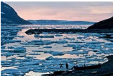
Kangiqsujuaq, un des lieux de résidences au Nunavik.

Soutien aux artistes et aux écrivains professionnels de la jeune relève ainsi qu'à ceux ayant 10 ans ou moins de pratique artistique : 22 octobre 2012