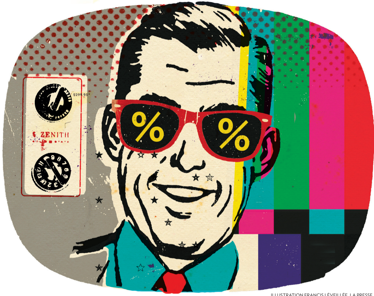
ILLUSTRATION FRANCIS LÉVEILLÉE, LA PRESSE