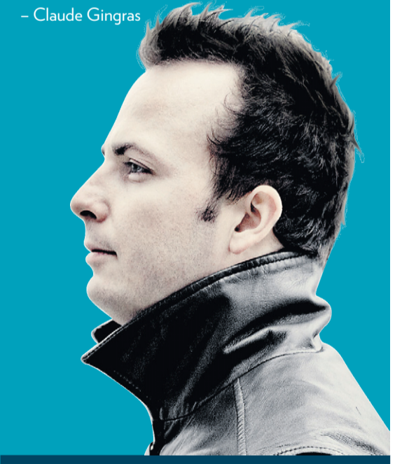
Yannick Nézet-Séguin