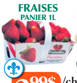
FRAISES PANIER 1L