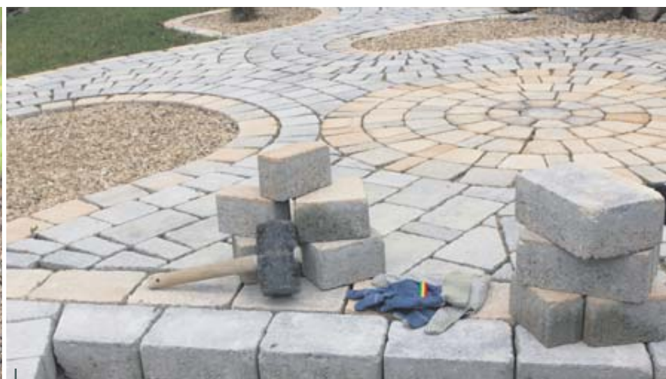
La pose de dalles.