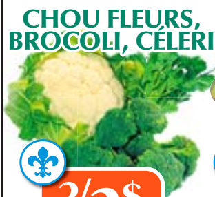
CHOU FLEURS, BROCOLI, CÉLÉRI