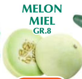
MELON MIEL GR.8