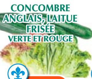
CONCOMBRE ANGLAIS, LAITUE FRISÉE VERTE ET ROUGE