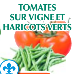
TOMATES SUR VIGNE ET HARICOTS VERTS