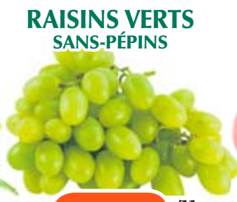
RAISINS VERTS SANS-PÉPINS