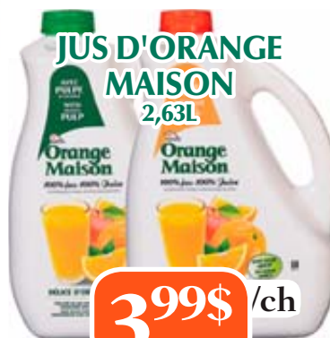
JUS D'ORANGE MAISON 2,63L