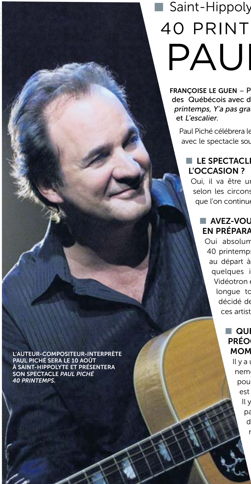
L'AUTEUR-COMPOSITEUR-INTERPRÈTE PAUL PICHÉ SERA LE 10 AOÛT À SAINT-HIPPOLYTE ET PRÉSENTERA SON SPECTACLE PAUL PICHÉ 40 PRINTEMPS.