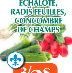
ÉCHALOTE, RADIS FEUILLES, CONCOMBRE DE CHAMPS