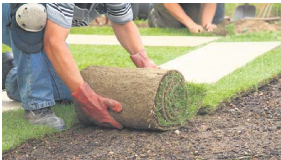
La pose de tourbe de première qualité

PUBLIREPORTAGE - Paysagement Dénégement Yannick se spécialise dans les travaux de déneigement et de paysagement dans les environs de Saint-Jérôme depuis 10 ans.