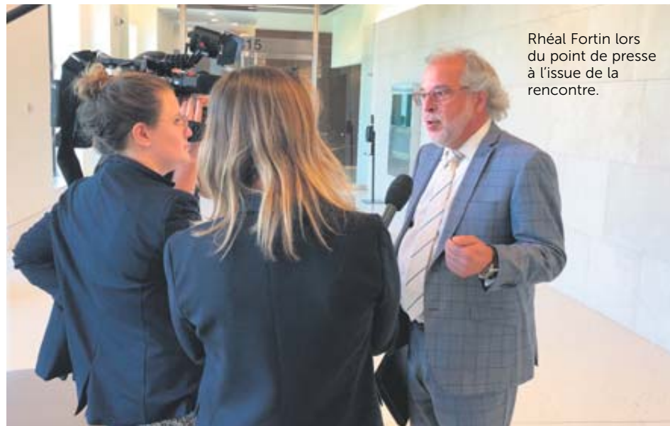
Rhéal Fortin lors du point de presse à l'issue de la rencontre.

FRANCE POIRIER – Le député de Rivière-du-Nord et porte-parole du Bloc Québécois en matière de protection des renseignements personnels, Rhéal Fortin, estime que le gouvernement fédéral doit passer au 21 e siècle avec les risques de vol d'identité.